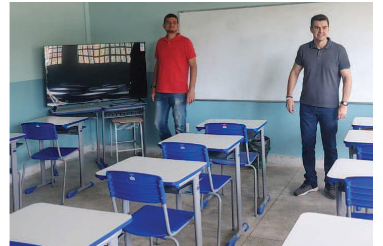
PREFEITO e secretário de Saúde visitaram a obra