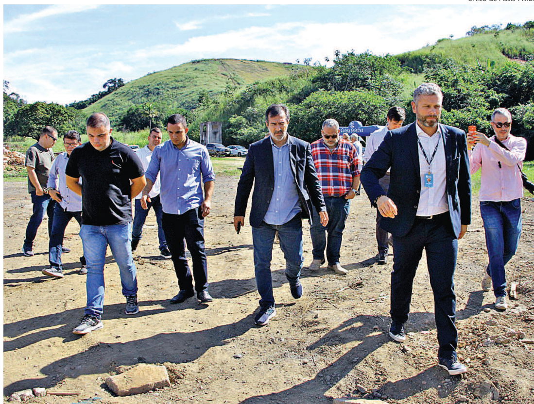
COMITIVA percorreu o Condomínio Industrial