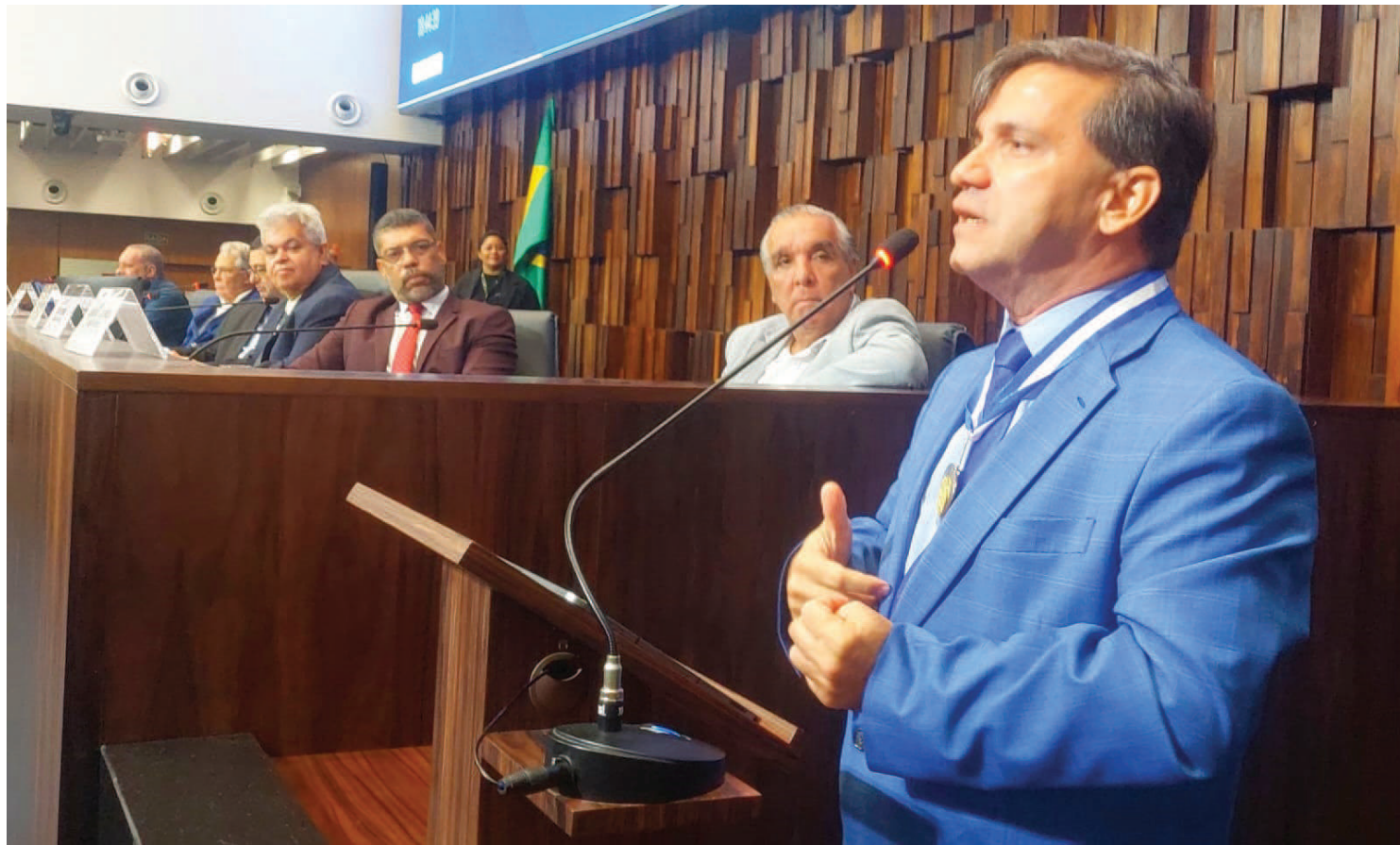
SESSÃO ACONTECEU na tarde desta segunda-feira

Juntos, os dois jornais circulam em 22 cidades do interior do Estado e estão presentes em