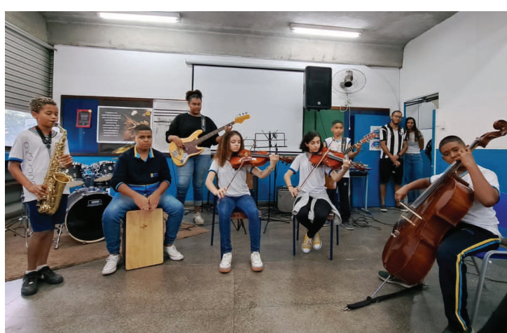
APRESENTAÇÃO aconteceu nesta segunda-feira, dia 8

Neste ano, o intervalo de tempo entre os eventos será maior do que em relação aos outros, que eram realizados semanalmente. O espaço entre as apresentações é para que os alunos tenham um desenvolvimento mais aprimorado.