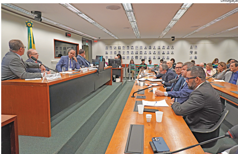
AUDIÊNCIA debateu vazamento de material radioativo no mar de Angra no ano passado

Foi durante a audiência pública realizada na Câmara dos Deputados ontem que a Eletronuclear teria dito que não tem dinheiro para pagar as compensações ambientais para Angra dos Reis. Atualizados, são R$ 264 milhões devidos pela construção da usina nuclear de Angra 3. A União tem falado sobre