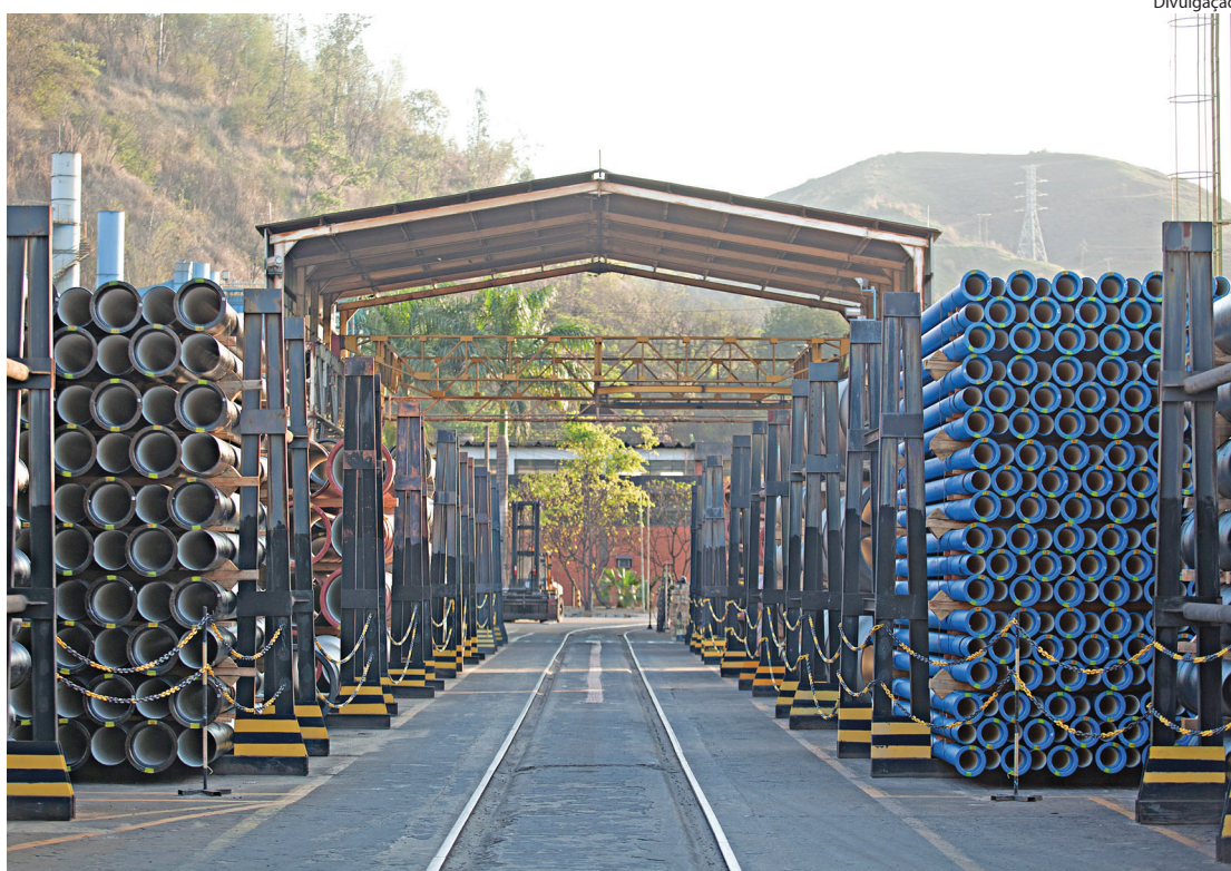
PROGRAMA tem como objetivo ter 30% de mulheres nos cargos de liderança