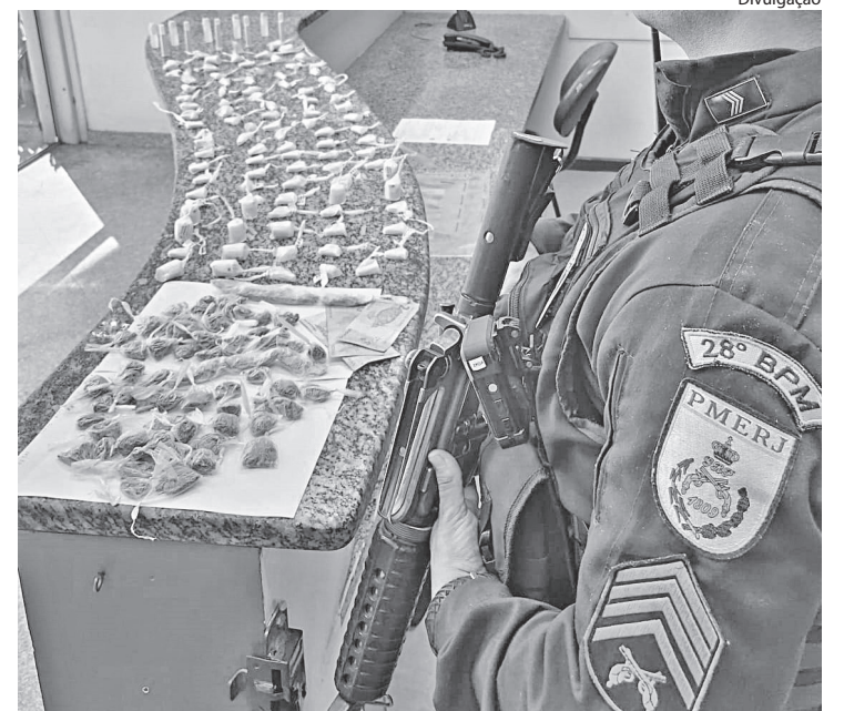
OS CASOS foram registrados em Volta Redonda e Barra Mansa

Outros dois traficantes que estavam com o suspeito conseguiram fugir e o caso foi registrado na 90ª DP e ele, autuado no artigo 33 do CP, ficando preso.