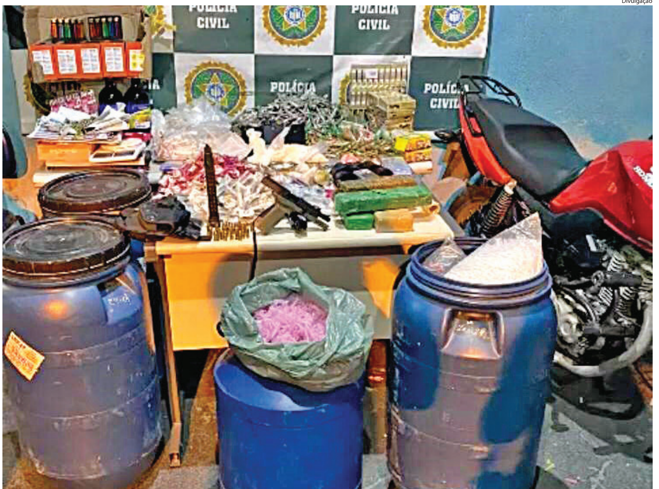
MATERIAL estava dentro de uma residência

Foram apreendidos em Volta Redonda maconha, cocaína, crack, pistola, munições e outros materiais