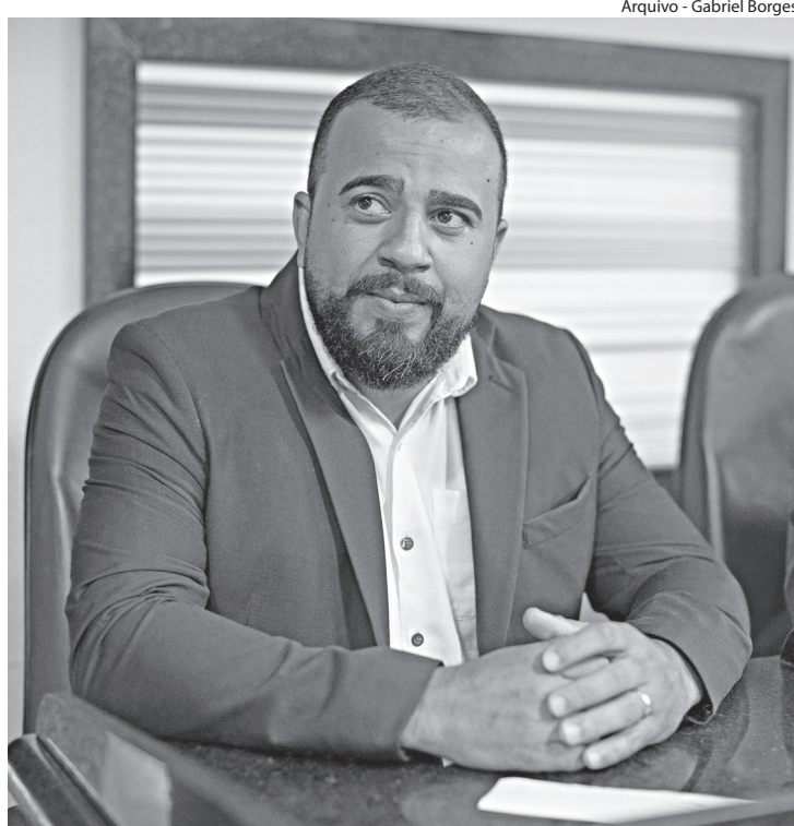
OBJETIVO é recuperar a defasagem de aprendizagem ocasionada pela Covid-19