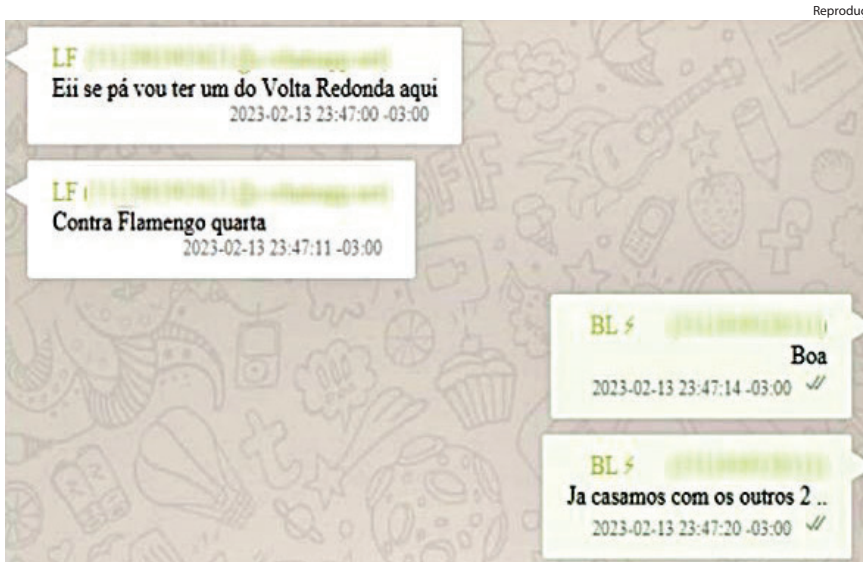
ENVOLVIDOS trocaram mensagens por aplicativos

Clube se manifestou dizendo que não compactua com conduta antidesportiva e acompanhará desenrolar das negociações