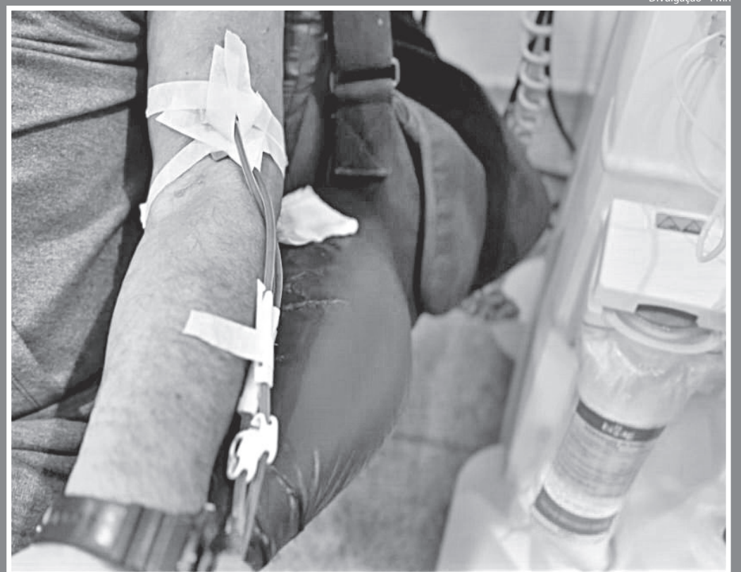
DIOGO anunciou que todo o tratamento de hemodiálise de pacientes de Resende será feito na clínica na cidade