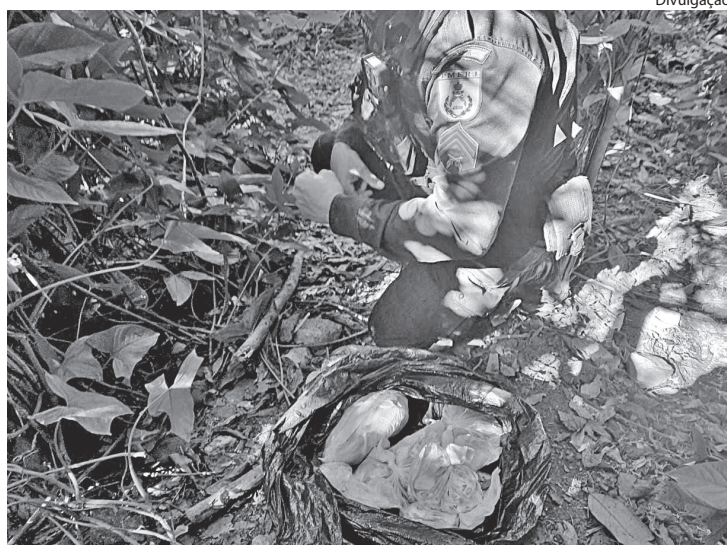
OS MILITARES também encontraram maconha e cocaína

O material foi encontrado em uma área de mata após denúncia anônima e estava em uma sacola. O criminoso fugiu e não foi localizado.