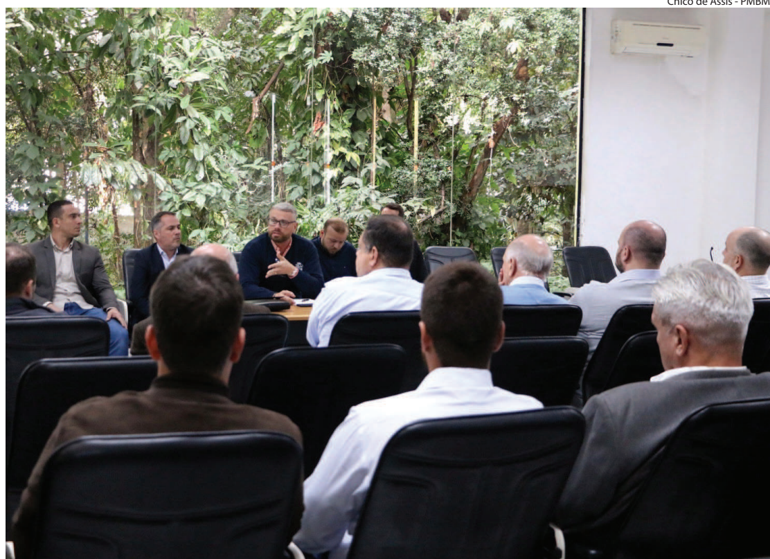
O EVENTO aconteceu no Parque Natural de Saudade