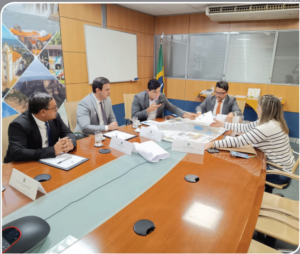
NO MINISTÉRIO DO TURISMO foi entregue o projeto do Parque de Aventuras