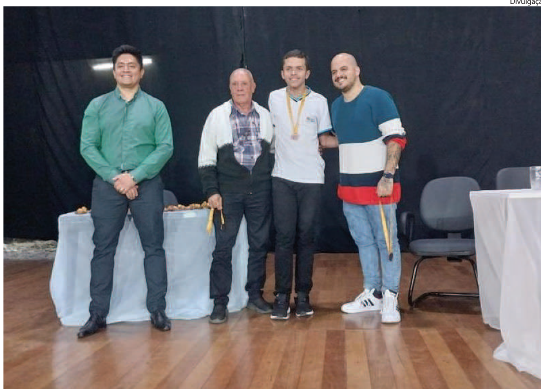
PREMIAÇÃO aconteceu ontem no Colégio Pedro II, na cidade do Rio