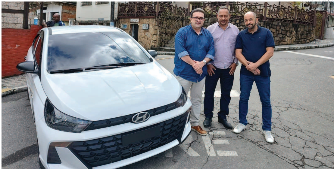
MAIS UM automóvel zero quilômetro está a serviço do Legislativo