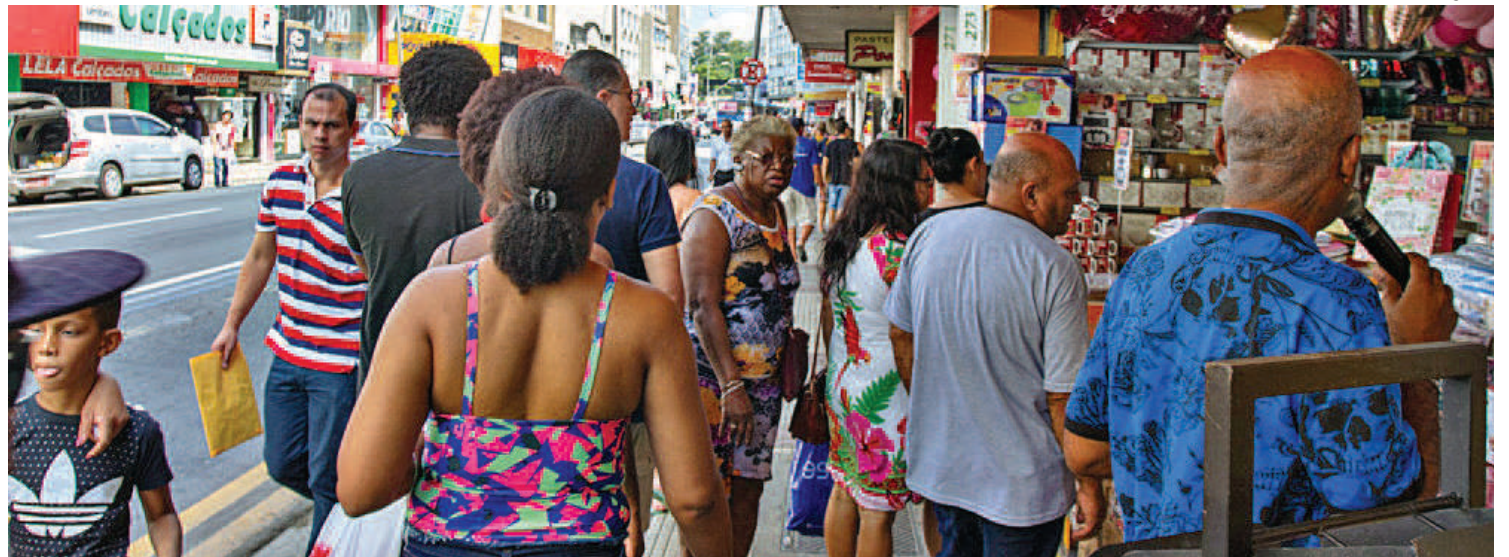
VOLTA REDONDA registrou 585 vagas de emprego

Em um recorte por gênero, o Caged do mês de maio revela que foram gerados 65 mil postos de trabalho para mulheres e quase 90 mil para homens.