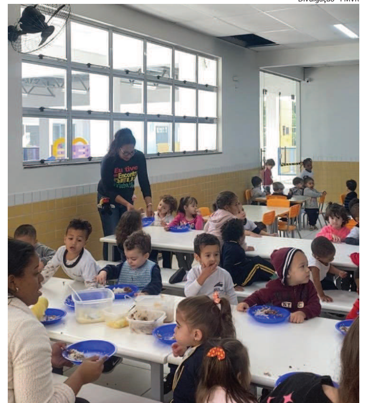
ATUALMENTE, 305 alunos recebem alimentação diferenciada

“A alimentação escolar dos nossos alunos com restrições alimentares é adaptada o mais semelhante possível do cardápio padrão, conforme a necessidade apresentada no laudo médico entregue para a direção da unidade escolar. Sendo de extrema importância que a família esteja sempre atualizando o laudo com intervalo de seis meses. Desta forma, todo aluno portador de uma alimentação restritiva, devidamente diagnosticada, tem o direito a receber atenção especial relacionada a sua alimentação, por meio de substituições dos alimentos alergênicos, ou através de cardápio individualizado para os casos mais complexos ou de associação de vários diagnósticos e necessidades nutricionais especiais”, comentou a coordenadora.