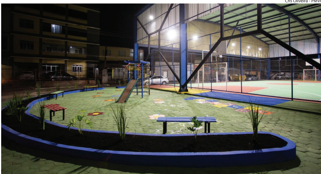
Cris Oliveira - PMVR

ENTREGA das obras seguem até o fim do mês