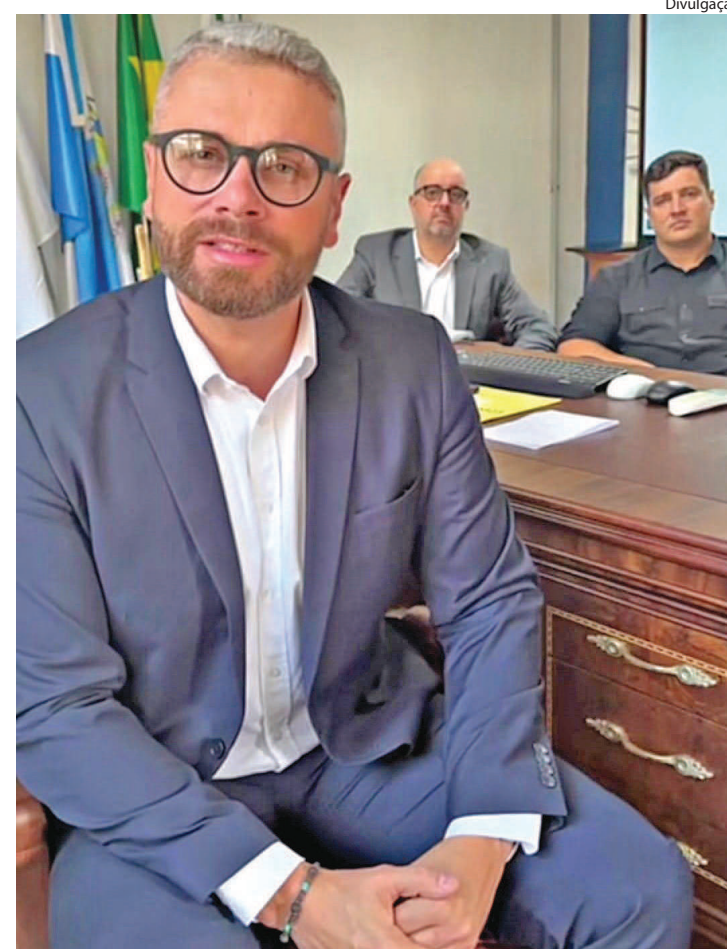
DRABLE destacou o ajuste financeiro na prefeitura