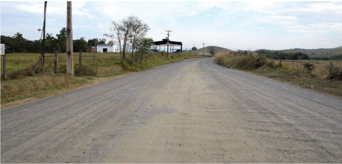
OBRAS foram iniciadas nesta semana