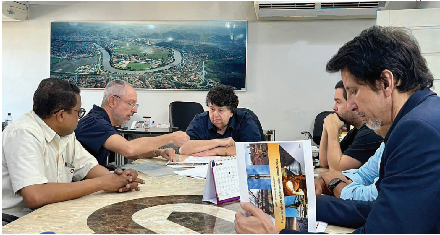
O DOCUMENTO foi entregue nesta terça-feira, 11, no gabinete