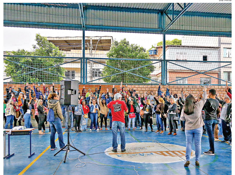
PROFESSORES durante assembleia na tarde desta terça-feira, dia 29