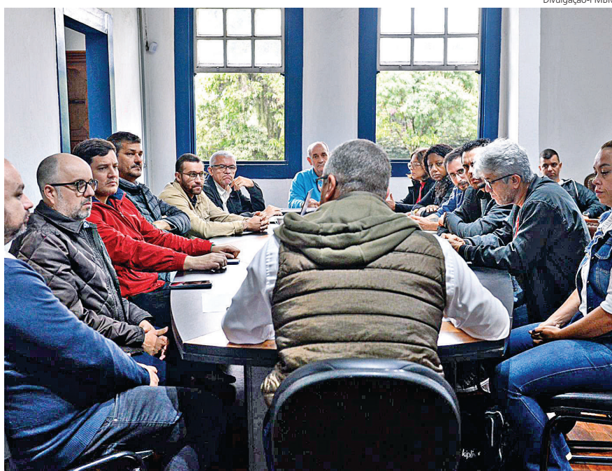
PREFEITO se reuniu com representantes dos professores e do Sepe pela manhã