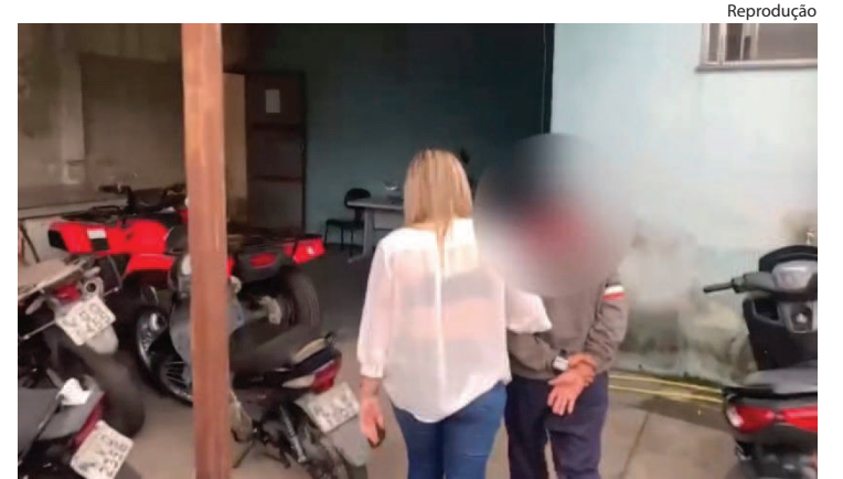
ELE estava foragido da Justiça desde 2015