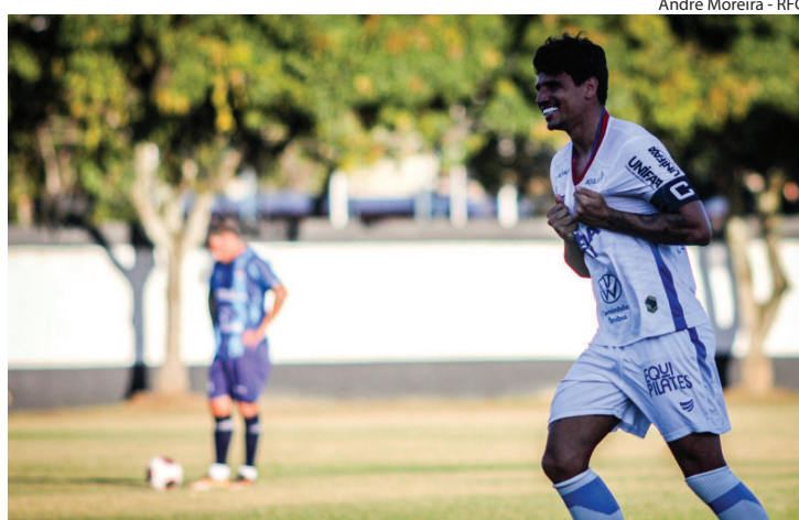
CONFRONTO acontece nesta quarta-feira, dia 30, no Estádio Giulite Coutinho