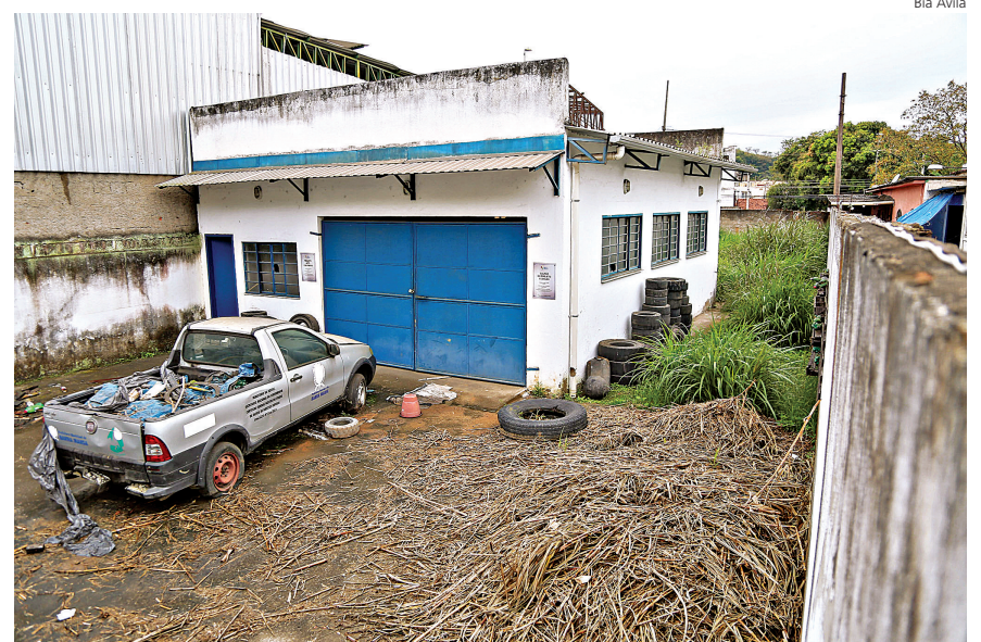
LOCAL FOI inaugurado pela prefeitura de 2019