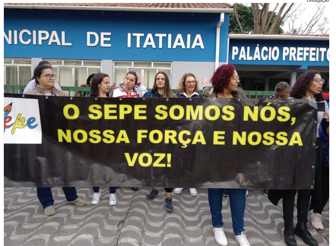
PROFISSIONAIS DE EDUCAÇÃO protestam em frente à Câmara Municipal

A Prefeitura reafirmou que sobre o Plano de Cargos e Salário dos Servidores, já foi publicado no Boletim Oficial