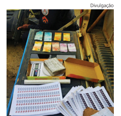
PARTE do material apreendido e levado para a sede da 91ª DP

Os agentes também flagram em Valença na segunda-feira um homem com drogas. Ele foi abordado pela equipe no bairro Água Fria por ser conhecido pela guarnição pelo