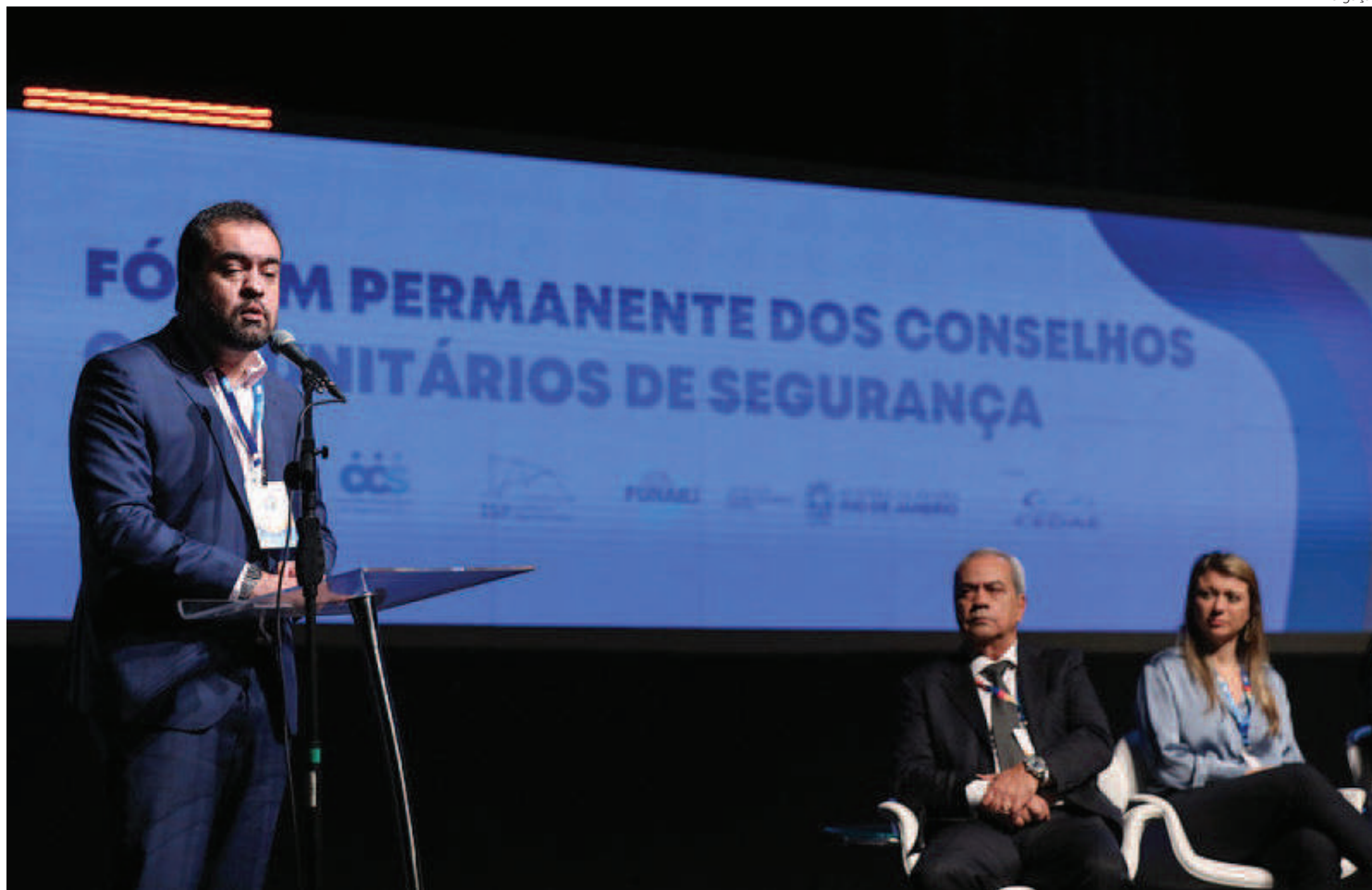
O EVENTO aconteceu no Teatro João Caetano

O Sul Fluminense, cuja região é identificada como Área Integrada de Segurança Pública