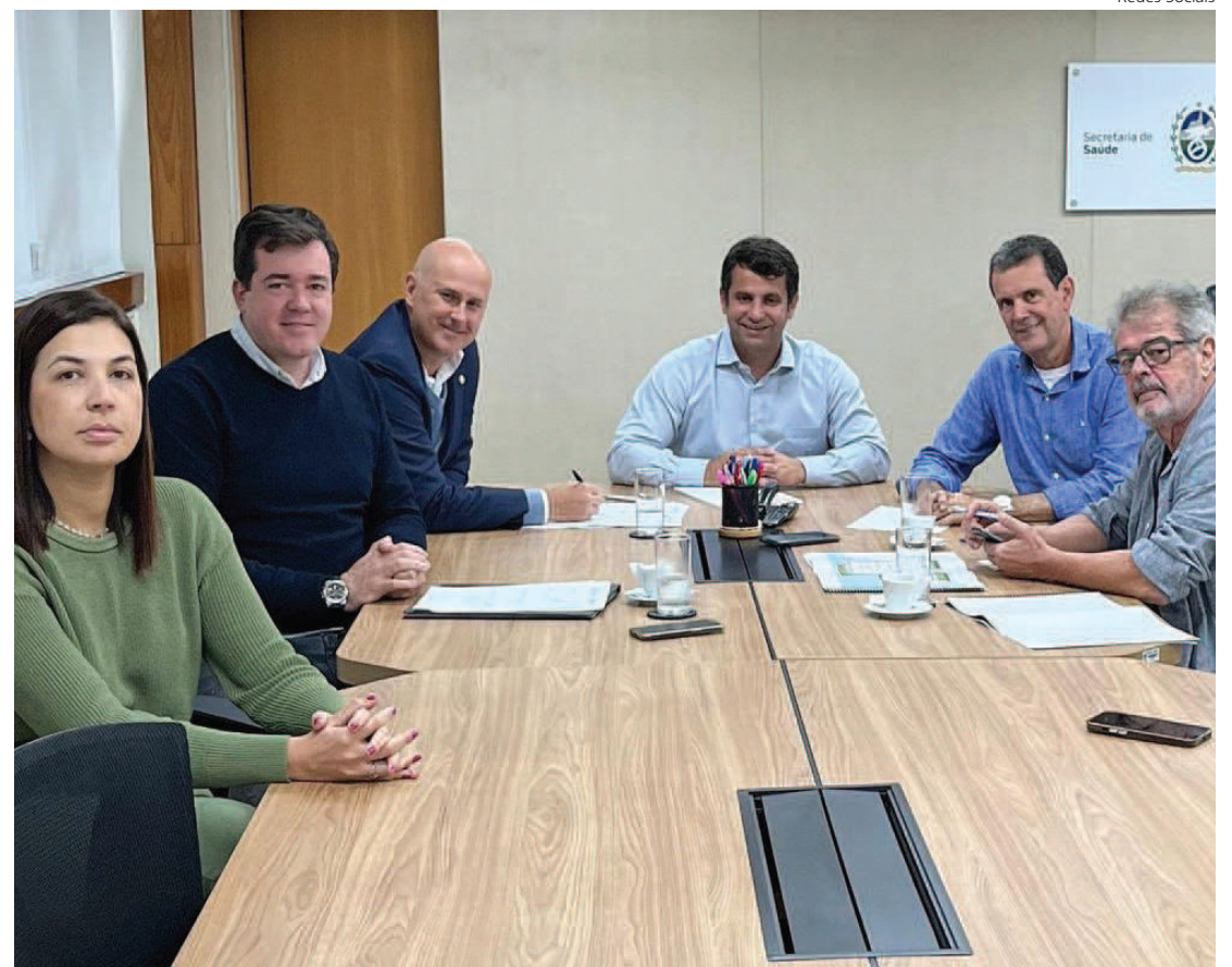
NOTÍCIA foi dada durante reunião na segunda-feira, no Rio

Sobre a Policlínica, após a obra, a intenção é que tenha maior acolhimento e conforto aos pacientes, com possibilidade de mais ampliar o número de atendimento, pois serão feitas mais duas salas. A obra começará em janeiro de 2024 e tem previsão de término em seis meses.