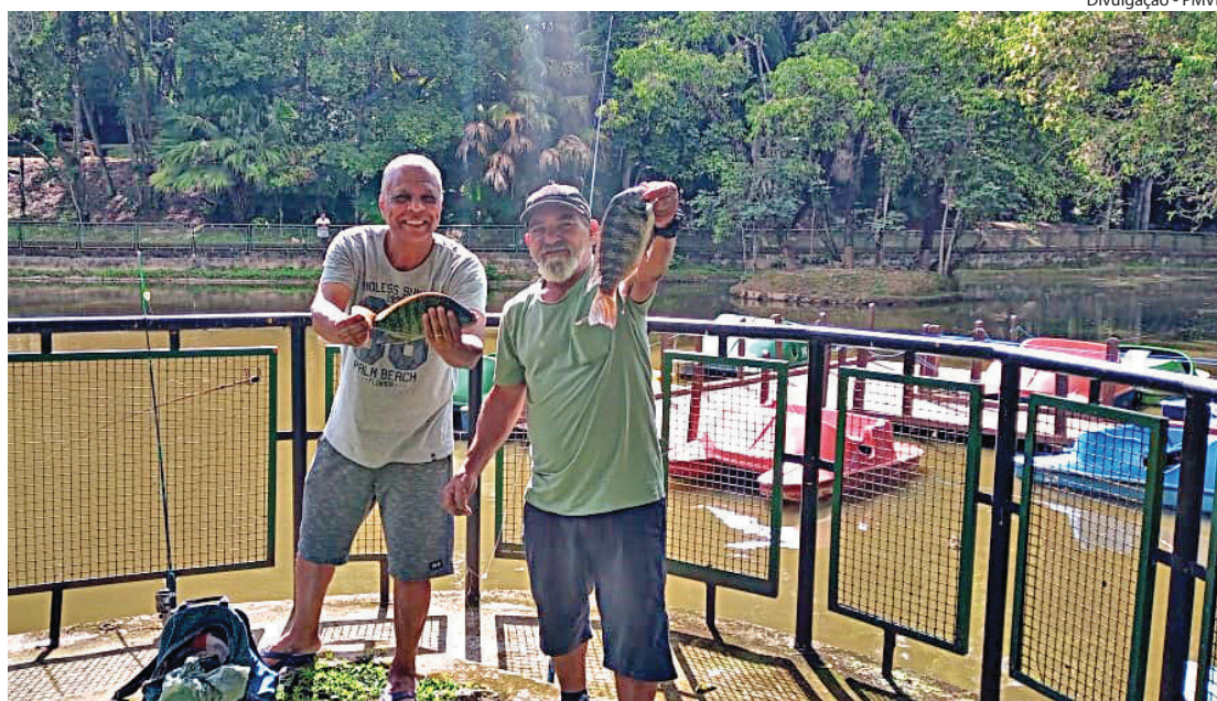
ATIVIDADE tem atraído diversos moradores da cidade do Aço

O projeto funciona às segundas-feiras, das 7 às 16 horas, período que o espaço fecha para os visitantes e realiza limpeza e manutenção, além de abrir exclusivamente para a pesca gratuita oferecida pelo "Pes-