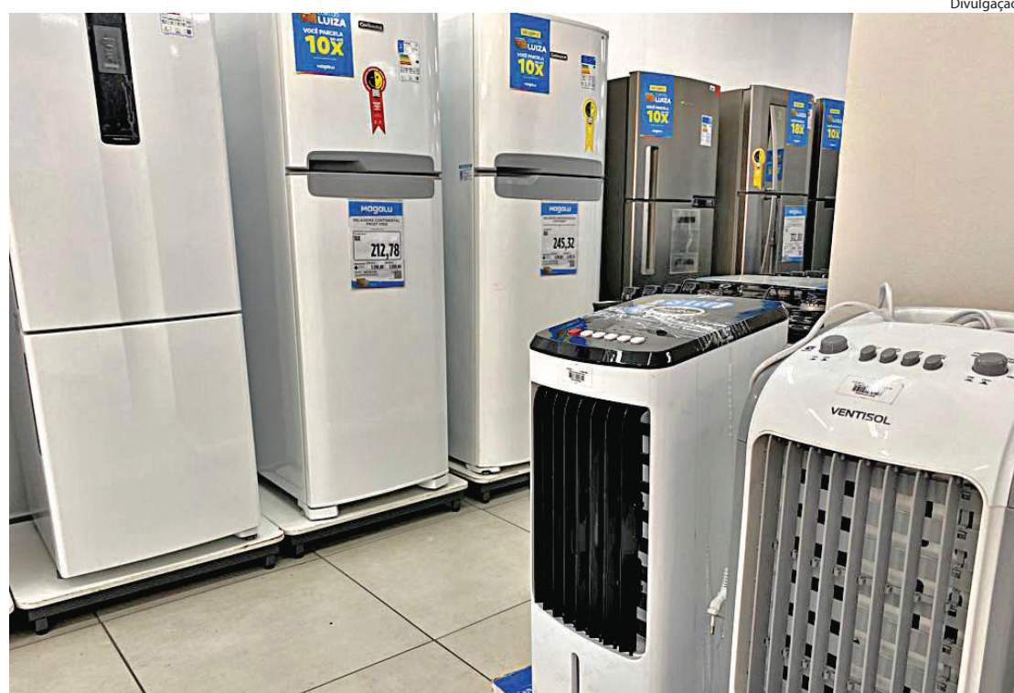
DATA é esperada com ansiedade por muitos consumidores