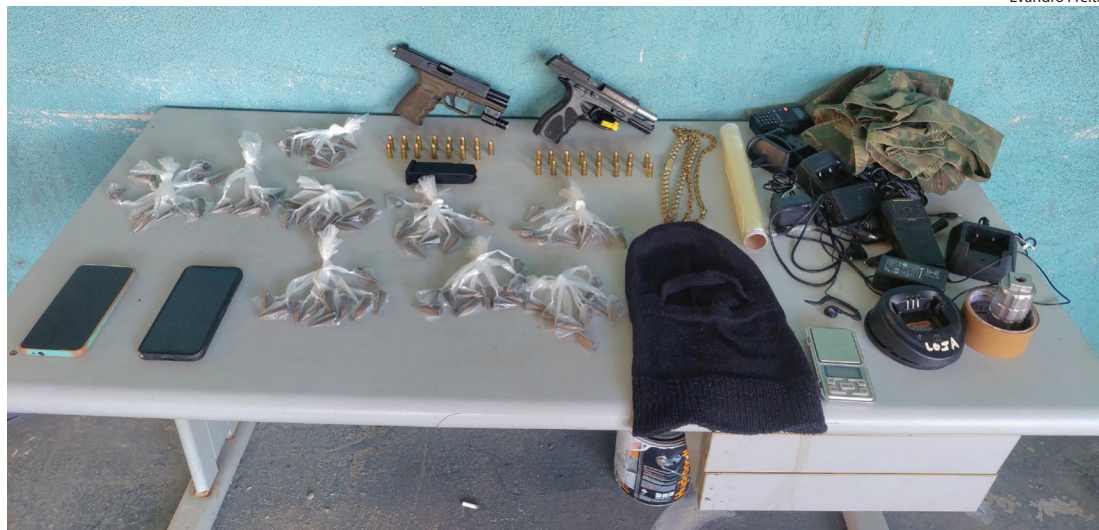
MATERIAL APREENDIDO pelos agentes na ação do bairro Vila Brasília

A PM também apreendeu drogas em bairros de Volta Redonda; em um dos casos, dois supostos chefes do tráfico foram presos; em outro caso, um homem entrou com um simulacro de pistola em um hospital