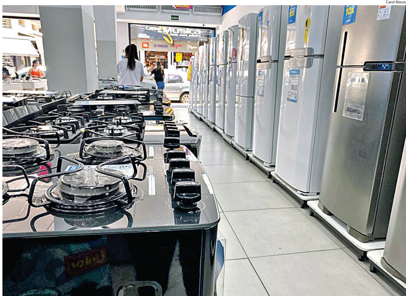
OFERTAS ENCHEM os olhos dos consumidores, mas é preciso cuidado

Economista recomenda aos consumidores que realizem pesquisas e fornece orientações sobre o uso responsável do cartão de crédito