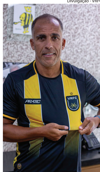
TREINADOR começa a trabalhar na próxima semana