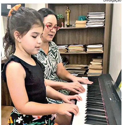
EVENTO acontece no teatro do Sest Senat na sexta-feira