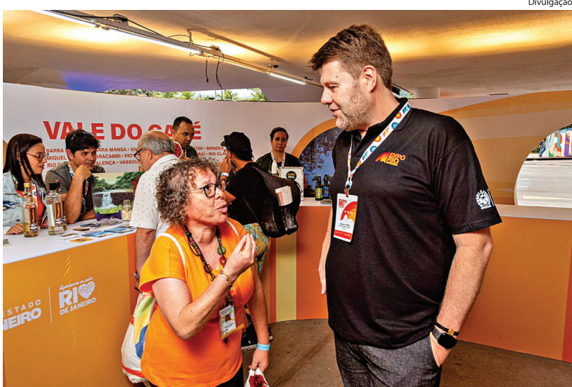
SECRETÁRIO esteve presente e conferiu de perto o sucesso a exposição

De quinta-feira, dia 19, a domingo, dia 22, foi realizada na cidade do Rio de Janeiro, na Lagoa, a 2ª ExpoRio Turismo. Noventa e dois municípios do Estado, divididos em 12 regiões turísticas, puderam divulgar suas belezas naturais e toda cadeia produtiva, visando atrair