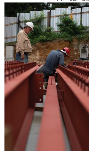
OBRA É UMA parceria com o Governo do Estado