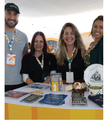
PROJETO Arigó de artesanato representa Volta Redonda na Expo Rio Turismo