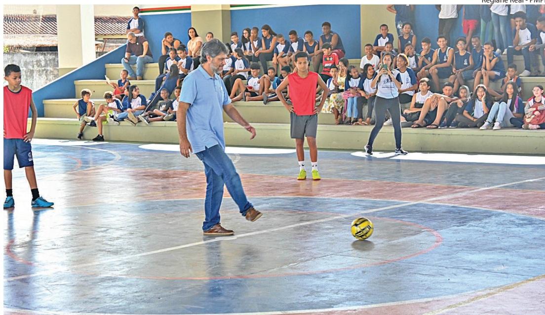
OBRAS foram entregues nesta segunda-feira, dia 23