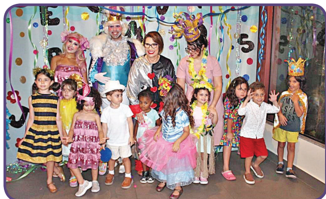
A CRIANÇA ANIMADA PÓS DESFILE