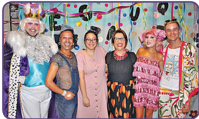
RECEBENDO CONVIDADOS ILUSTRES