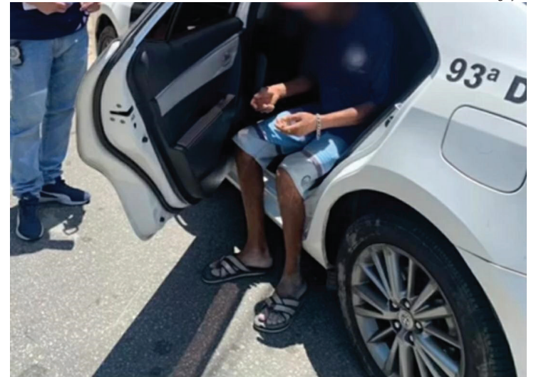
ELE foi encontrado ontem no bairro Retiro e levado para a delegacia