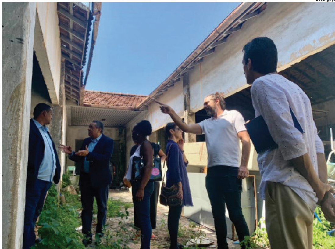
PRAZO para elaboração do projeto é de 120 dias

O atual prefeito, Diogo Balieiro Diniz, inclusive, já publicou uma portaria (nº984 de 25 de maio de 2023), designando o secretário como responsável do grupo. A primeira reunião aconteceu na última semana, no gabinete do prefeito, e teve como objetivo discutir as avaliações técnicas e definir um local para o centro, onde funcionará como um museu para atrair turistas, mas, também, contar a história das pessoas negras escravizadas, e que foram as verdadeiras contribuintes para o crescimento econômico na cidade e região, ainda que, tragi-