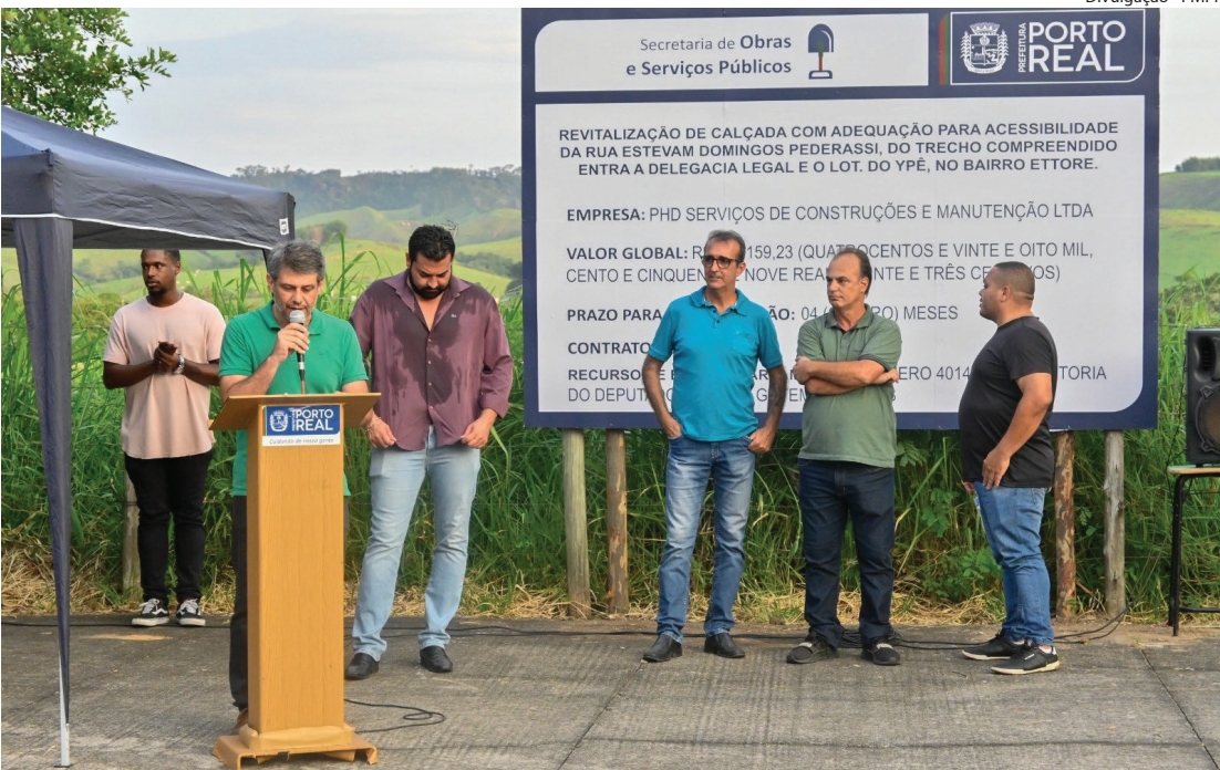
ASSINATURA da ordem de serviços aconteceu na segunda-feira, dia 13