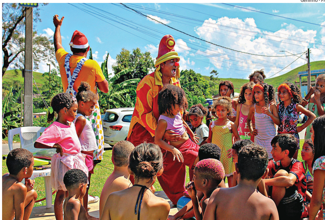
CRIANÇAS se divertiram em diversos brinquedos durante a ação