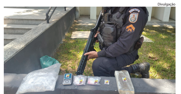
MATERIAL APREENDIDO foi levado para a sede da 89ª DP