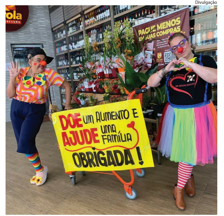
UMA das ações sociais realizadas