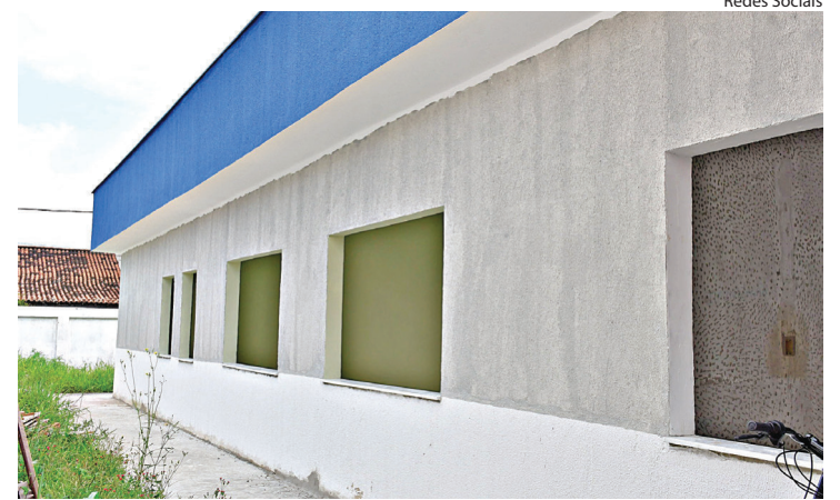
OBRA é executada em parceria da prefeitura e Ministério da Saúde