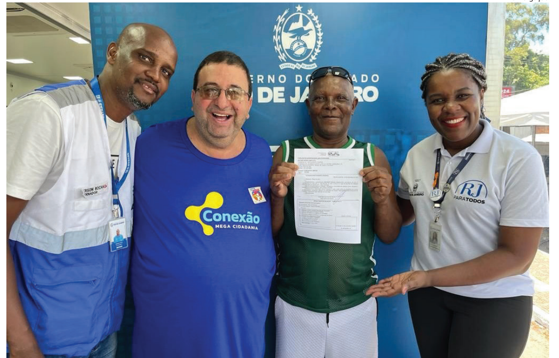
PROJETO foi trazido para região através de articulação do deputado