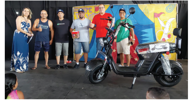
EVENTO teve sorteio de brindes