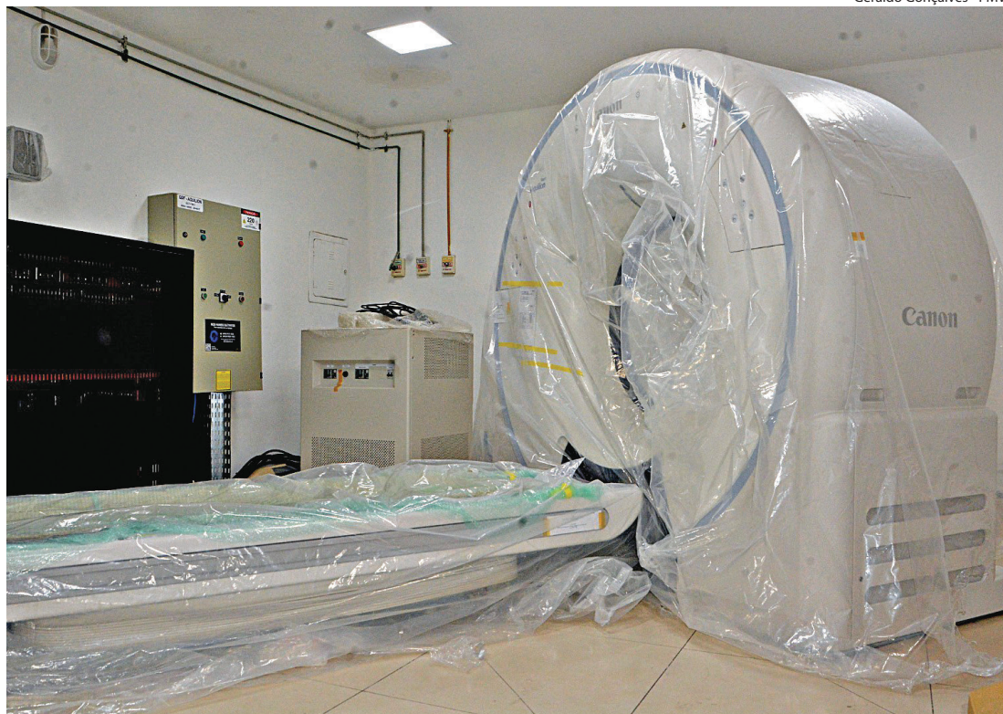
O NOVO tomógrafo está passando pelas últimas adequações