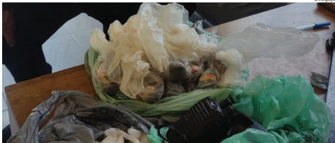
OS CASOS foram registrados nas delegacias das respectivas cidades

Um homem, de idade não informada, foi detido em Volta Redonda; já em Barra Mansa, o material estava em uma área de mata do distrito