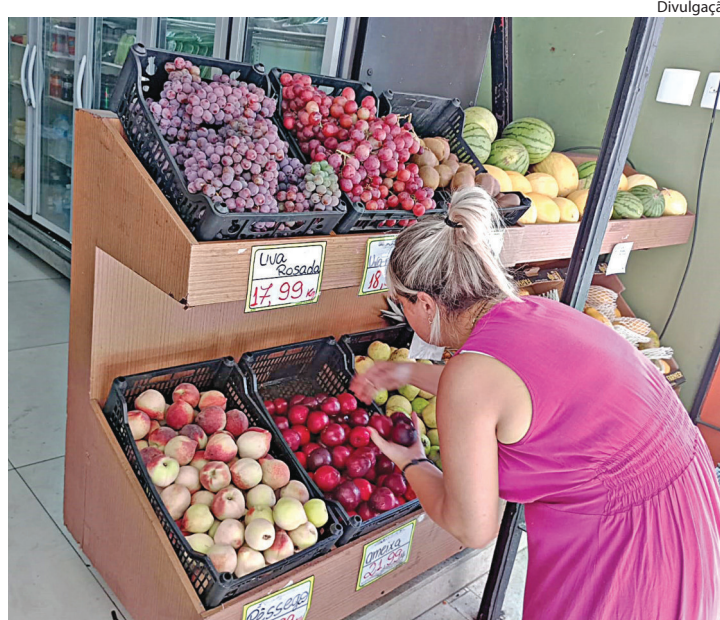
MUITAS PESSOAS estão adiantando as compras das frutas da Ceia

Uma fruta que faz parte das sobremesas natalinas e que, de acordo com a gerente, também é campeã de vendas, é o morango, que conforme conta já teve o pedido dobrado para atender a demanda esperada. “O morango chega em um dia e acaba no outro. Em dias normais a gente pede dez caixas e para essa semana do Natal pedimos 20, com entregas que acontecem três vezes na semana”, destacou.