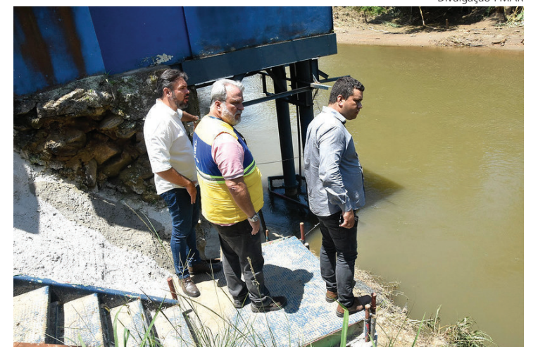
EQUIPES já estão vistoriando vários locais