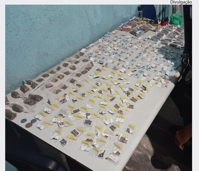
MATERIAL foi encaminhado para a 93ª Delegacia de Polícia