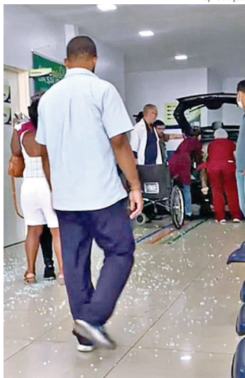
VEÍCULO QUEBROU a porta de vidro e invadiu a recepção da unidade

Na tarde desta quarta-feira, dia 20, um veículo invadiu a recepção do Hospital Municipal de Emergência Henrique Sérgio Gregori, em Resende. O carro, dirigido por uma mulher, quebrou a porta de vidro e avançou alguns metros da recepção, parando um pouco depois das cadeiras que ficam nas laterais. Por sorte, nenhuma pessoa ficou ferida com os estilhaços do vidro que se espalharam pela recepção e sequer foi atropelada pelo veículo. No porta-malas, a motorista transportava sua irmã, que estava acompanhada de outra pessoa. Após o incidente, a mulher foi levada por agentes da Polícia Militar para a 89ª Delegacia de Polícia (DP) para prestar esclarecimentos.