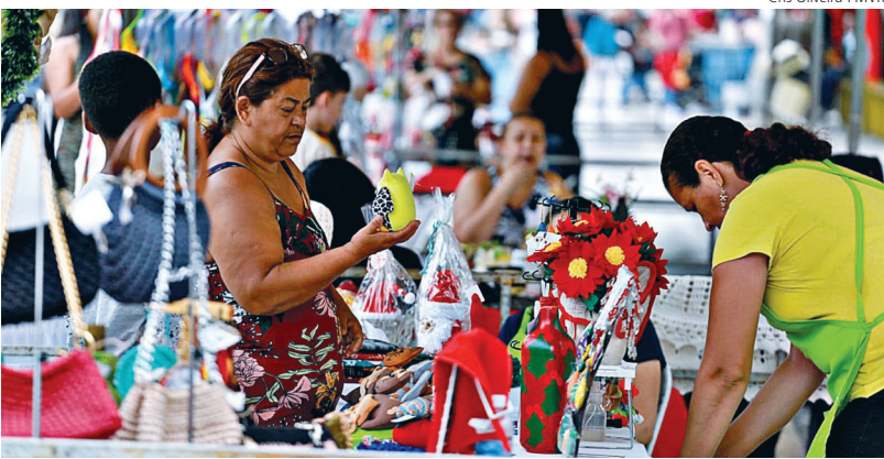
PRODUTOS artesanais são presentes únicos e fomenta o setor

Faltando quatro dias para o Natal, as feiras de artesanato de Volta Redonda e Barra Mansa são opções para quem pretende encontrar artigos personalizados para presentear. Nas duas cidades, como forma de incentivar e valorizar empreendedoras desse setor, as prefeituras organizaram edições especiais para o período natalino.