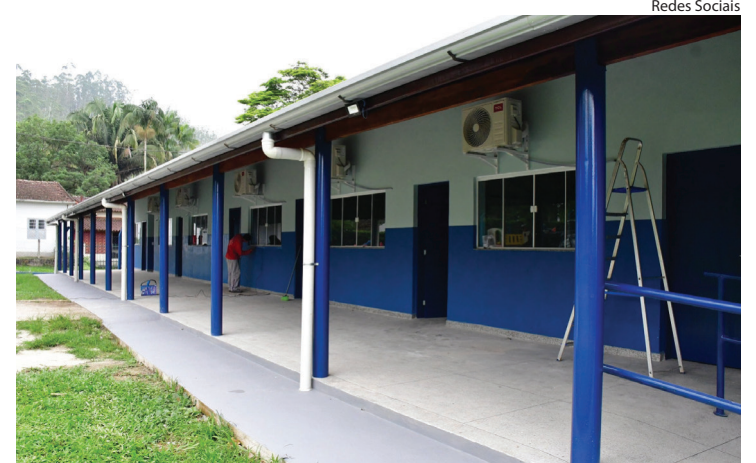
OBRAS DE MELHORIAS fazem parte das reivindicações dos moradores