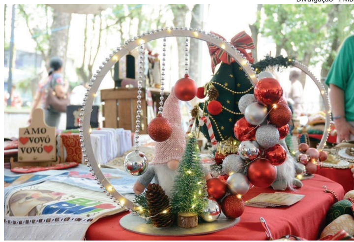
EM BARRA MANSA, Feira da Preguiça, fica na Praça da Matriz, até domingo, dia 24

Santos, para que as artesãs tenham mais visibilidade, o prefeito Rodrigo Drable determinou que as artesãs da Feira da Preguiça, a partir desta quinta-feira, 21, passem a expor seus produtos na Praça da Matriz, durante todo o mês de dezembro a feira se concentrou na Gare da Estação, onde as artesãs estavam em sistema de revezamento. “Nós temos cerca de 80 artesãs e umas 12, por dia, estavam se revezando na Gare. Na Matriz, além de mais visibilidade, vamos oferecer a oportunidade para umas 20 poderem comercializar seus produtos nesta época que é tão importante para elas. A Feira da Preguiça não tem nada industrializado e tudo é produzido pelas nossas artesãs. São artigos lindos e que são ótimas opções de presentes. Fica o nosso apelo para que a população valorize essas empreendedoras, uma vez que comprando delas todos ajudam a