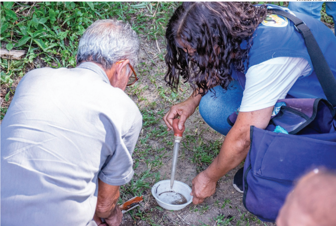
CAPACITAÇÃO aconteceu nesta semana na cidade do Aço