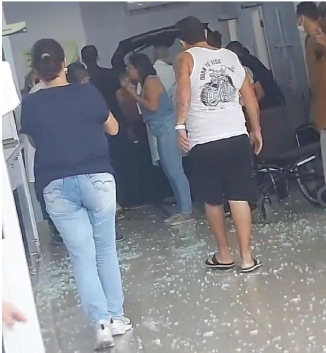
APESAR DO SUSTO, não houve registro de feridos

Na tarde desta quarta-feira, dia 20, um veículo invadiu a recepção do Hospital Municipal de Emergência Henrique Sérgio Gregori de Resende, localizado no bairro Jardim Jalisco. O carro, dirigido por uma mulher, quebrou a porta de vidro e entrou alguns metros da recepção, parando um pouco depois das cadeiras que ficam nas laterais. Por sorte, nenhuma pessoa ficou ferida com os estilhaços do vidro que se espalharam pela recepção e sequer foi atropelada pelo veículo. No porta-malas aberto estava sua irmã e outra pessoa sob um colchão. De acordo com as primeiras informações da Polícia Militar, a motorista socorria a irmã, que tem problemas de saúde e passou mal. Testemunhas comentaram que a mulher não teria a intenção de invadir a unidade hospitalar. Ela teria perdido o controle da direção do veículo. Ao sair do automóvel, a mulher parecia estar em choque. Ela gritava palavras desconexas. A equipe do Pronto Socorro do Hospital de Emergência socorreu a irmã da motorista. A mulher foi encaminhada para prestar esclarecimentos na 89ª Delegacia de Polícia (DP). Até o fechamento desta edição não havia informações sobre indiciamento.