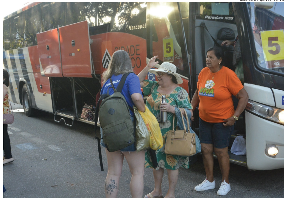
VIAGENS contemplaram mais de 8 mil pessoas