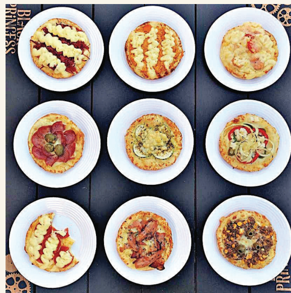
ALGUMAS OPÇÕES DELICIOSAS DE ESFIHAS

Minha dica de hoje para os leitores é o Arabads Esfiharia, que é mais que uma refeição, o local oferece uma experiência gastronômica única. As esfihas tem massa leve e são muito saborosas, com