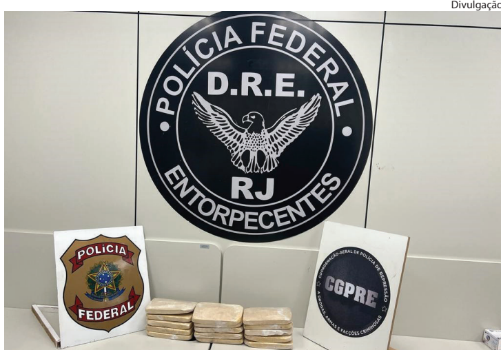
DROGA foi localizada com auxílio de cão farejador