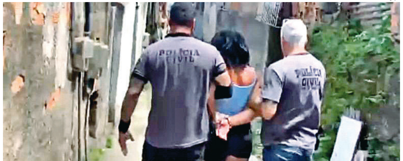
SUSPEITA de envolvimento com o Comando Vermelho foi levada para a 93ª DP

Nesta quarta-feira, dia 20, duas importantes ações foram realizadas por agentes da Polícia Civil, coordenados pelo delegado titular da 93ª Delegacia de Polícia (DP) de Volta Redonda, Vinicius Coutinho. Na Operação Fundo do Poço, foram realizadas incursões para o cumprimento de cinco mandados de prisão e nove de busca e apreensão em buscas de criminosos que aterrorizaram uma família do bairro Três Poços em agosto deste ano. Um homem e