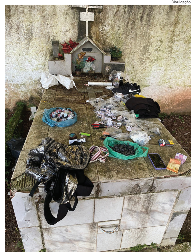
DROGAS estavam em cima de um túmulo