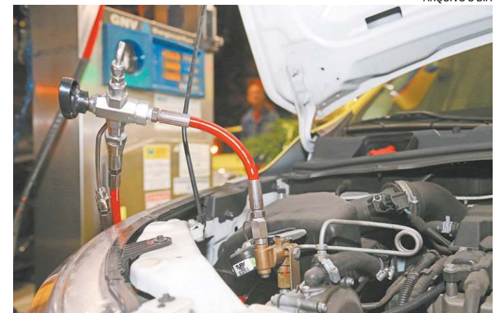
Postos terão dez dias para justificar o aumento ao Procon-RJ

Ao optar pelo saque-aniversário, aqueles que decidirem voltar a modalidade "saque-rescisão" só poderão fazer a mudança após 24 meses. O saque-aniversário não possibilita a retirada do valor integral do fundo em caso de demissão. Já a multa rescisória de 40% sobre o valor do saldo paga pelo contratante não sofre alteração.