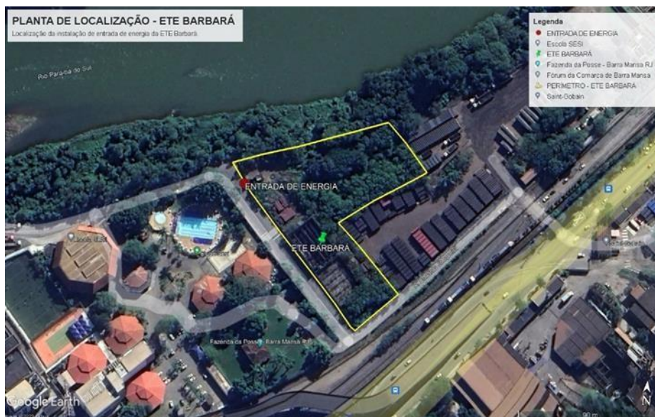
Figura 01: Localização ETE Barbará