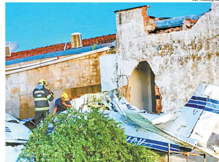
Acidente aconteceu na cidade de Goiânia, Goiás, na quarta-feira