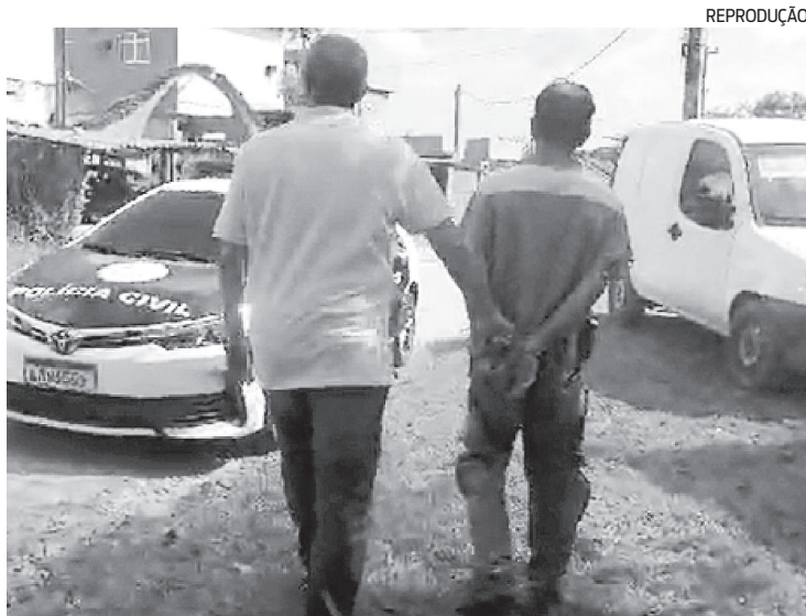
Homem foi encontrado por policiais no Bairro Vila São Joaquim