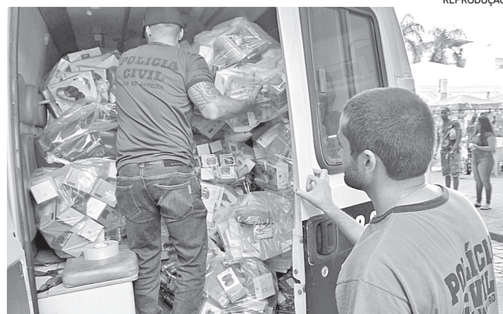
Agentes investigam oito casos de desaparecimento na região

Nessas lojas, os policiais da Delegacia de Repressão aos Crimes Contra a Propriedade Imaterial (DRCPIM) apreenderam acessórios falsificados para celular e aparelhos eletrônicos sem o selo Anatel. Os donos dos estabelecimentos foram encaminhados à delegacia especializada e prestaram