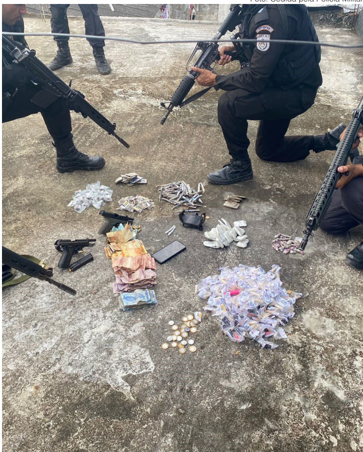
Pedras de crack, dolas de maconha, skank e pinos de cocaína foram apreendidos junto com armas e dinheiro