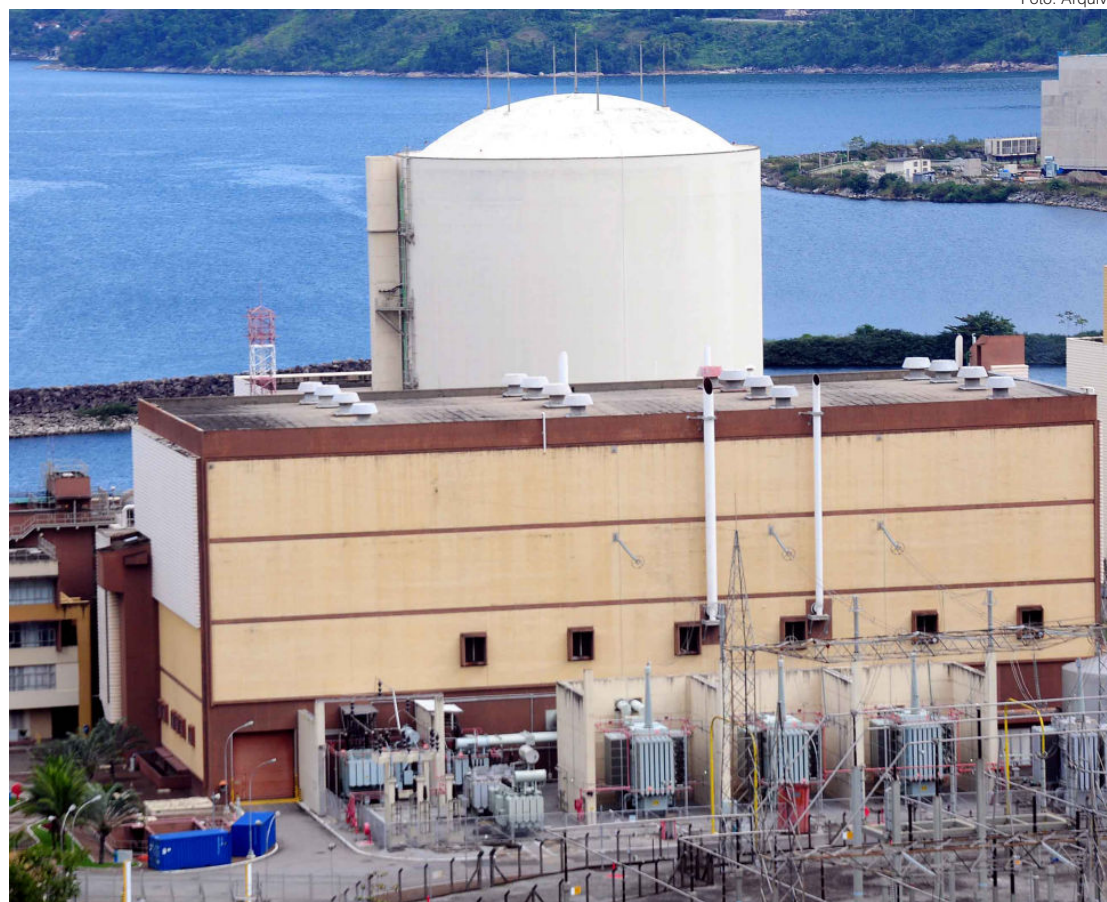
Angra I está no centro das discussões por causa de 90 litros de água radioativa

A Prefeitura de Angra dos Reis e o Ministério Público Federal (MPF) decidiram processar a Eletronuclear por causa do vazamento de cerca de 90 litros de água contaminada para o mar, em 16 de setembro de 2022. A quei-