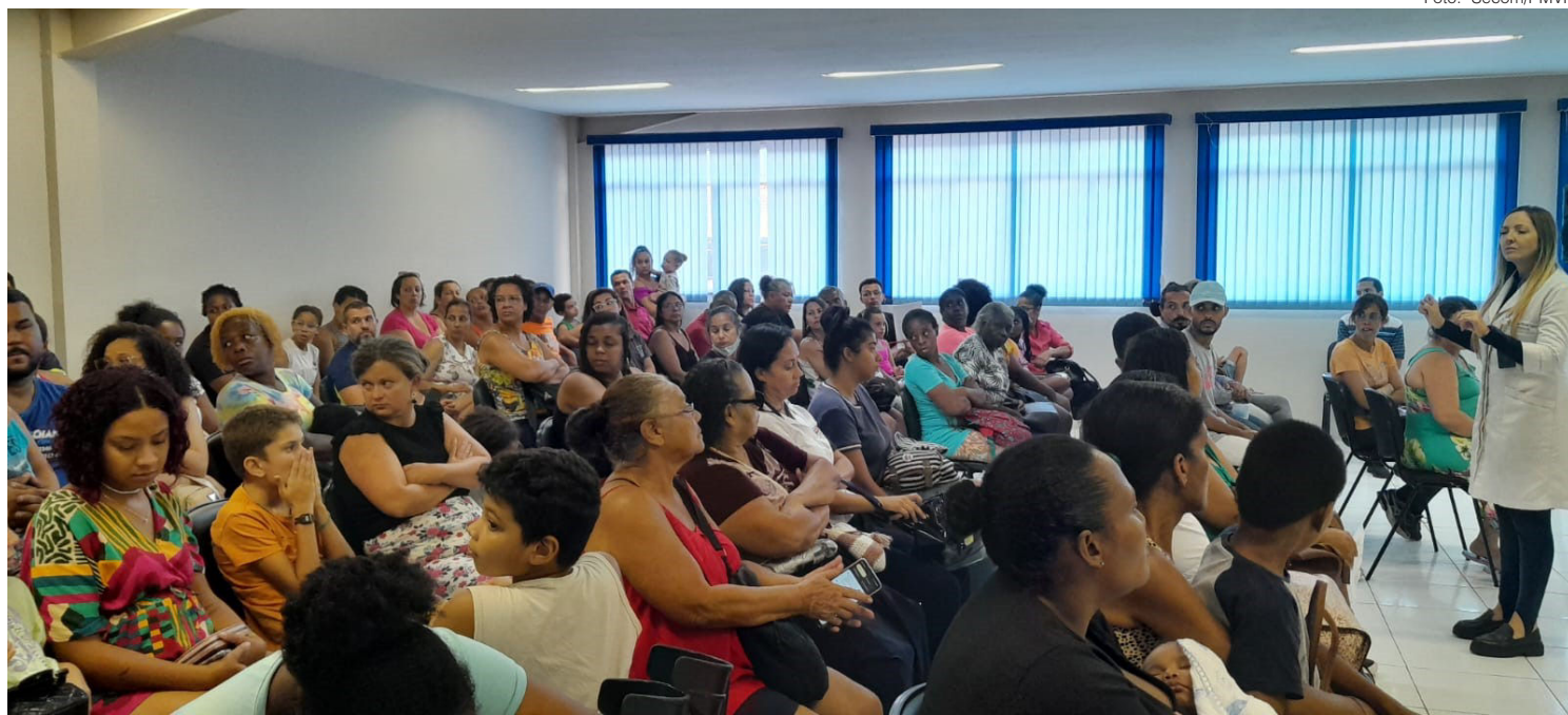
Familiares e cuidadores aprendem novas técnicas para lidar com transtornos