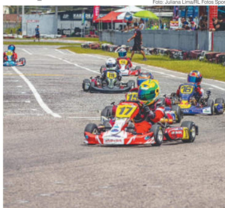
Jovens representaram a região Sul Fluminense e conseguiram boas colocações na primeira etapa do campeonato

Ainda haverá mais seis etapas ao longo do ano, sen-