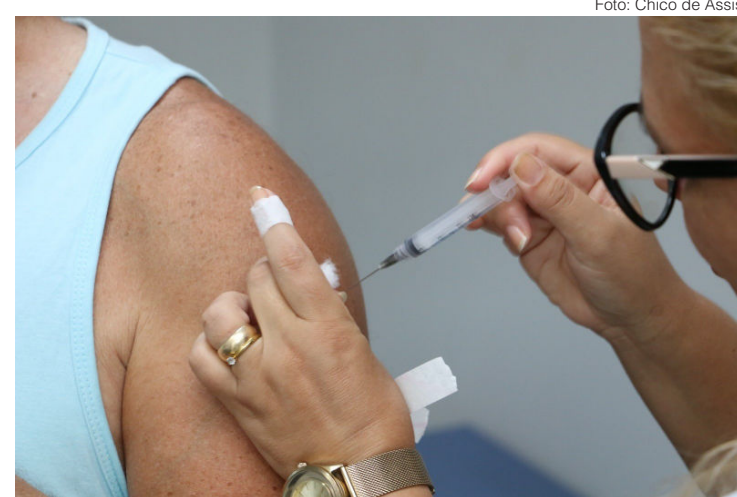
A dose só será aplicada após um período de quatro meses da dose de reforço

- PSF GOIABAL (segunda-feira) - PSF ISMAEL DE SOU-