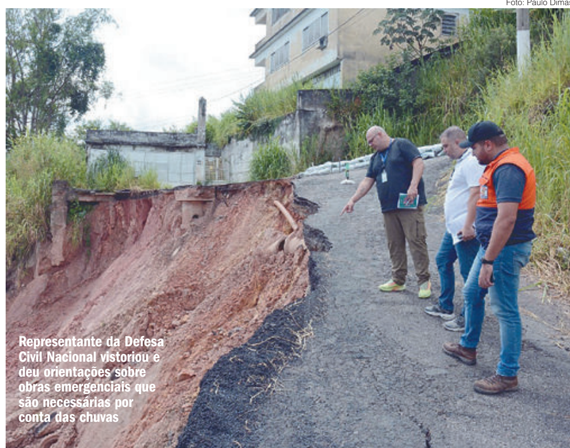
Representante da Defesa Civil Nacional vistoriou e deu orientações sobre obras emergenciais que são necessárias por conta das chuvas