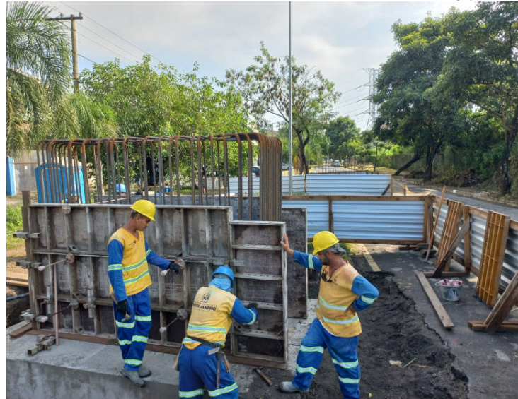
Legenda: Pilares de sustentação estão sendo colocadas por equipes da prefeitura

O objetivo da alça é criar uma nova rota, que possibilite desafogar o trânsito na região central do Aterrado e facilitar a vida dos motoristas. Atualmente, quem pega o Viaduto Heitor Leite Franco tem como único destino ime-