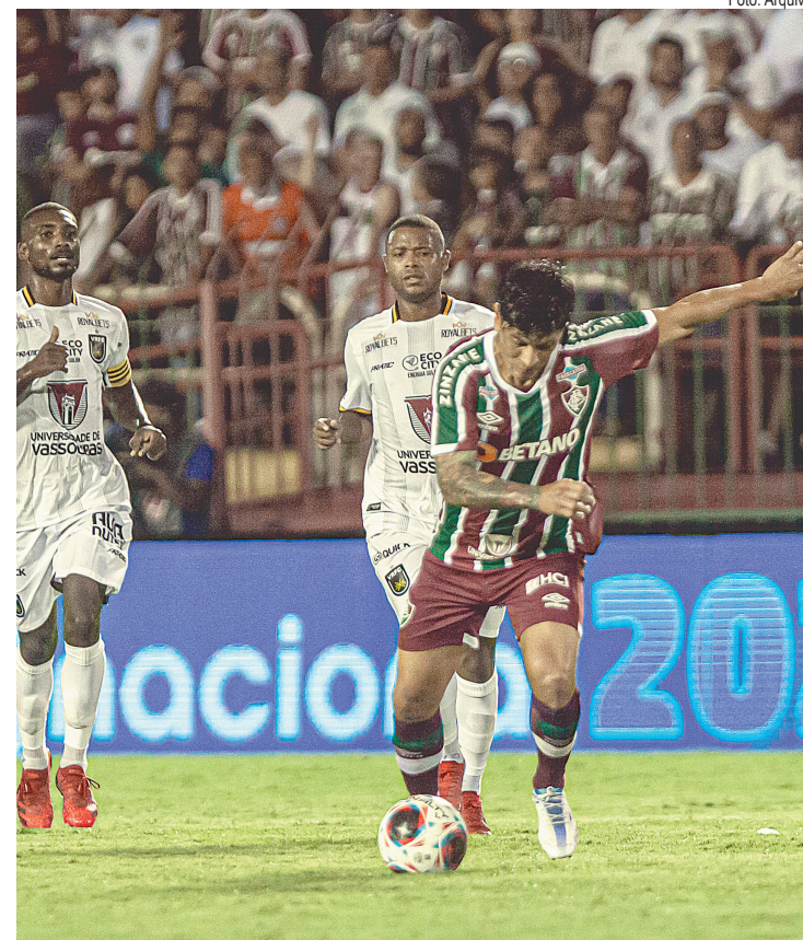
Esquadrão de Aço disputa no dia 18, o primeiro jogo no Raulino de Oliveira