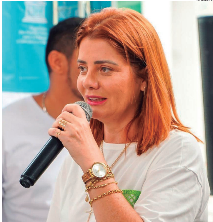
Carla é um dos nomes com mais chances de disputar a prefeitura no grupo de Vidal

“Em Paraty, onde as eleições costumam ser definidas por diferenças baixíssimas de votos, onde existem dois grupos políticos claramente definidos e onde não existe a possibilidade de segundo turno, qualquer desunião em um deles pode representar um caminho sem volta para a derrota”, afirmou um observador da cena política da cidade.