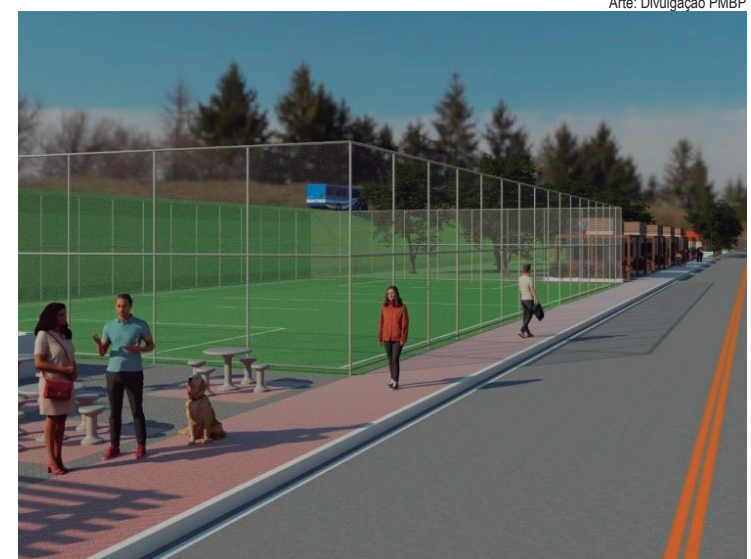
Projeto inclui ciclofaixa, iluminação, padronização dos quiosques e dos banheiros e reforma da quadra sintética