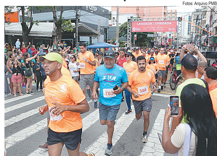
Inscrições terão limite de 1.000 atletas, com faixa etária a partir de 16 anos

33ª edição vai acontecer no dia 21 de janeiro e faz parte das comemorações do padroeiro do município