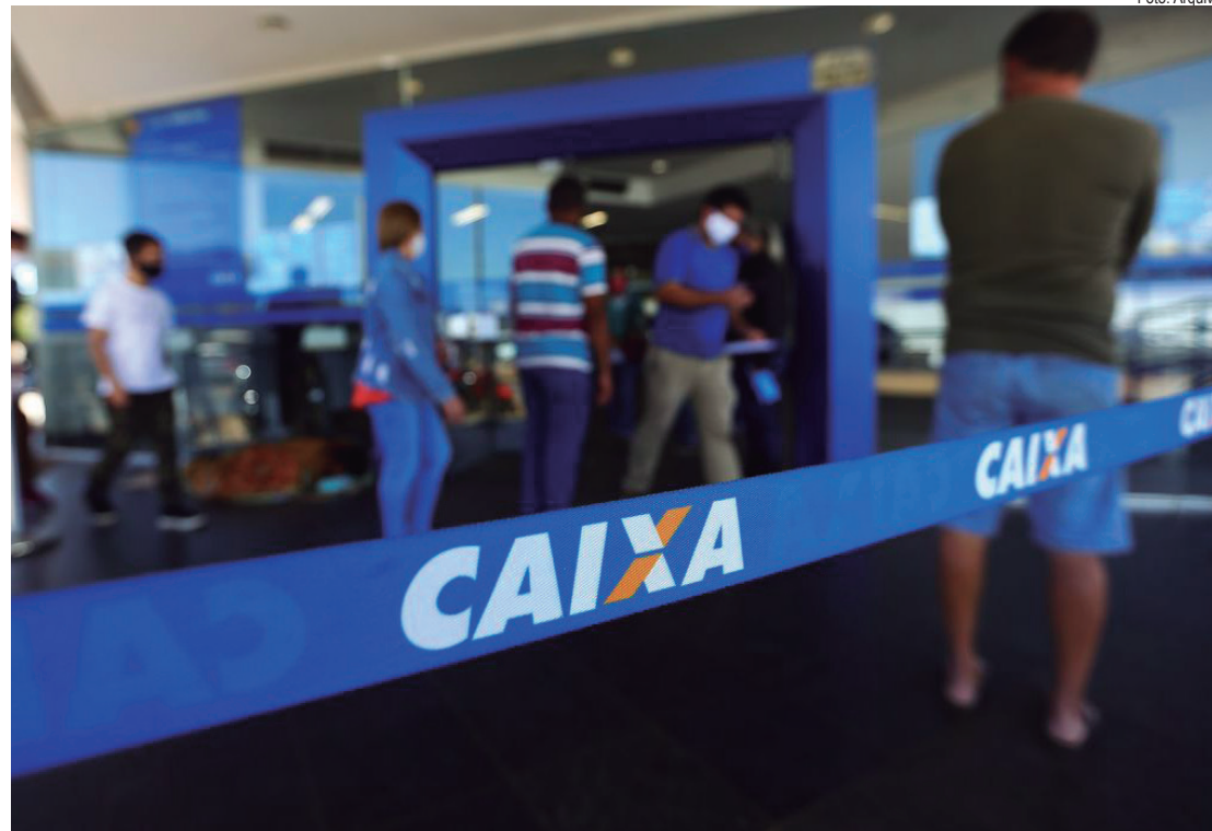
Caixa Econômica Federal é a instituição bancária mais associada à caderneta de poupança

Atualmente, a poupança rende 6,17% ao ano mais a Taxa Referencial (TR). Essa regra vale quando a Selic está acima de 8,5% ao ano, o que ocorre desde dezembro de 2021. Quando os juros básicos estão abaixo desse nível, a poupança rende apenas 70% da Selic.