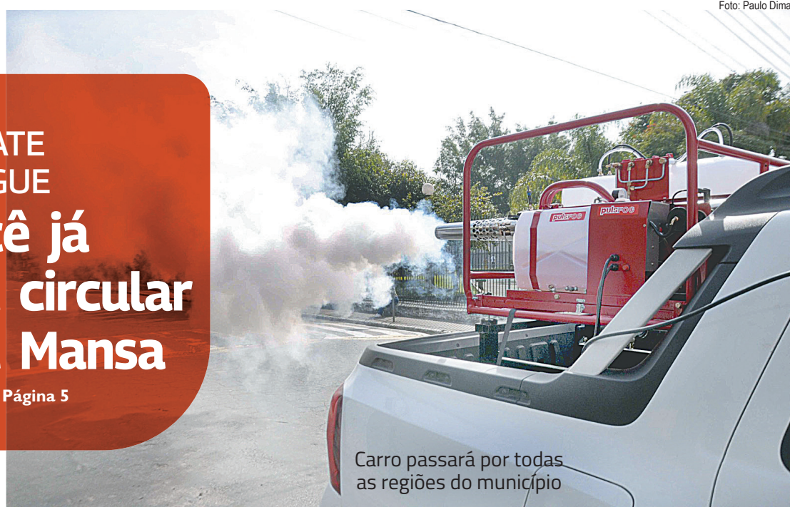
Carro passará por todas as regiões do município