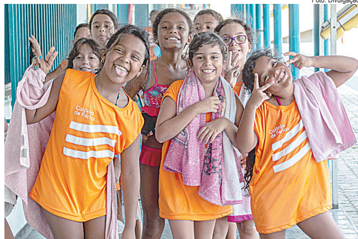
Atividades ocorrem até o dia 26 de janeiro nos Centros de Promoção da Saúde da Firjan SESI; inscrições seguem abertas até sexta-feira (12)

Nesta edição da Colônia, as atividades serão realizadas no período de 13h às 17h (vespertino) nas seguintes unidades: Rio de Janeiro (Jacarepaguá e Vicente de Carvalho), Barra Mansa, Campos, Caxias, Friburgo, Itaperuna,