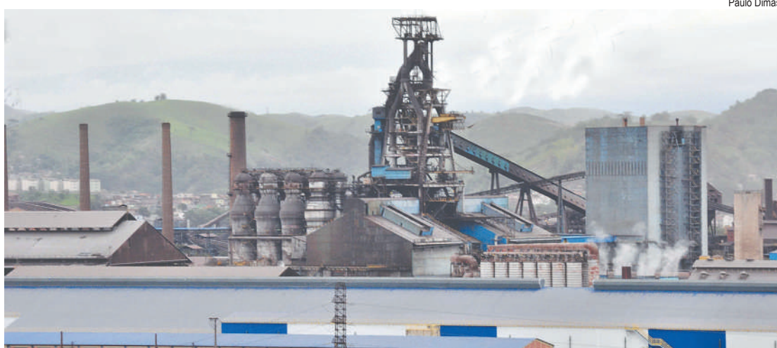
CSN e Nissan podem ajudar a atrair novos investimentos para o sul fluminense

Fim da 'guerra fiscal' devolve importância a logística e oferta de mão de obra qualificada nas decisões de implantação de indústrias