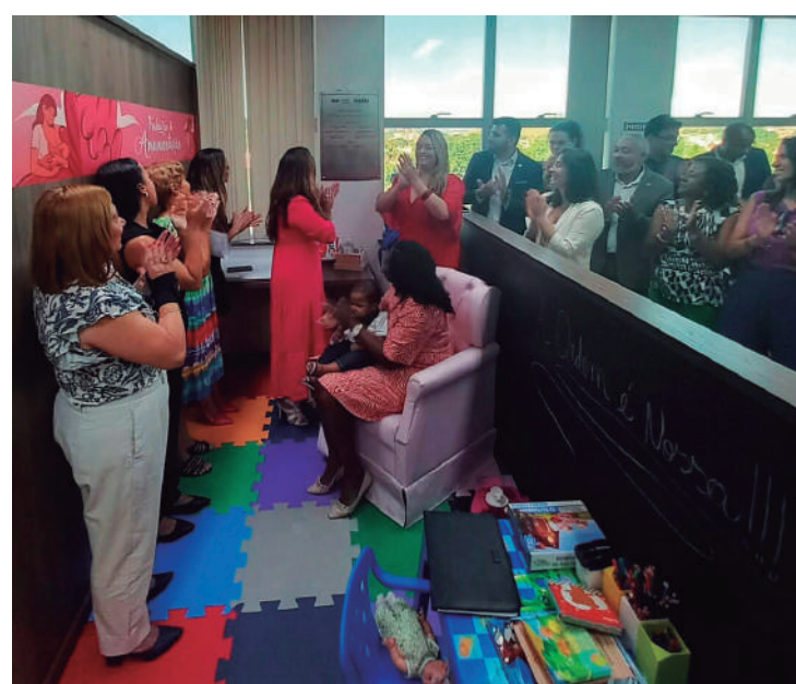
Legenda: Espaço destinado às mães e crianças, na sala da OAB-VR, conta com fraldário, cadeira de amamentação e brinquedoteca