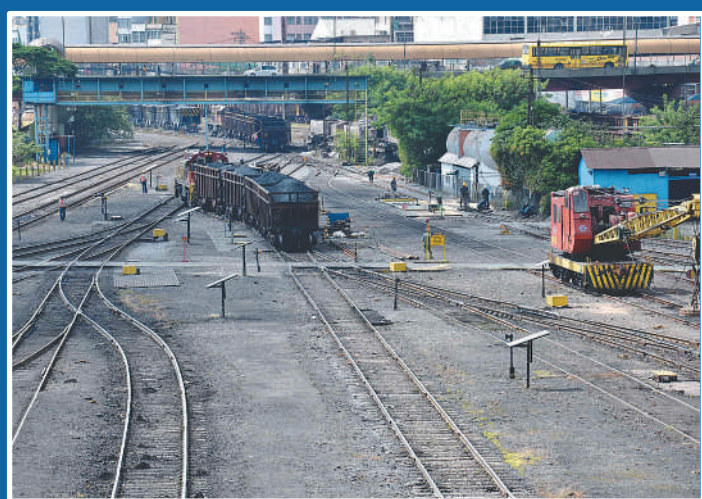
Ramal Ferroviário, Rodovia Presidente Dutra e Porto de Angra formam o melhor entroncamento logístico do Brasil