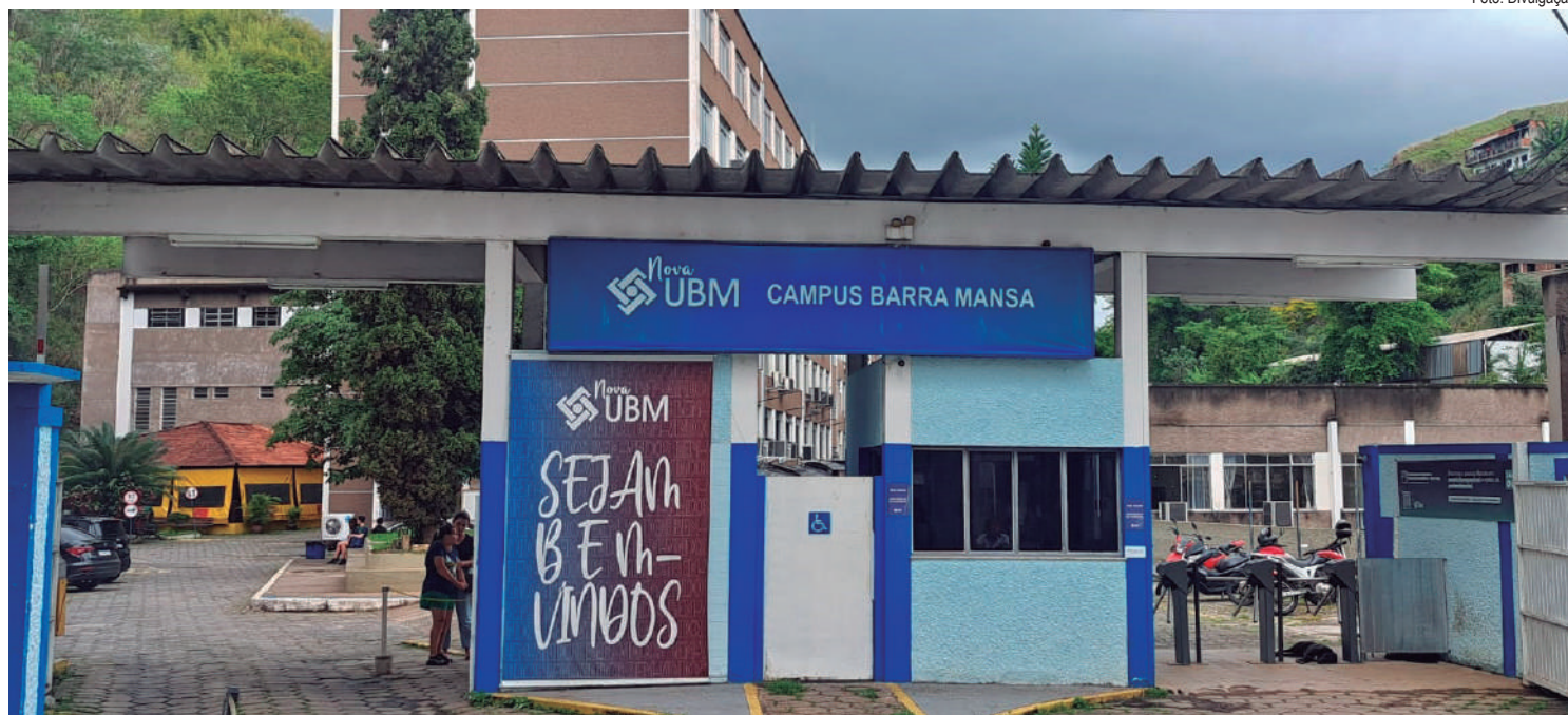
Legenda: No Sul Fluminense, quase 20 mil alunos se inscreveram para participar