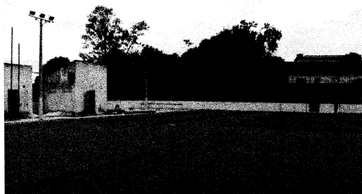
Campo de futebol está recebendo novo gramado, pintura das arquibancadas e troca de alambrado

Segundo a Secretaria Municipal de Infraestrutura (SMI), a próxima etapa vai consistir na reforma e pintura dos vestiários e nos acabamentos finais. A grande novidade é que o campo do 'Terreirão' também vai ganhar dois 'Fut Mesas' para a prática da famosa modalidade do futebol de mesa. O objetivo é garantir mais opções de lazer para os usuários.