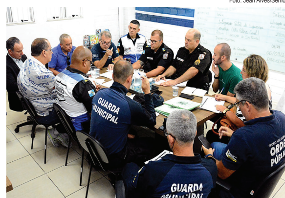
Planejamento das forças de segurança da cidade acontecem com dois meses de antecedência