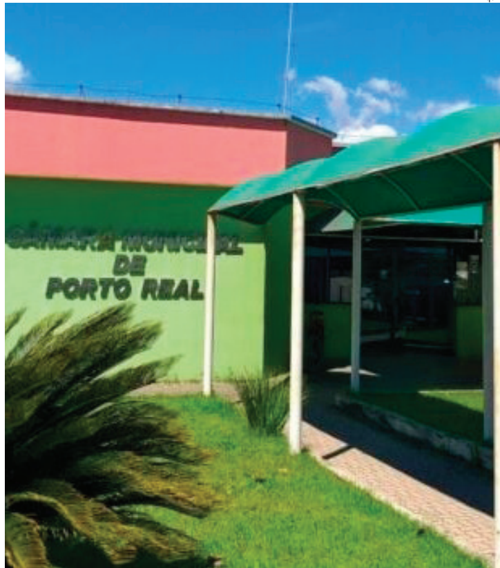
Vereador e assessor estão afastados de Câmara de Porto Real por três meses