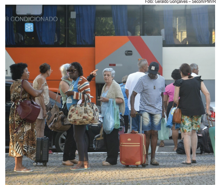
No total, foram 32 viagens ao longo de 2023 com saída de seis ônibus por dia

A última viagem deste ano do programa ‘Viva a Melhor Idade’ foi realizada na segunda-feira (18), encerrando a temporada de 2023, informa a prefeitura. Desta vez, os beneficiados foram os grupos de convivência da Smas (Secretaria Municipal de Assistência Social) que viajaram com destino a Caxambu (MG), onde ficaram hospedados no Hotel Glória. Os participantes retornaram nesta terça-feira à cidade (19), após curtirem o hotel com café da manhã, almoço com comidas típicas da região, café da tarde, além de jantar dançante. Os viajantes também tiveram acesso a toda estrutura do Hotel Glória, como sala de jogos, karaokê e recreação na piscina, e ainda visita ao Parque das Águas – ponto turístico de Caxambu. A programação do segundo dia ofereceu aos grupos, além do café da manhã, duas opções para o período matutino: visita ao Parque das Águas ou atividades recreativas na piscina do hotel. Para finalizar, almoço de despedida e retorno para Volta Redonda. No total, foram 32 viagens ao longo de 2023 com saída de seis ônibus por dia, levando 276 pessoas – entre idosos participantes ativos dos programas das secretarias municipais de Esporte e Lazer (Smel) e de Assistência Social (Smas), além de profissionais das secretarias e da empresa de turismo con-