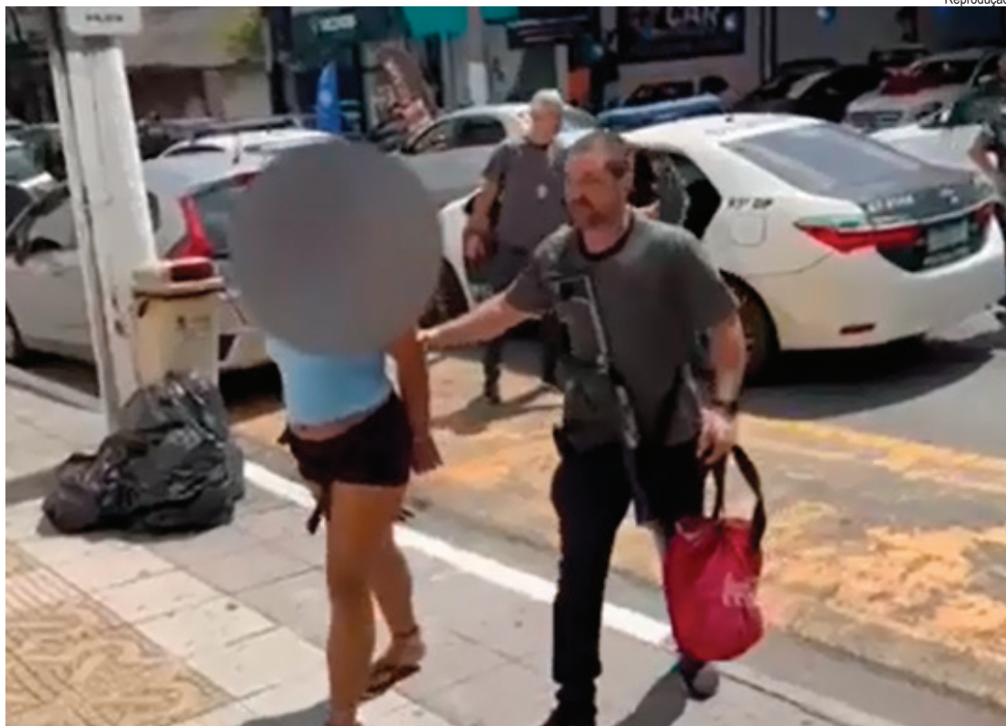
Investigações da 93ª DP levaram à prisão de líder do tráfico no São Carlos