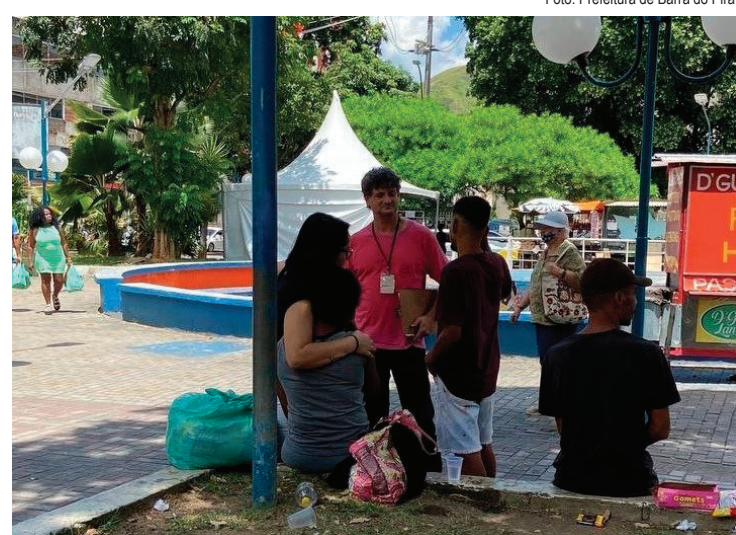
Após a pandemia de Covid 19, houve aumento significativo da população em situação de rua

“Obviamente, morar nas ruas não é uma condição fácil e a Assistência Social de Barra do Pirai tem trabalhado em busca de efetivar as garantias da dignidade da pessoa humana. Temos atendido às múltiplas carências de condições básicas apresentadas por esse coletivo. Quando falamos sobre essas pessoas, não estamos descrevendo um grupo homogêneo e sim de pessoas diferentes, que