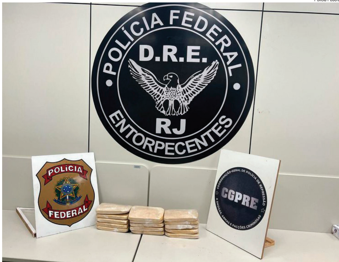
Drogas estavam divididas em uma mochila e uma mala

De acordo com a PF, o preso tinha como destino a cidade do Rio de Janeiro. Lá, ele ia distribuir a droga em uma comunidade dominada por facção criminosa, recebendo certa quantia em dinheiro pelo 'serviço'. Após a formalização da prisão,