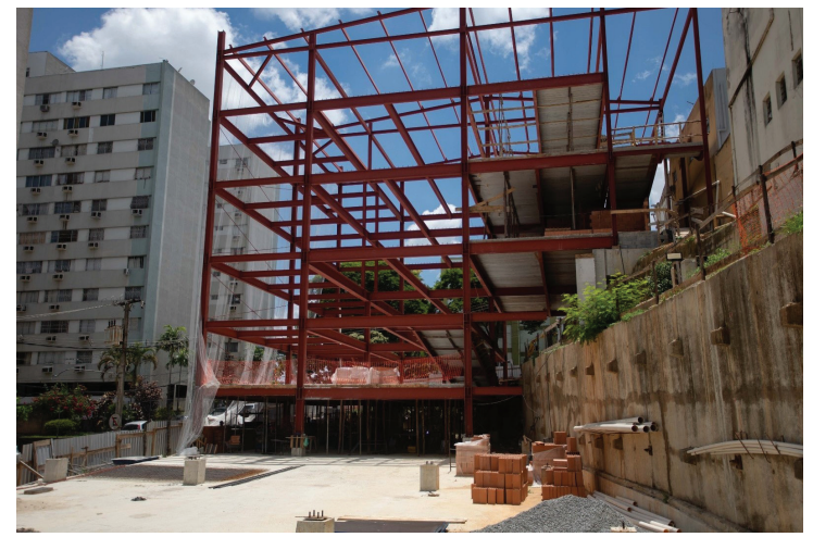
Próxima fase inclui instalação da tubulação de prevenção e combate a incêndios

Dessa forma, toda a unidade atenderá às resoluções pertinentes a um estabelecimento de saúde. “Retorno a Volta Redonda com essa ótima notícia de que as obras continuam avançando. O Hospital São João Batista é sinônimo