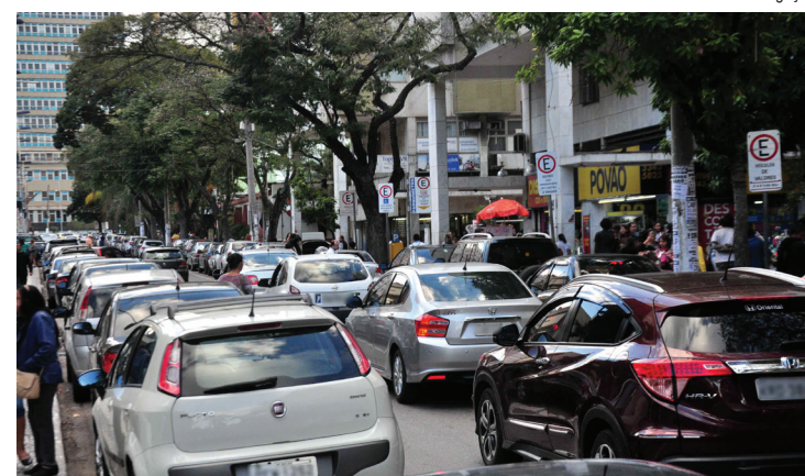
Legenda: Quitação de IPVA e multas vencidas é determinada pelo artigo 131, parágrafo 2º, do Código de Trânsito Brasileiro (CTB)

A cobrança do IPVA é de responsabilidade da Secretaria de Estado de Fazenda, que já divulgou o calendário de pagamento de 2024 ( https://portal.fazenda.rj.gov.br/noticias/governo-do-estado-divulga-calendario-de-pagamento-do-ipva-2024/ ). O Detran divulgará o calendário de licenciamento anual de 2024 no início do ano que vem