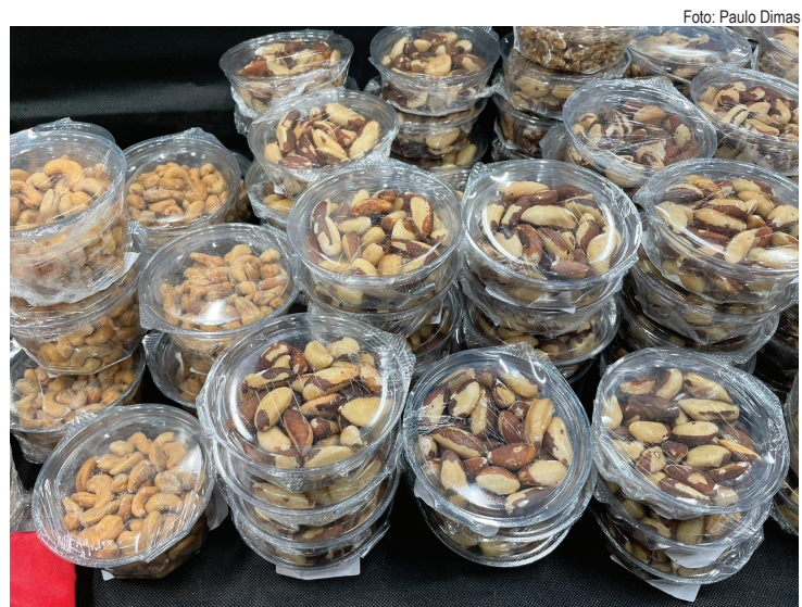
Órgão percorreu sete supermercados da cidade e avaliou preços de produtos tradicionais da ceia de Natal

Outro produto que tem um grande diferencial no valor de um lugar para o outro são as nozes sem casca. O menor preço pode ser encontrado por R$ 69,90 em