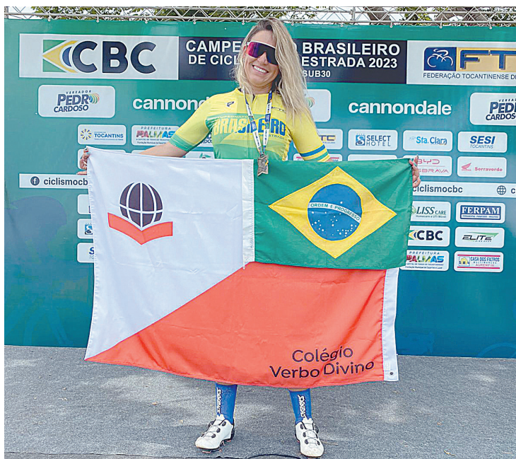
Legenda: 'Rainha da Montanha' disputou na Categoria B1, nas etapas de contrarrelógio e resistência

"Para nossos cerca de 80 estudantes atletas que irão para as disputas de diversas modalidades esportivas, posso dizer que com garra e determinação, é possível vencer. Que assim como eu, vivam esta experiência única e descubram que somos mais fortes do que imaginamos, em qualquer circunstância da nossa vida", concluiu a diretora do CVD.