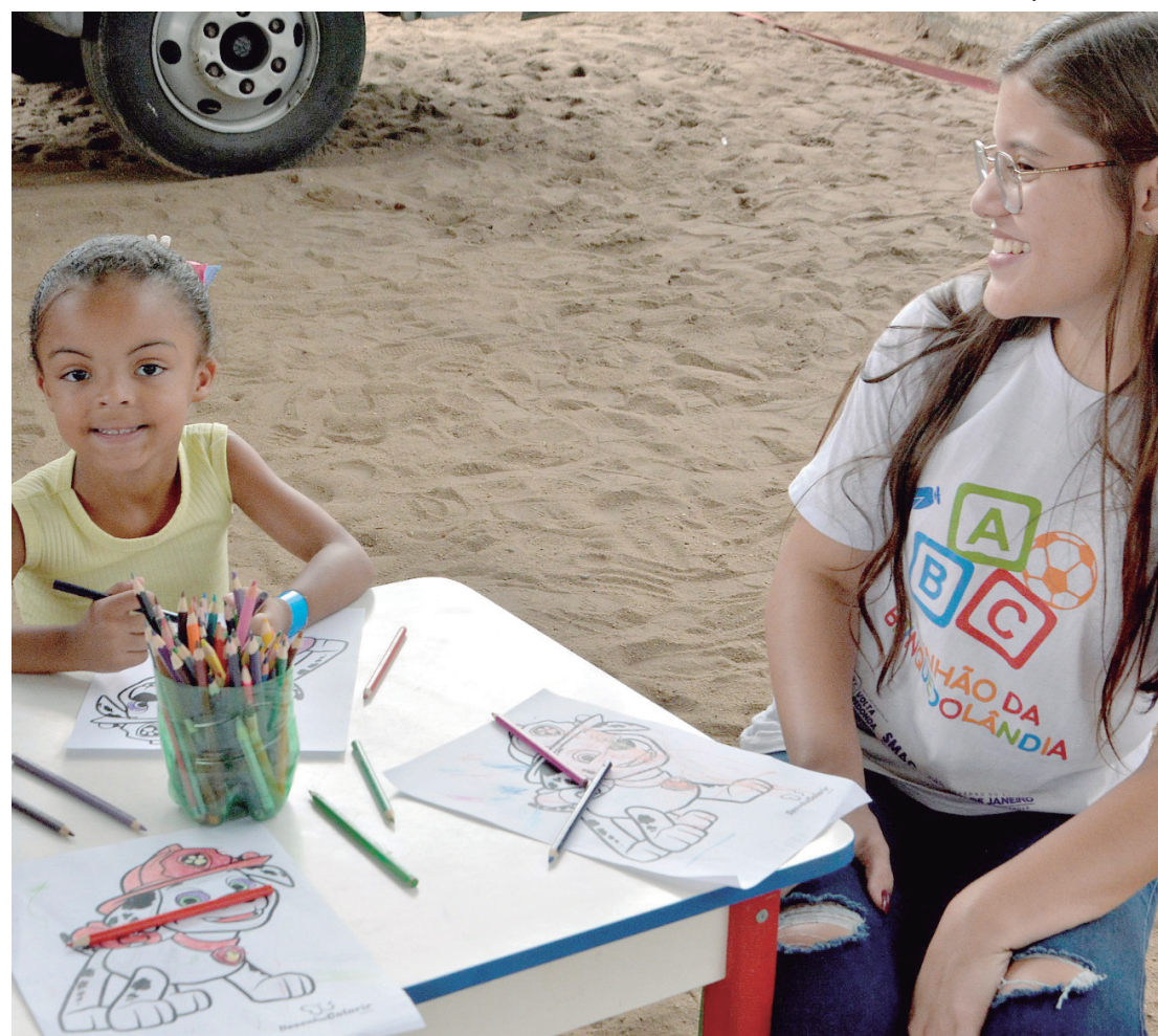
Projeto oferece atendimentos em fonoaudiologia, educação física e psicologia, dentre outros

“O objetivo do ‘Laço Azul’ é auxiliar no desenvolvimento da comunicação e na autonomia das crianças com diagnóstico de Transtorno do Espectro Autista. E é muito gratificante acompanhar o desenvolvimento e a melhoria na qualidade de vida dessas crianças”, afirmou a diretora do hospital, ressaltando que os pais também são orientados para ajudar no repertório cognitivo e social das crianças, para que evoluam cada vez mais.