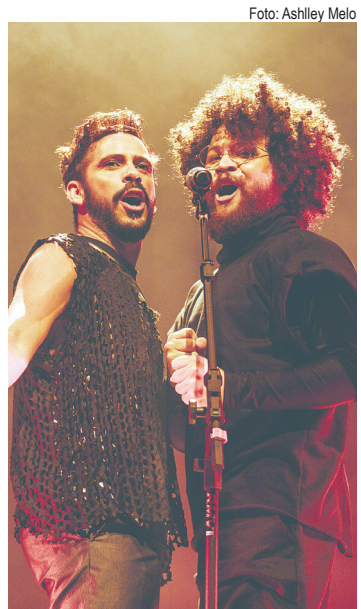
Duo se apresenta nesta sexta-feira (20), às 19h