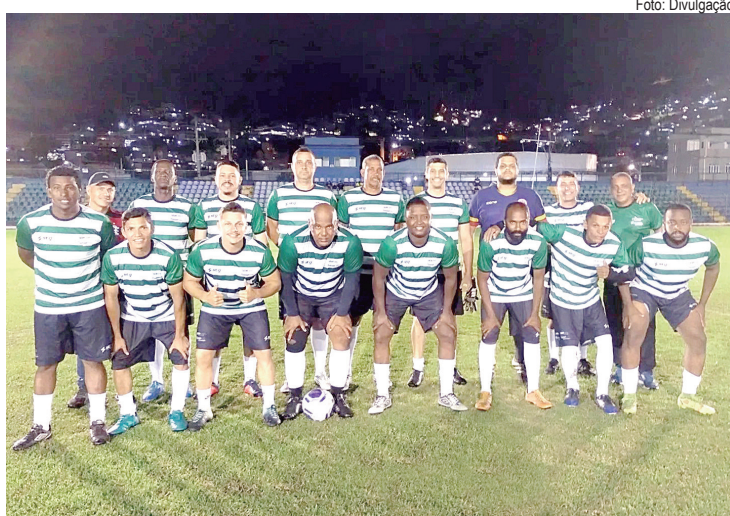
Equipe do Serviço Público é uma das favoritas

Na próxima terça-feira (24), à noite, o Estádio Municipal receberá os jogos das semifinais do Campeonato de Futebol dos Servidores. Os confrontos que vão apontar os finalistas da competição serão: Secretaria de Esporte x Procuradoria Geral e Serviço Público x Parques e Jardins. A final está programada para o dia 27, na sexta-feira