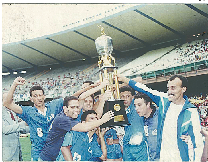
Seleção Angrense conquistou no dia 24 de outubro de 1993 o título de campeão estadual das Ligas Municipais