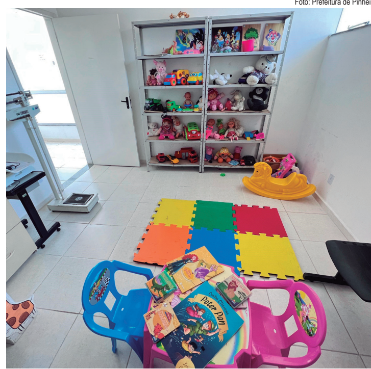
Brinquedos poderão diminuir estresse de crianças à espera de atendimento

“Sabemos que a primeira infância é uma fase de descobertas e aprendizado, na qual o aspecto lúdico estimula a imaginação das crianças. A presença de brinquedos é fundamental na sala de espera, pois motiva as crianças a frequentarem as unidades de saúde de forma mais atentas e a participarem nas consultas. Isso reduz o receio delas na relação com os profissionais de saúde e estabelece uma maior proximidade com a equipe”, afirmou.