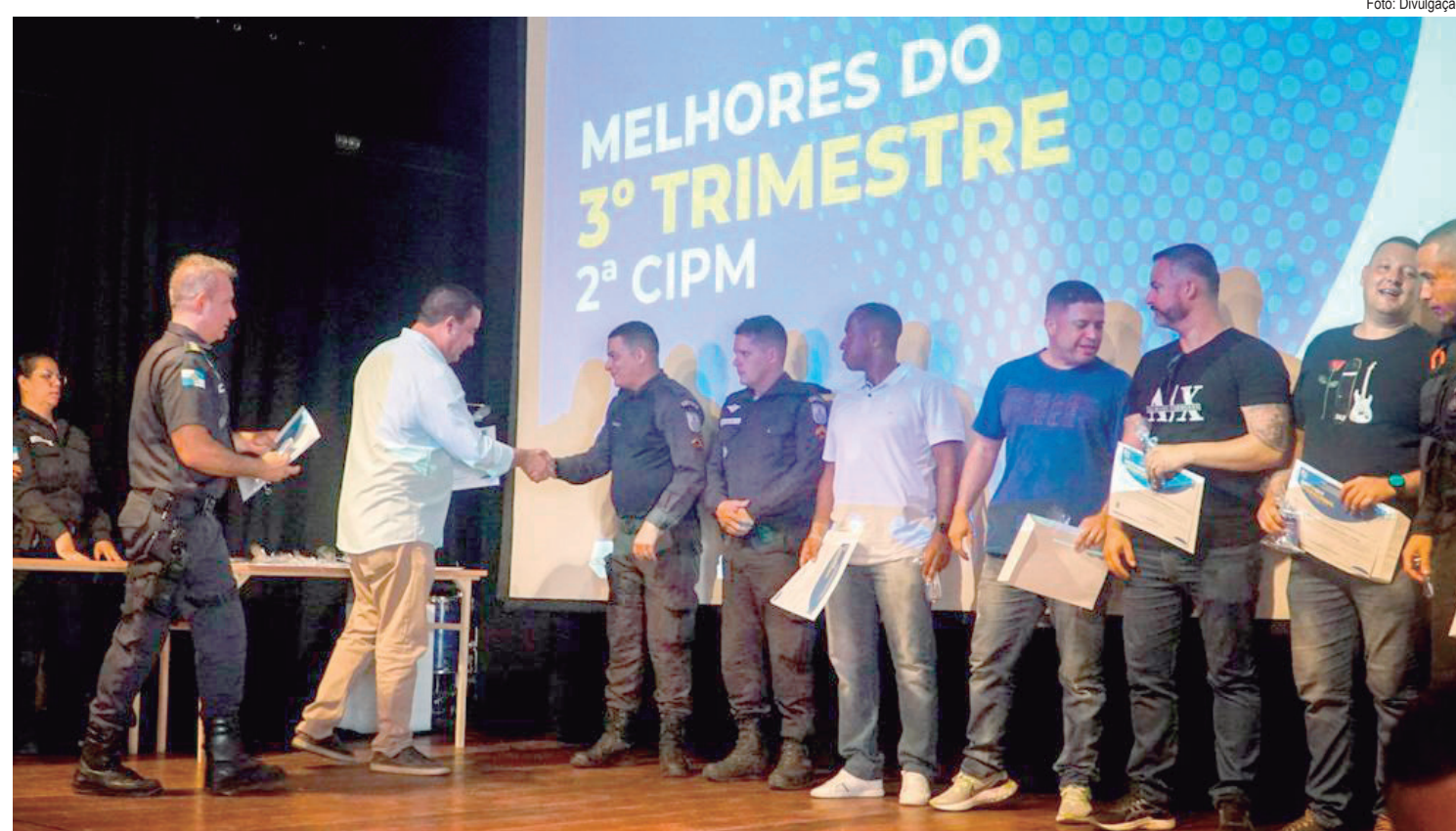
Evento foi realizado pela Secretaria de Estado de Polícia Militar