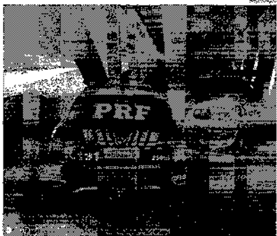
Carro foi encontrado queimado na divisa

Roubo teria acontecido no domingo (14) e chegou a ser registrado na delegacia