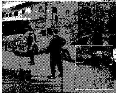
Suspeitos, que estavam armados com pistola e granadas, tocaram tiros com a PM

A operação também contou com apoio da Guarda Municipal de Angra dos Reis e de equipes da Secretaria de Saúde do município. O objetivo da ação é apreender drogas e armas, prender criminosos e desarticulações de organizações criminosas ligadas ao tráfico de drogas.