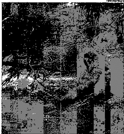
Bombeiros fizeram a remoção do corpo, que foi levado para a IML