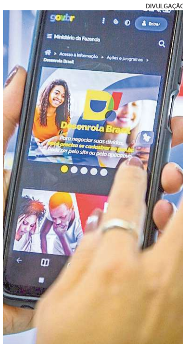
Negociações são feitas on-line

O programa encerrou 2023 com a participação de 11,2 milhões de pessoas, que renegociaram R$ 32,89 bilhões em dívidas.