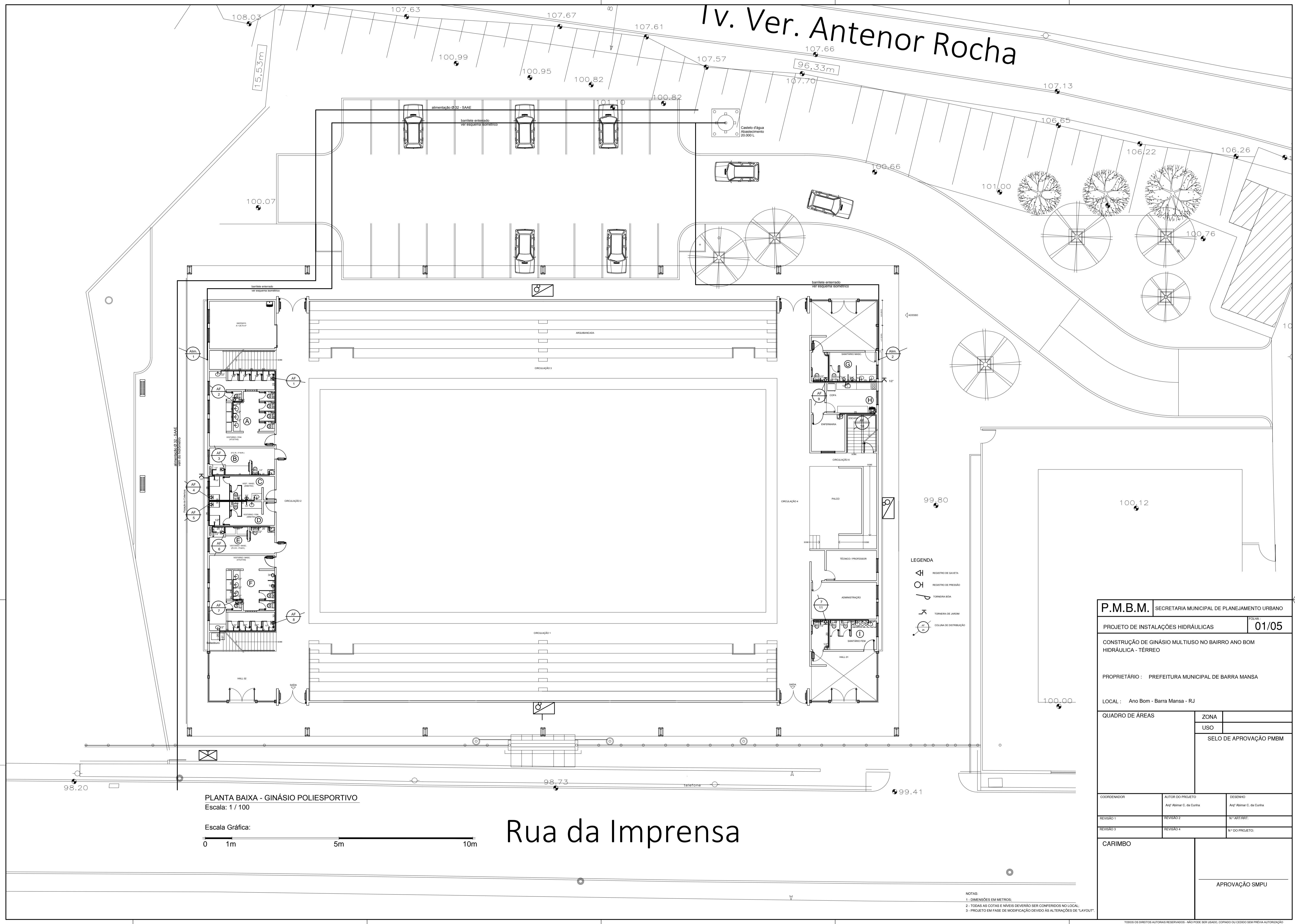
PLANTA BAIXA - GINÁSIO POLIESPORTIVO Escala: 1 / 100