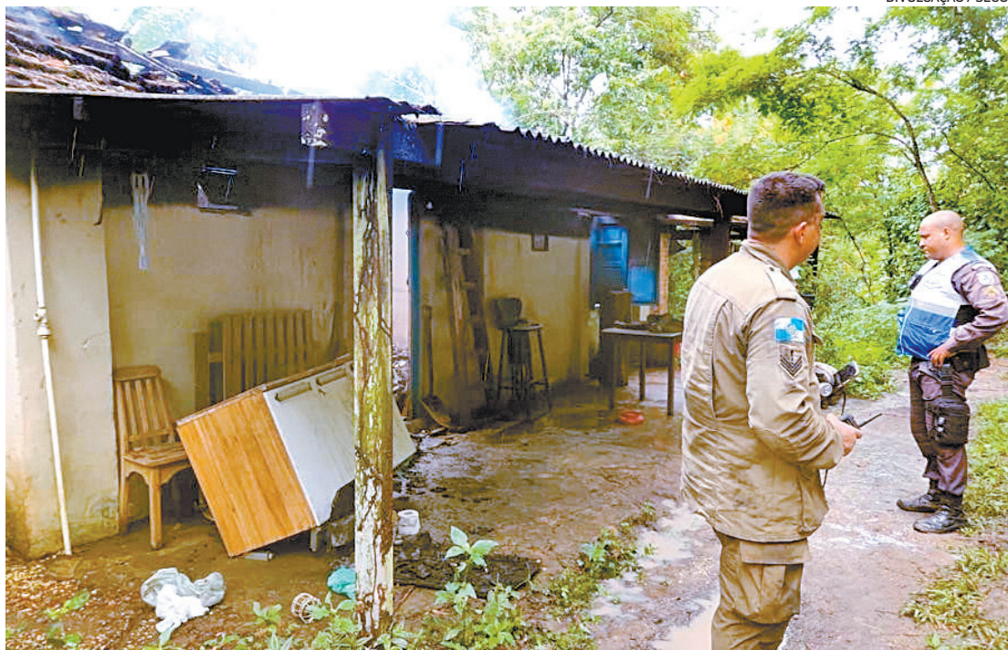
Agentes da Operação Segurança Presente prenderam uma mulher, suspeita de incendiar um templo religioso

Accionados por moradores, os policiais do Niterói Presente prenderam a mulher, que ainda andava pelas redondezas. A ocorrência foi registrada na 76ª DP (Niterói), que investiga o caso.