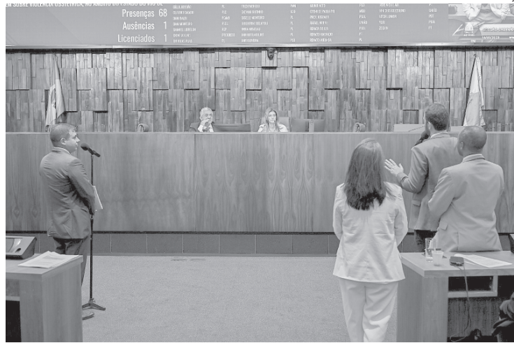
Projeto autoriza governo estadual a amparar adolescentes grávidas em situação de rua