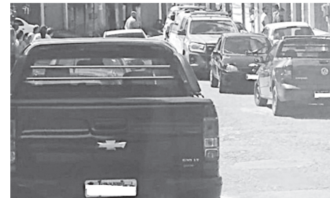
Polícia militar levou os dois baleados para o HSJB; mas apenas um sobreviveu