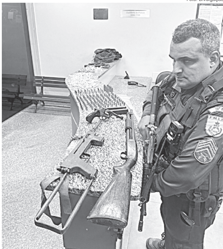
Armas e material apreendidos foram levados para a 90ª DP

Quando foram para o local indicado, os policiais encontraram além da submetralhadora, uma espingarda Winchester, calibre 16, um revólver Taurus, calibre 38, dois carregadores calibre 45, oito munições de calibre 16, 105 munições de calibre 45, 35 munições de calibre 38, cinco rádios transmissores, duas bases de rádio, uma câmera de monitoramento, três mochilas, dois rolos de fio, 464 pinos de cocaína, 135 tiras de maconha e 20 pedras de crack.