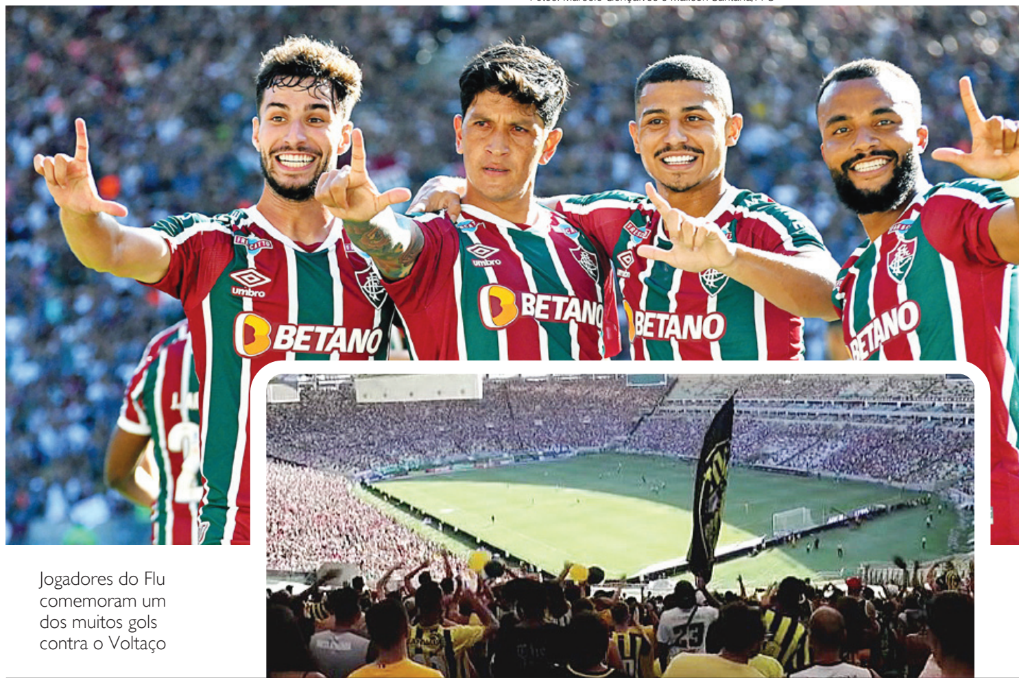
Jogadores do Flu comemoram um dos muitos gols contra o Voltaço