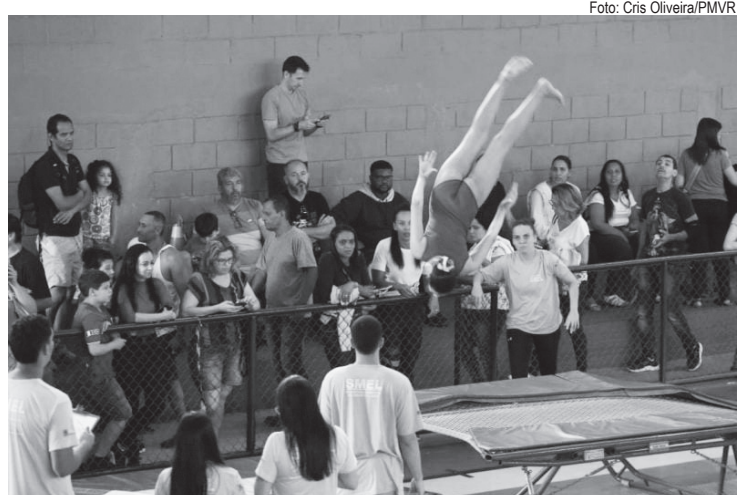
Evento realizado pela Smel neste sábado, no ginásio poliesportivo do bairro São Geraldo, premiou todos os participantes com medalhas