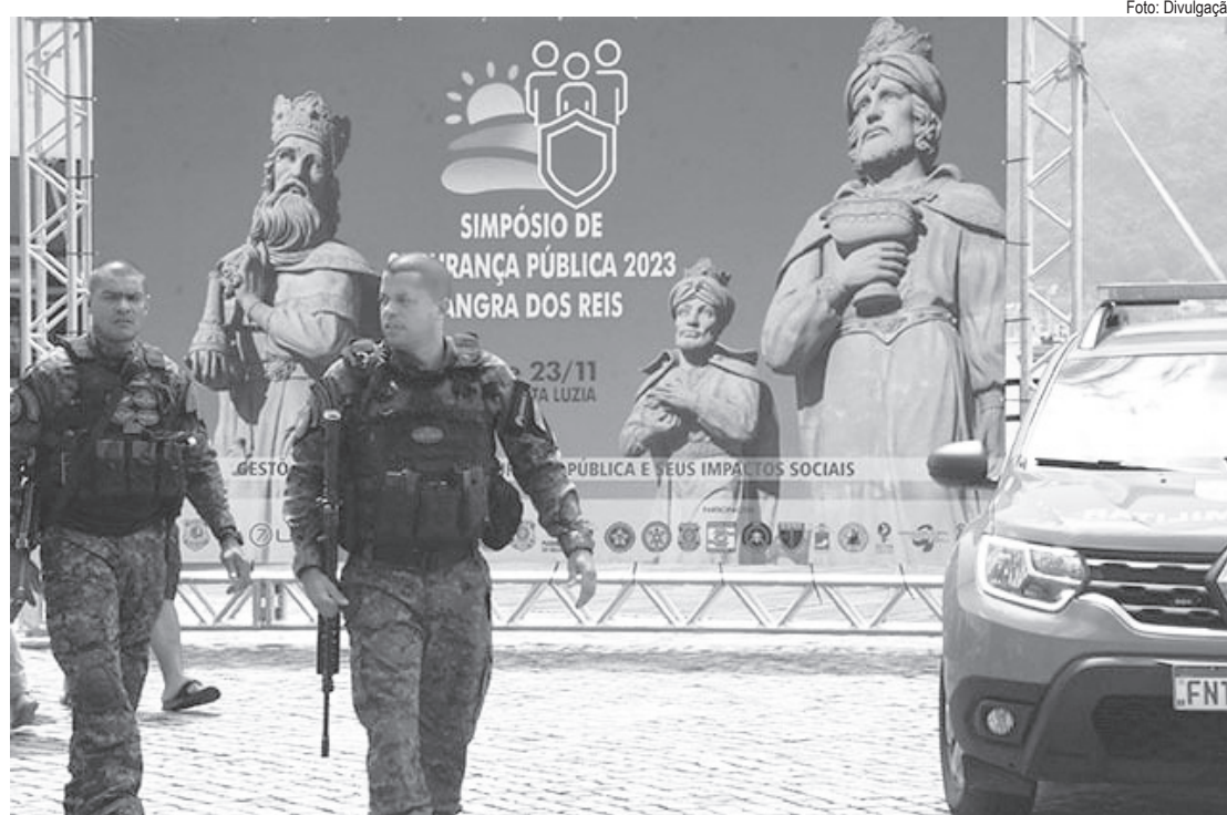
Simpósio explorou as tendências mais recentes em inteligência, inovação e tecnologia no combate à violência