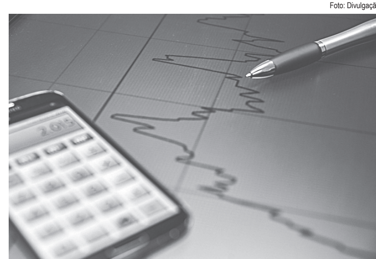
Cerca de 46,7%, ou seja, 2.083 municípios, informaram que não acreditam em um cenário positivo para 2024

Quase a mesma quantidade, 46,7%, ou seja, 2.083 municípios, informaram que não acreditam em um cenário positivo.