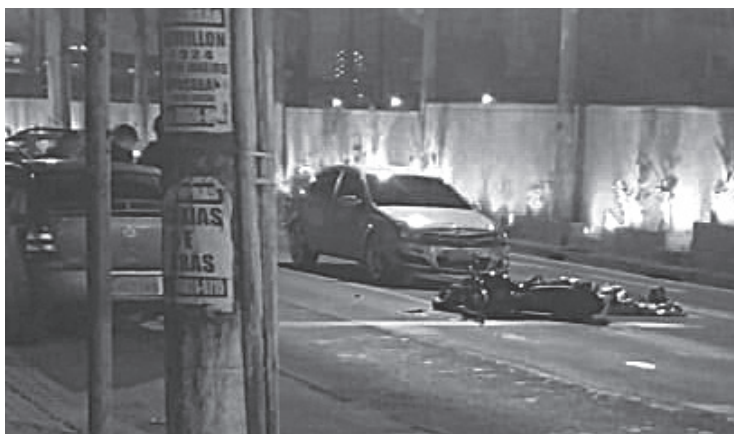
Acidente aconteceu na madrugada de domingo (3)