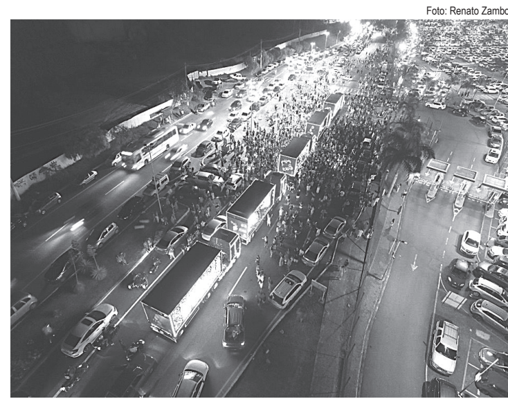
Publico acompanhou a caravana e se emocionou com as luzes e mensagens de natal

Caminhões arrastaram uma multidão pelos bairros São Geraldo, Centro, Aterrado, Retiro, Vila Mury, Vila Santa Cecília e Conforto