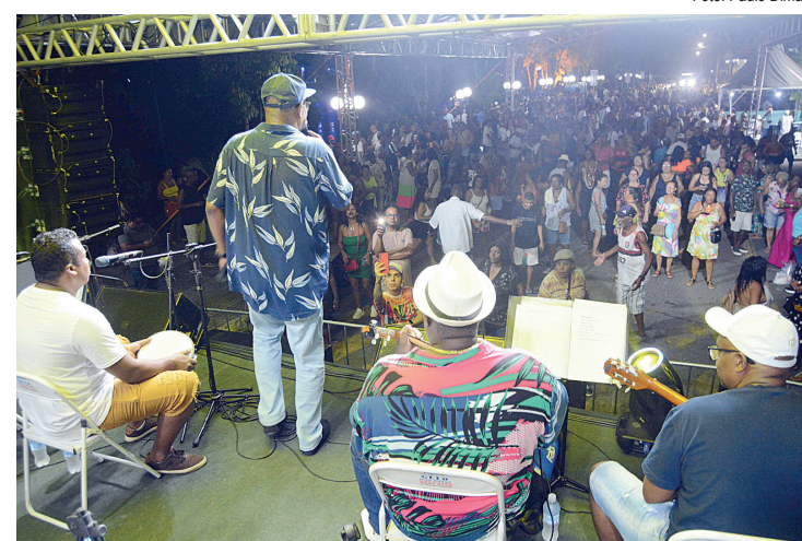
Programação do 'Dia Nacional do Samba' continuou no Calçadão no domingo (3)