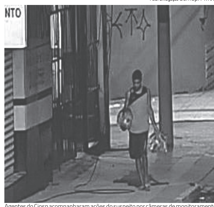
Agentes do Ciosp acompanharam ações do suspeito por câmeras de monitoramento