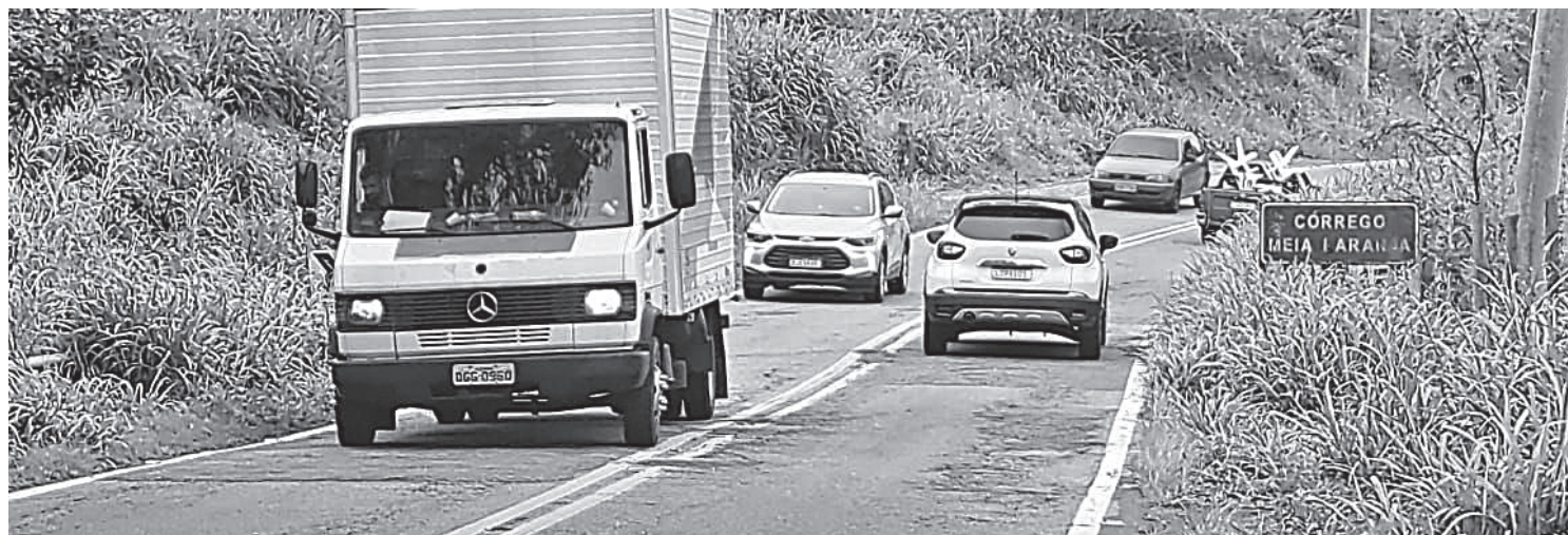
RJ-155 (Rodovia Saturnino Braga), que liga Barra Mansa a Angra dos Reis, na Costa Verde, apresenta problemas no asfalto em seu quase 80 quilômetros

A condição do pavimento das rodovias impacta o consumo de combustível. Para este ano, a CNT estima que 1,139 bilhão de litros de diesel serão desperdiçados pela modalidade rodoviária do transporte nacional.