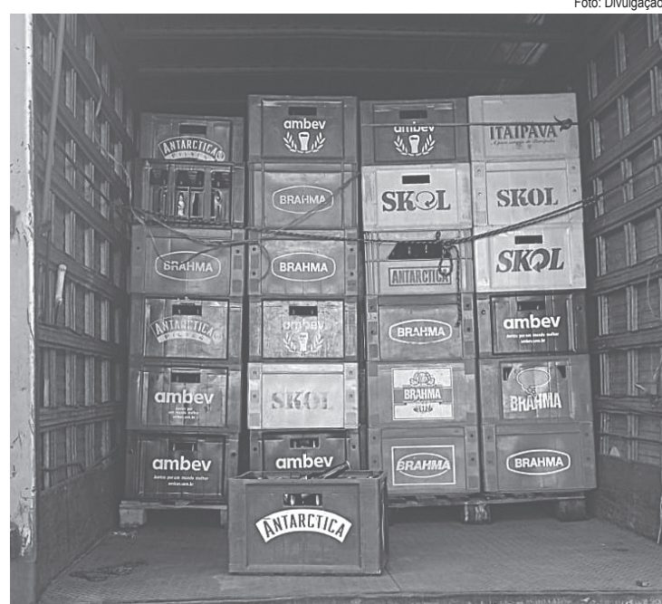
Segundo representante da AmBev, análise constatou as irregularidades