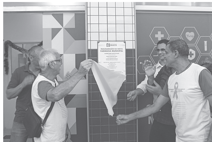
Novo endereço fica na Rua Coronel Alfredo Soares Oliveira — nº 182, no centro de Quatis