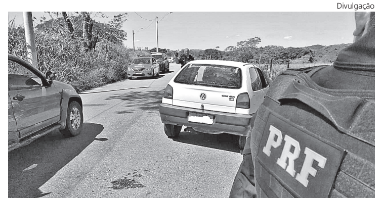
AÇÃO OCORREU entre a PRF e PM na tarde de ontem