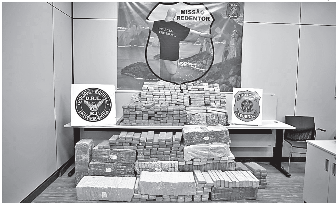
A DROGA estava acondicionada em um caminhão baú oriundo

“A droga estava acondicionada em um caminhão baú oriundo de São Paulo e tinha como destino a capital do Rio de Janeiro”, disse a Polícia Federal por meio de nota, não dando, até o fechamento desta edição, mais detalhes sobre os suspeitos presos.