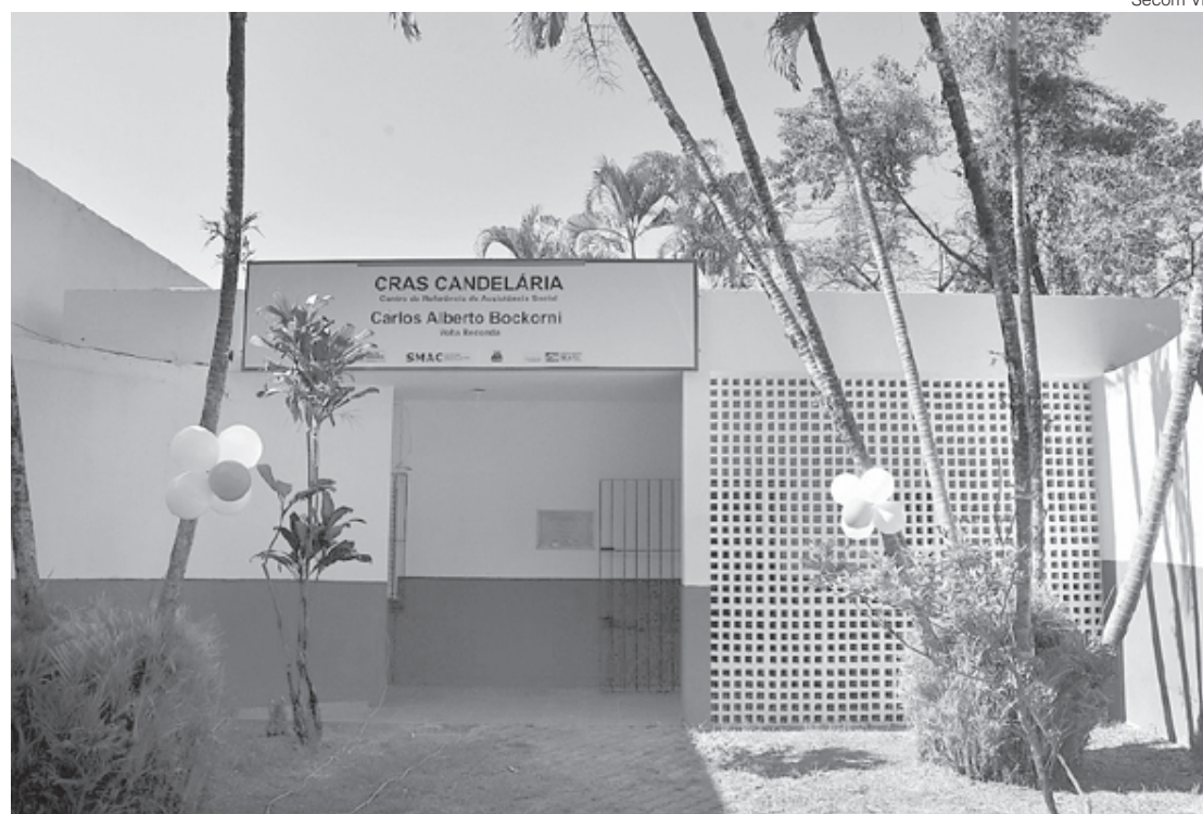
Reabertura dos Cras contribuiu para crescimento na quantidade de atendimentos

— Quando retornamos para a gestão da SMAC, em 2021, encontramos inúmeros CRAS fechados e alguns fun-