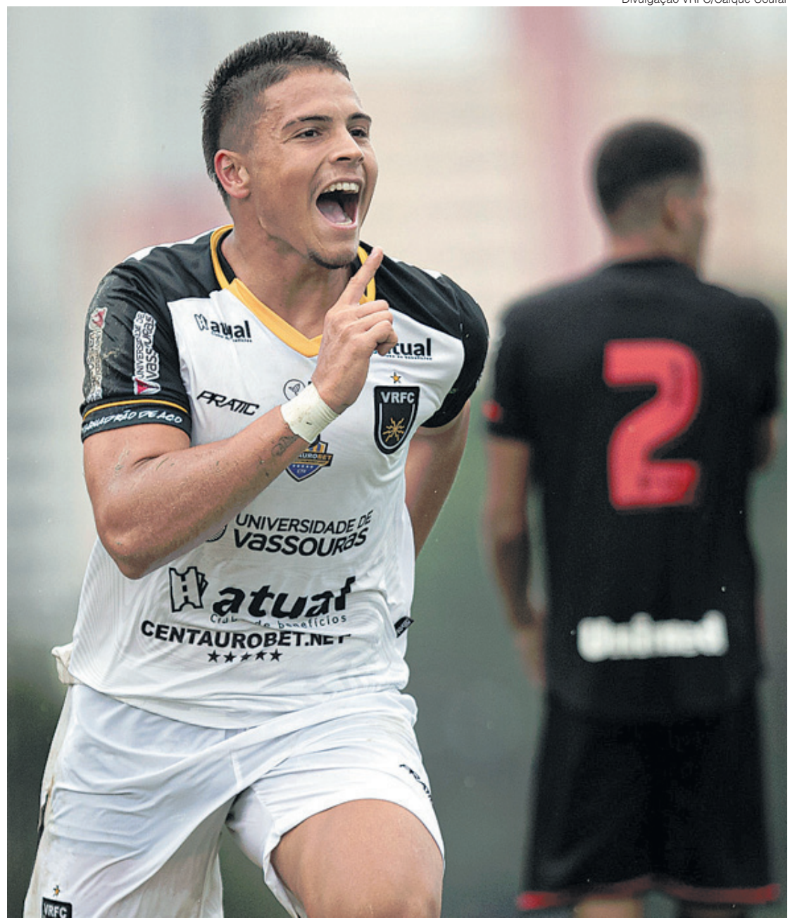
Garotos de Aço vão para cima buscar os três pontos diante do Mauá-SP

Outra equipa da região que entra em campo nesta sexta-feira é o Resende. O time também perdeu na estreia da competição, para o Corinthians, e enfrenta o São José, os donos da casa, às 19h30. O Gigante do Vale está no grupo 15.