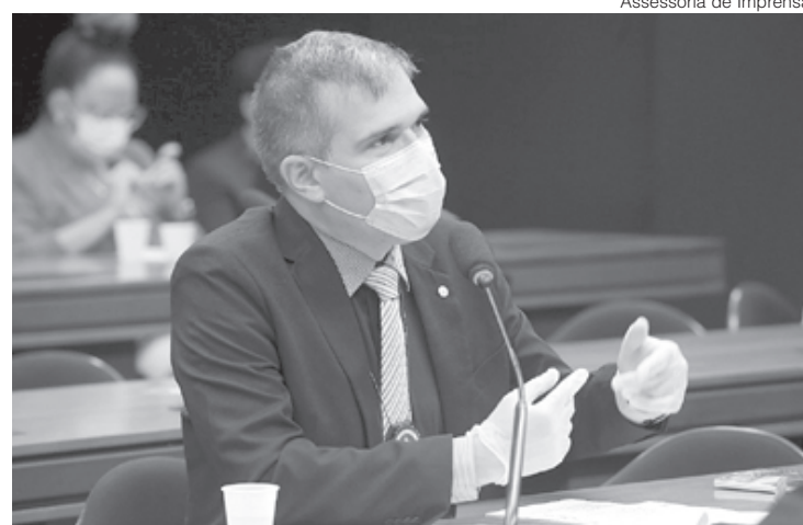
Furtado comemora decisão de destinar a professores 70% dos recursos do Fundeb

“Para que isso aconteça, diversas pessoas precisam estar envolvidas no processo, o que engloba desde o professor que