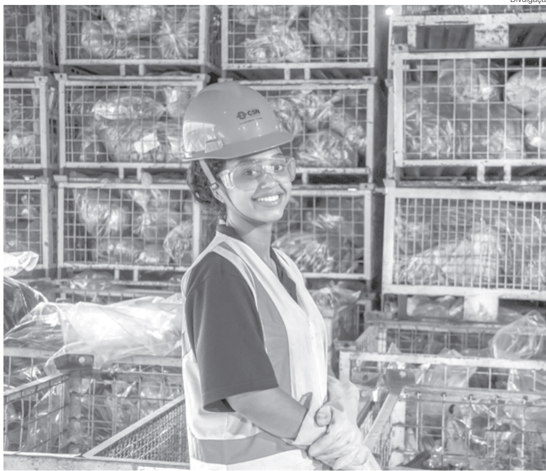
CSN tem setor para separar materiais recicláveis e dar o destino adequado a eles

Na Usina Presidente Vargas, em Volta Redonda, o local alcançou a marca de 50.000 toneladas de resíduos reciclados em cinco anos