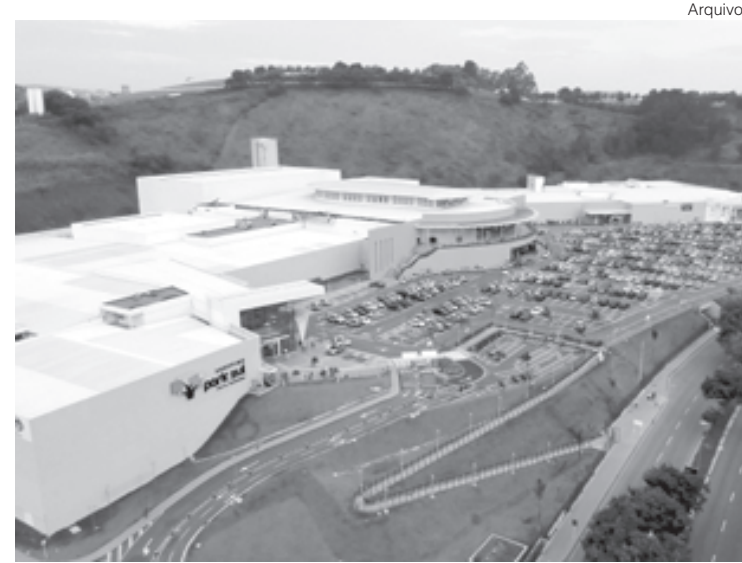
Objetivo da liquidação é abrir espaço nos estoques