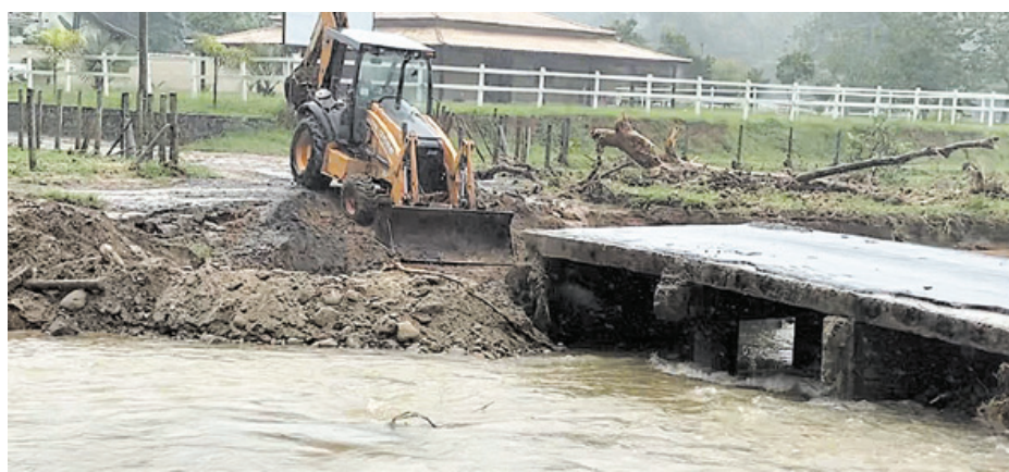
Máquina trabalha para recuperar ponte