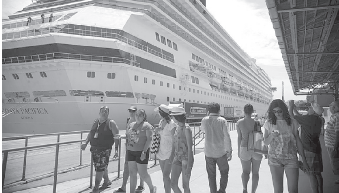
Cruzeiros deixarão de trazer 25 mil turistas ao Rio