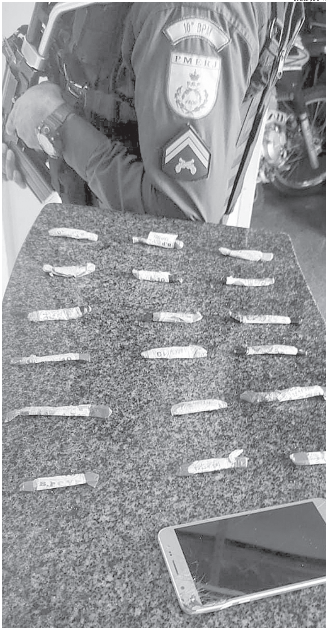
Suspeito tinha 18 tiras de maconha, que foram apreendidas

Levado para a Delegacia de Valença, ele foi indiciado por tráfico de drogas e seu celular ficou apreendido. Foi constatado que o suspeito tem antecedentes criminais pelos crimes de tráfico de drogas, por posse ilegal de arma e lesão corporal leve.