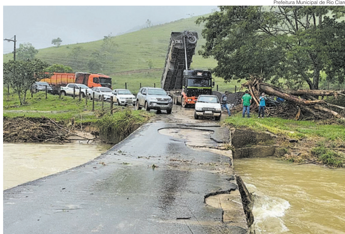
Água quase ultrapassou o nível da ponte em Rio Claro, que teve que ser interditada por segurança