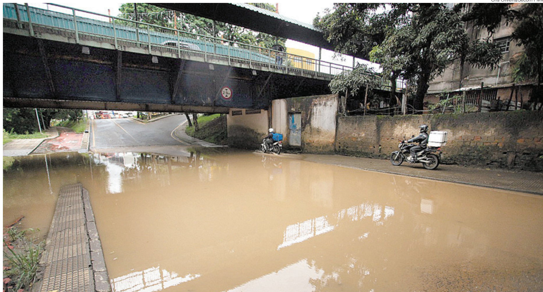
Ponte Pequetito Amorim, que liga os bairros Aterrado e Niterói, em Volta Redonda, foi interditada

Em BM, 210 toneladas de terra foram retiradas das ruas e passarela caiu; águas tomaram ruas de Porto Real, VR está com via interditada e Rio Claro tenta recuperar duas pontes