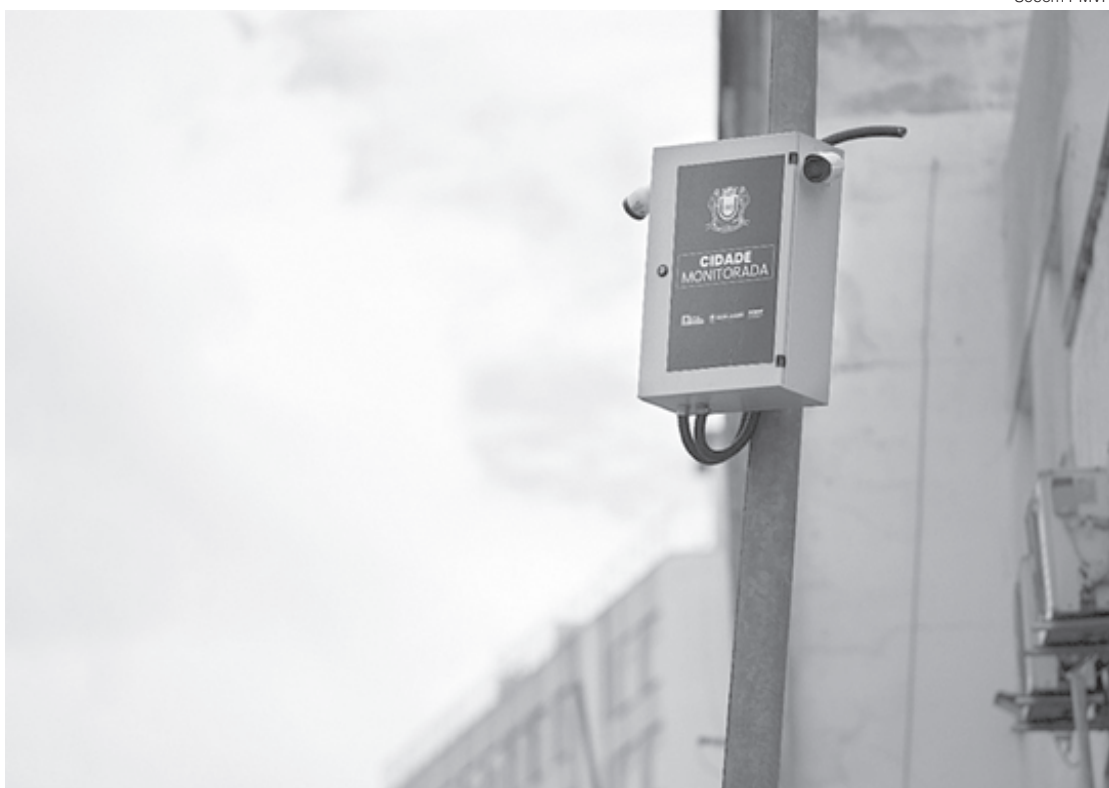
Novas câmeras serão identificadas por adesivos