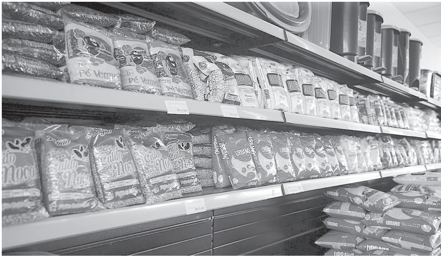
Produtos da cesta básica subiram em todas as capitais

Os dados mostram que entre dezembro de 2020 e de 2021 tiveram alta acumulada de preços em quase todas as capitais pesquisadas a carne bovina de primeira (de 5% em Aracaju a 18,76%, em Porto Alegre), açúcar (entre 32,12% em Fortaleza e 73,25% em Curitiba), óleo de soja (de 8,94% em Goiânia a 11,68% em Campo Grande), pó de café (entre 39,42% em São Paulo a 112,44% em Vitória) e o to-