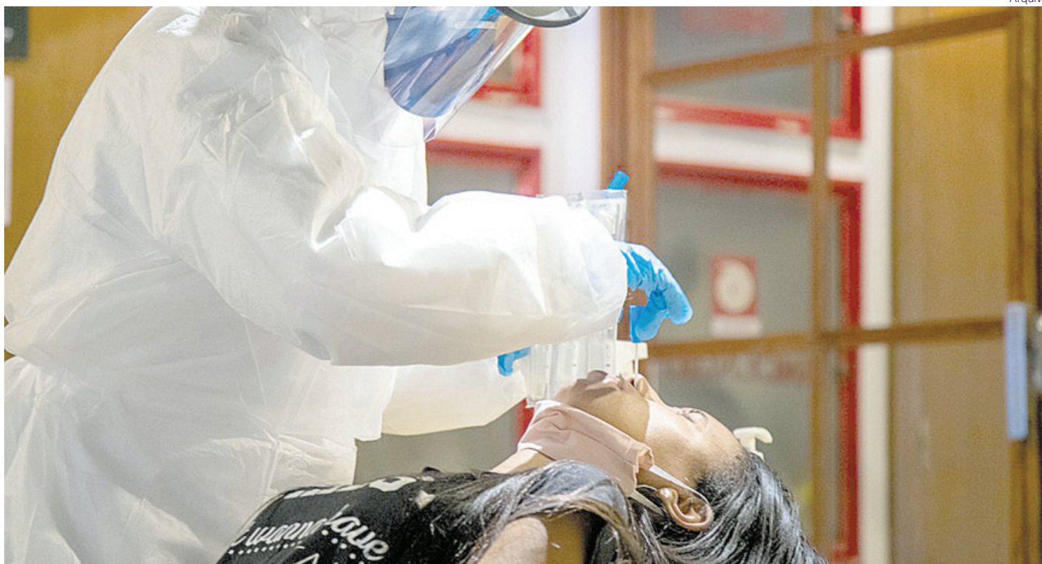
Especialista acredita que a tendência é de aumento no número de casos de Covid até o fim deste mês

Além da testagem para a Covid, Mello destaca que também houve um aumento muito grande na procura por exames para detectar o vírus da Influenza, o que segundo ele não acontecia há anos.