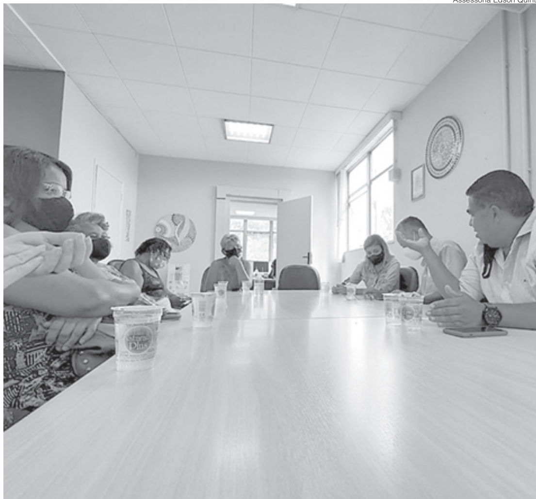
Vereador acompanha moradores dos condomínios Ingá I e II para reivindicarem melhorias