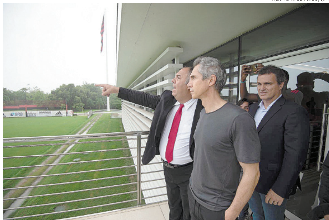
Paulo Sousa foi junto com a diretoria conhecer as instalações do Ninho do Urubu

- Estou muito contente, muito feliz. Desde Portugal já senti o carinho da torcida. Estou entusiasmado. Ainda não consegui completar o livro que ganhei. Vi muitos jogos da última temporada, não só do Flamengo, mas dos nossos adversários também. Dentro da carreira de um técnico, estas possibilidades não acontecem muitas