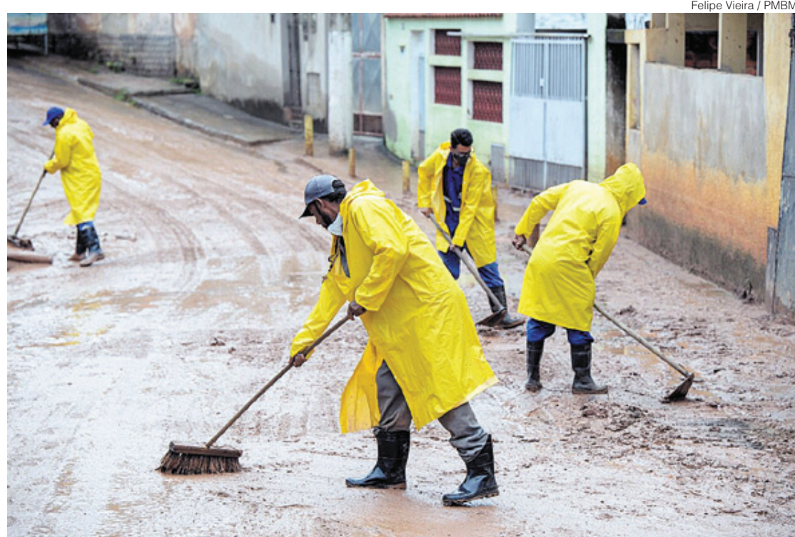
Lama tomou conta de ruas de Barra Mansa; equipes passaram o dia fazendo limpeza