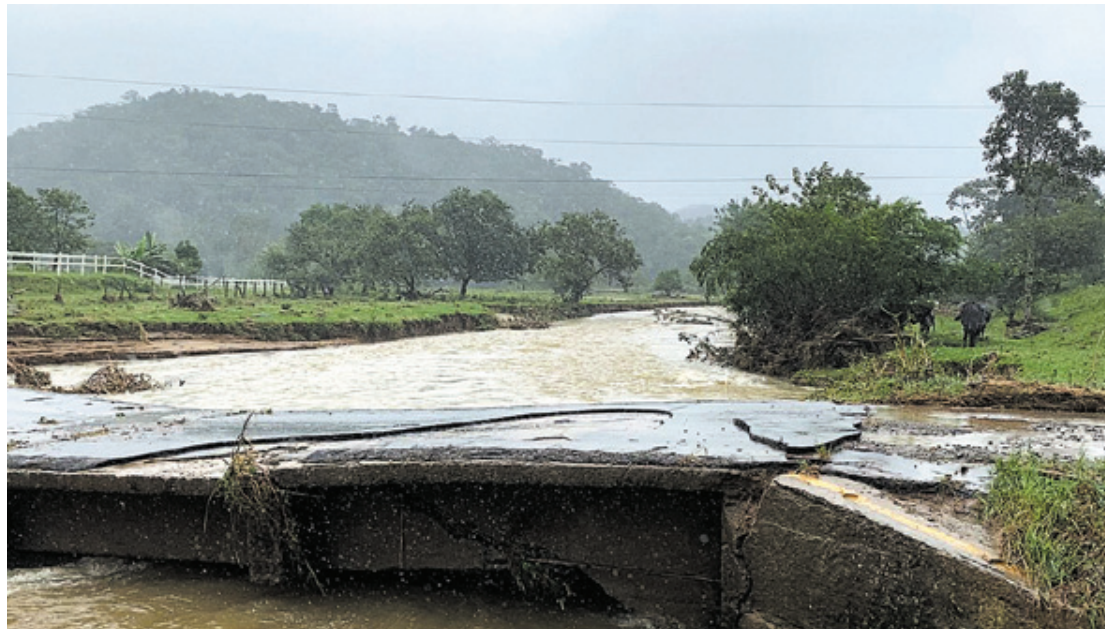
Chuvas causaram destruição de ponte

As pontes estão interditadas, prejudicando diretamente um total de aproximadamente 300 (trezentas) famílias, causando prejuízos diversos, no que se refere ao acesso à equipamentos de saúde, educação e ao comércio em geral. A situação acarreta prejuízos à Comunidades de baixa renda, e a solução do problema, ou seja, a construção de 02(duas) novas pontes é de grande interesse social.