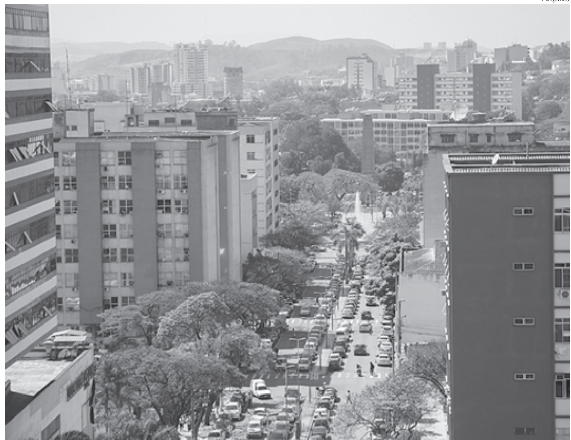
Volta Redonda se mantém como a cidade que mais abre postos de trabalho na região

A plataforma Retratos Regionais da Firjan tem como base o saldo de empregos formais disponibilizados no Caged. Em painel setorial são disponibilizados dados específicos dos setores industriais. Em painel regional, que também permite a busca por município, é apresentado o cenário geral de empregos, incluindo todos os grandes setores.