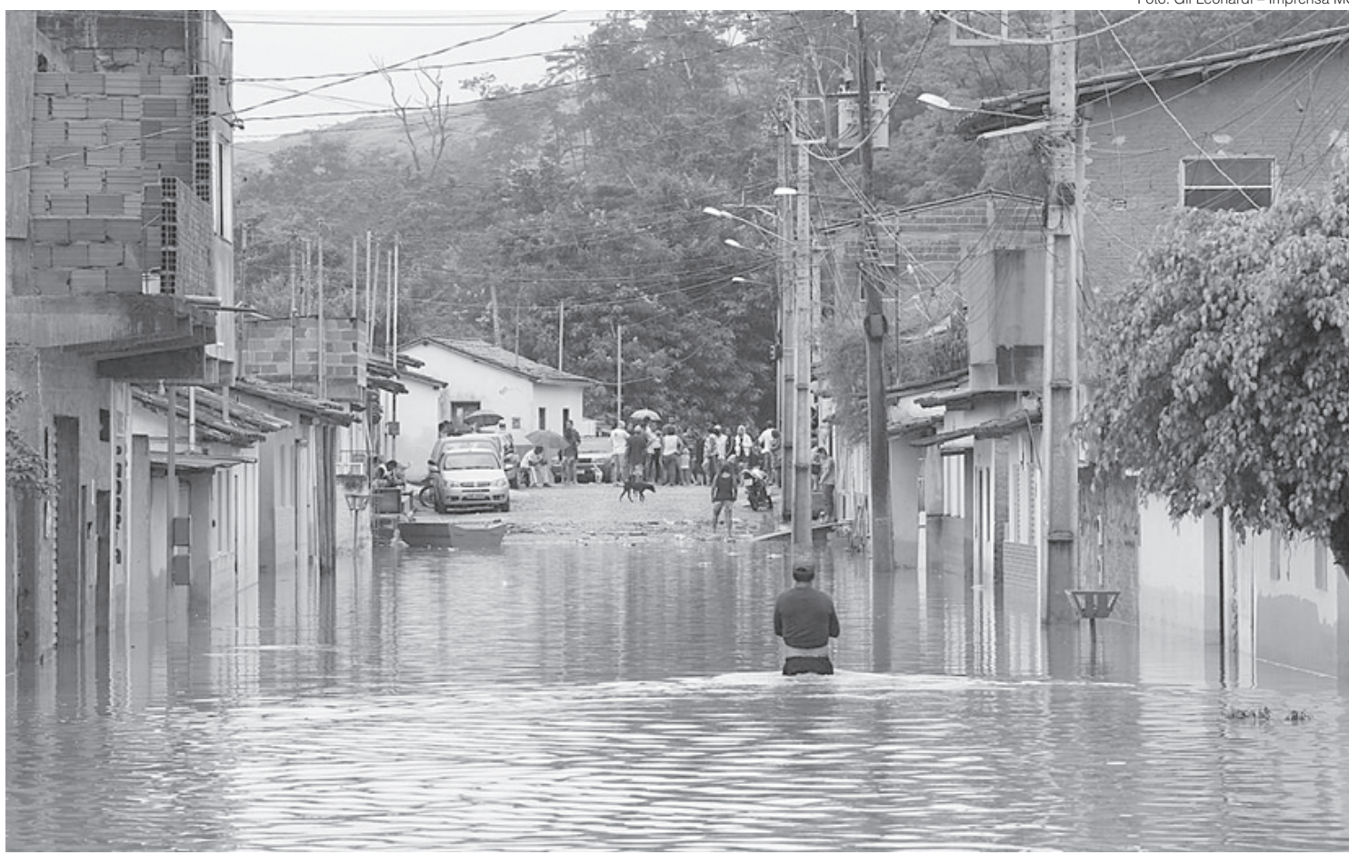
Chuvas em Minas Gerais estão mais intensas que no verão passado

Por Alex Rodrigues - Repórter da Agência Brasil - Edição: Valéria Aguiar