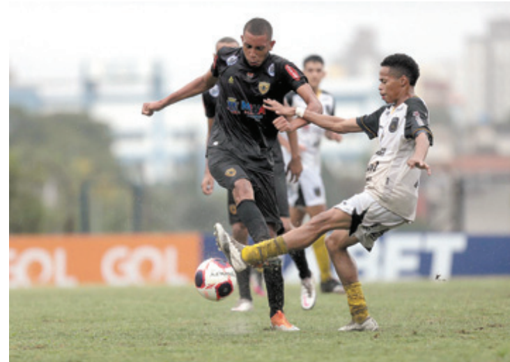
Na próxima rodada, Garotos de Aço enfrentam o Mauense-SP, dia 10, às 13h, no Estádio Pedro Benedetti