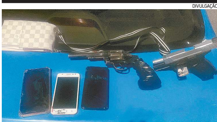
Armas e celulares apreendidos

A especializada informou que as investigações estão em andamento para esclarecer o crime. O marido de Ivone foi preso em flagrante e indiciado por feminicídio. A pena é de 12 a 30 anos de prisão. A perícia foi realizada no local e testemunhas estão sendo ouvidas. Itabus