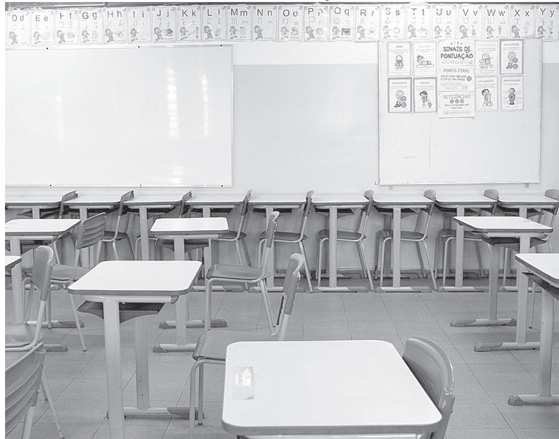
CNM recomenda a municípios que tenham cautela com novo piso do magistério