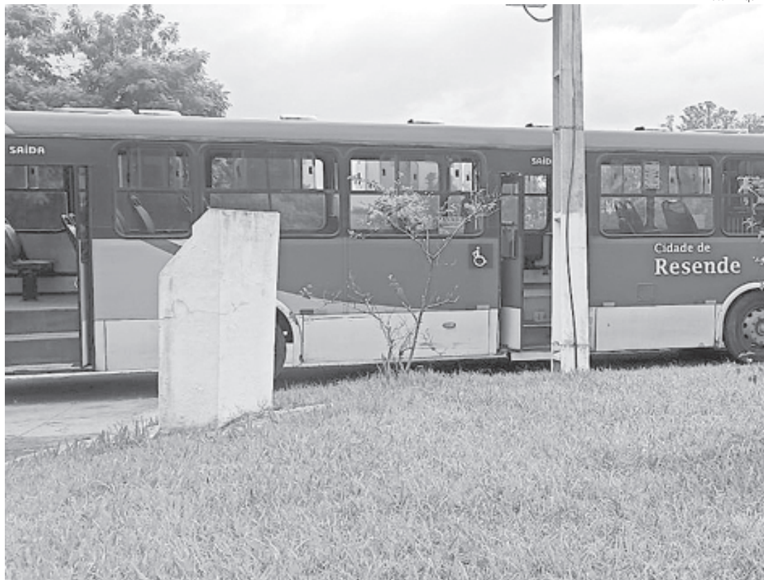
Ônibus da São Miguel vão parar na quinta-feira

O presidente do Sindicato dos Rodoviários informou no ofício que a greve vai ocorrer porque as negociações entre os