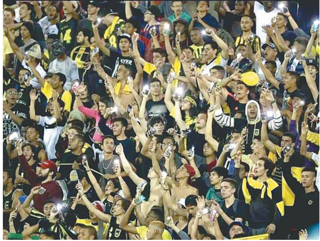
Venda de ingressos para o confronto já está disponível pela internet e em pontos físicos

Bilheteria do Raulino de Oliveira (inteira e meia-entrada) - De 09h às 12h - De 13h às 17h