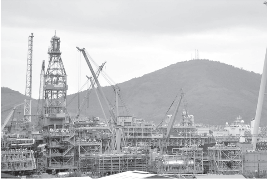
Indústria naval deve voltar a crescer e vai ampliar a geração de empregos em Angra

Agora, com o governo federal colocando na agenda a retomada de investimentos no setor naval e com o reinício, ainda no governo anterior,