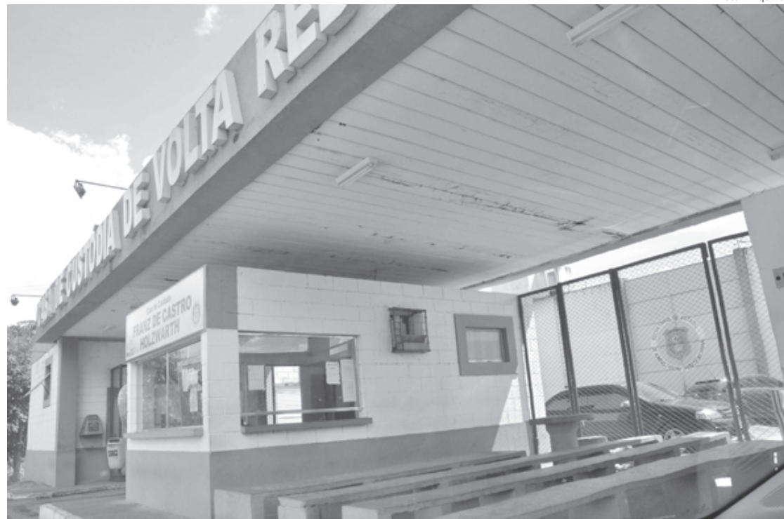
Dados de menores que visitam parentes presos são alvo de preocupação

“Esta medida representa um grande avanço e acreditamos que é necessária a realização de um trabalho de campanha institucional para divulgar que não há mais a disponibilização desta informação no Portal de