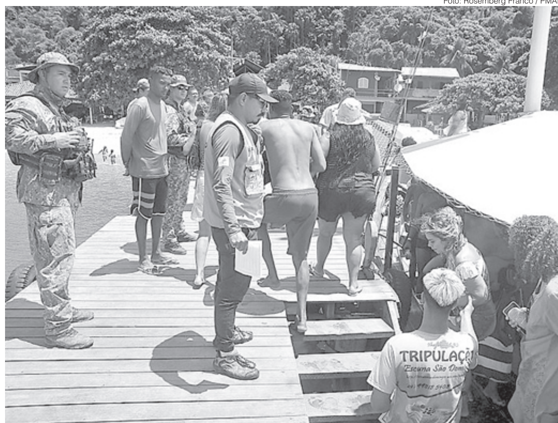
Prefeitura realizou ação de conscientização nesta segunda na Ilha Grande

Equipes da TurisAngra atuarão em todos os cais de turismo da cidade, checando o pagamento da taxa. A agência ou operadora que vier a utilizar o cais e não tiver realizado o pagamento, terá seu CNPJ ou o CPF de seu representante inscrito na dívida ativa do município. Mais informações podem ser obtidas pelo telefone 24 99213-3365.