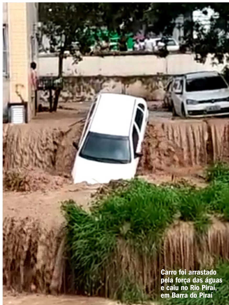
Carro foi arrastado pela força das águas e caiu no Rio Paraíba, em Barra do Pirai

O Rio Paraíba do Sul transbordou no fim da tarde desta segunda-feira (13), em Barra do Pirai, e provocou o alagamento de diversas ruas da cidade. A região central da cidade foi a mais afetada, principalmente nas proximidades da Santa Casa de Misericórdia. Os bairros Química, Oficinas Velhas e Boa Sorte também sofreram com a força das águas. Na Rua Franklin de Moraes, um carro caiu no Rio Paraíba. A Secretaria de Defesa Civil de Barra do Pirai informou que até o fechamento desta edição não havia registrado deslizamentos e nem mesmo havia informações sobre desalojados ou desabrigados. O prefeito de Barra do Pirai, Mario Esteves, determinou ações imediatas de que todas as secretarias.