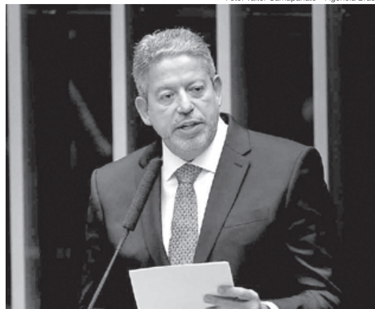
Arthur Lira: ‘O que o parlamentar falar pode ter consequência’

Sargento Fahur negou que tenha ameaçado a vida de Flávio Dino e reconheceu que se excedeu na manifestação. “No caso da ofensa pessoal, acredito sim ser injustificável, mas não foi ameaça”, afirmou.