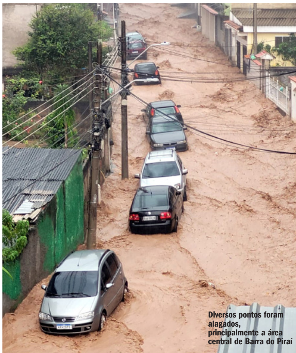
Diversos pontos foram alagados, principalmente a área central de Barra do Pirai

Região central da cidade foi a mais afetada, principalmente nas proximidades da Santa Casa