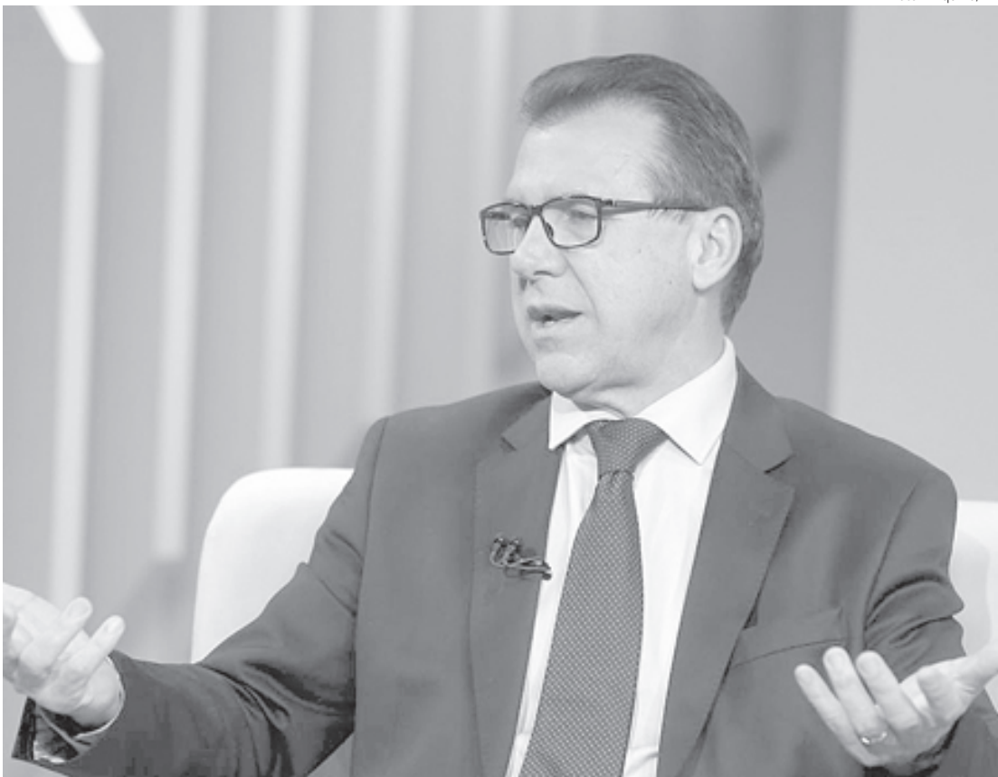
Na reunião na Fiesp, o ministro também pediu apoio dos industriais para a modernização da legislação trabalhista

- Não cabe a palavra revogar. Cabe a palavra de que temos que revisar o que já foi feito, observar os excessos que estão ali de precarização