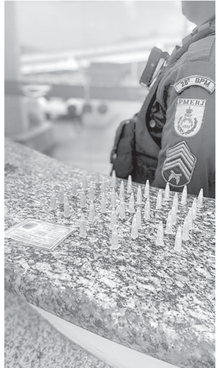
Suspeito de tráfico de drogas foi identificado através de informações recebidas pelo Disque Denúncia