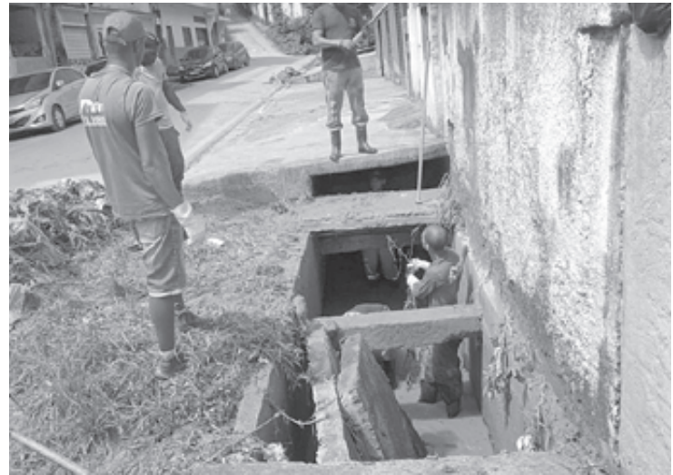
Serviços foram realizados durante a terça (14) e quarta-feira (15) em vários bairros de Barra do Piraí