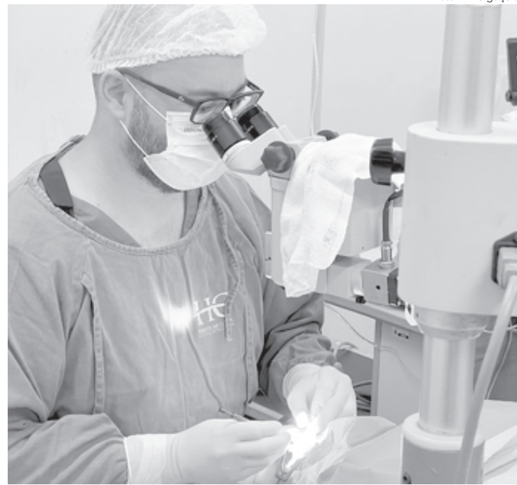
Moradores de Pinheiral podem realizar a cirurgia no próprio município

Para ter acesso à intervenção cirúrgica, o morador deve procurar a Unidade de Saúde da Família (USF) mais próxima de sua residência. O médico da unidade fará um encaminhamento para a Clínica Oftalmológica Municipal, e, após consultas e exames, caso os especialistas constatarem a necessidade da cirurgia e após o paciente passar pelos exames pré-operatórios e risco cirúrgico, será feito o agendamento. Em 2022 foram realizadas 191 cirurgias.