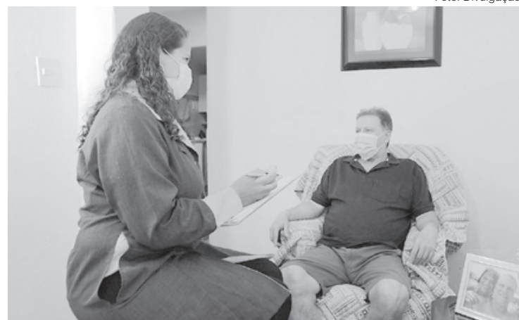
Programa desenvolvido pela Unimed Volta Redonda está em atividade há 15 anos