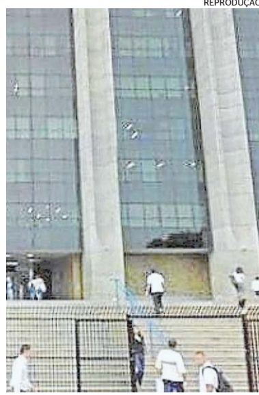
Salário na conta de servidores

O valor da folha salarial (bruta) mensal do município é de cerca de R$ 1,4 bilhão. O prefeito Eduardo Paes já disse que quer criar um calendário com pagamento no segundo dia útil do mês futuramente. O desafio ainda é pagar o 13º de 2020 de funcionários que recebem acima de R$ 4 mil.