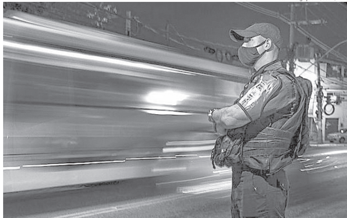
Novas instalações aumentarão segurança para a população

Na Base Integrada de Segurança Pública ficarão as viaturas do Proeis, onde estarão a bordo dois policiais militares e um guarda municipal. Eles farão patrulhamento todos os dias pelos bairros Retiro e Aterrado. Os agentes serão auxiliados por profissionais que ficarão na base, monitorando as câ-