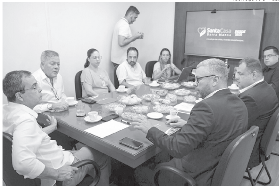
Prefeito conversa com dirigentes da Santa Casa sobre reforma do Pronto Socorro SUS