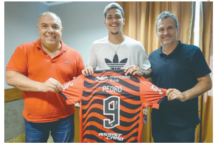
Pedro renovou contrato com o Flamengo nesta quarta-feira