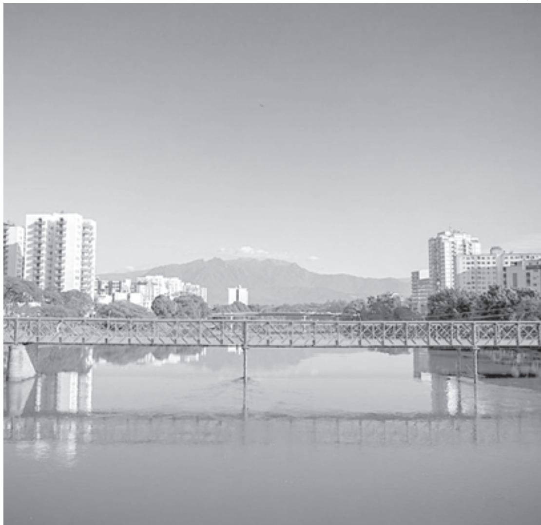
Resende é um dos municípios que deixarão de ter perda com FPM após decisão do STF

O ministro Lewandowski determinou, ainda, que eventuais valores já transfe-