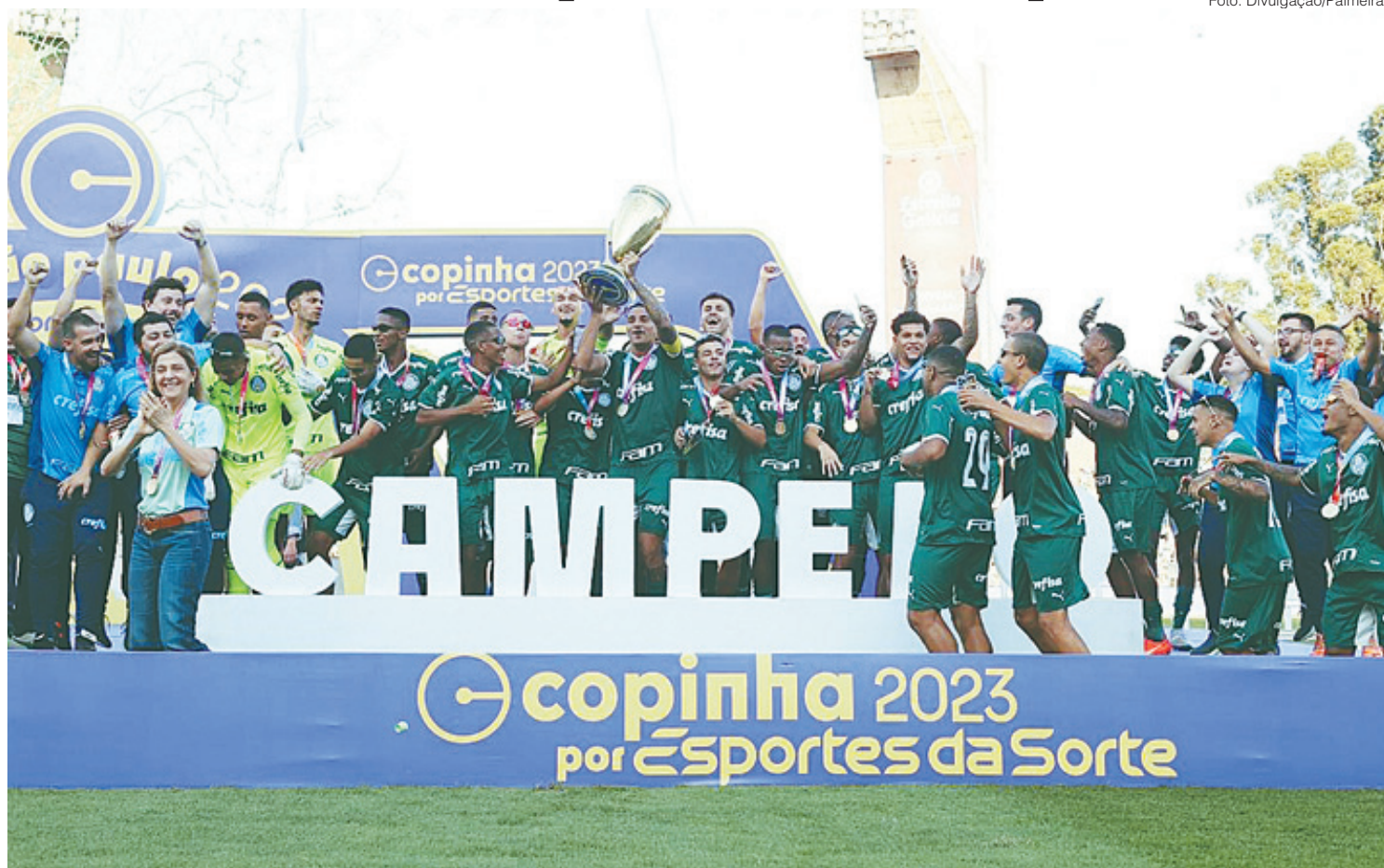
Elenco do Palmeiras campeão na Copa São Paulo de 2023 comemora o título no Canindé