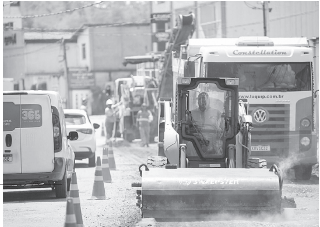
Felipe Vieira / PMBM

Cerca de 10 mil veículos trafegam pela avenida por dia, além de aproximadamente 20 mil usuários de ônibus