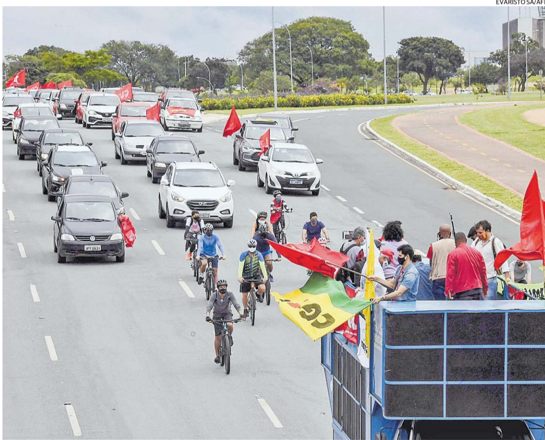
Na Capital Federal, ato pedia agilidade na vacina contra Covid e impeachment do presidente

A fileira de carros ocupava duas faixas da pista e um