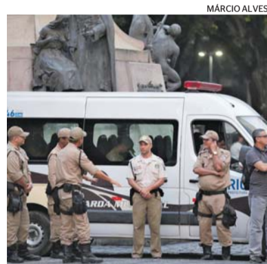
Guardas municipais do Rio

Outra mudança é que, a partir de agora, os guardas municipais em estágio probatório também poderão atuar nos plantões de maiores jornadas. Para a escala de 12 horas, estes servidores deverão trabalhar, prioritariamente, no período diurno. E para o