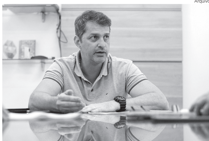
Secretário destaca que profissionais da rede pública estão sendo capacitados

O documento elaborado pela Secretaria de Saúde ainda inclui procedimentos recomendados para diagnóstico laboratorial. A necessidade de usar Equipamento de Proteção Individual (EPI) adequado, que inclui luvas descartáveis, avental e proteção para os olhos ao manusear amostras potencialmente infecciosas bem como uso de máscara N95 durante procedimento de coleta de materiais respiratórios com potencial de aerossolização (aspiração de vias aéreas ou indução de escarro). A amostra deverá ser encaminhada ao Lacen (Laboratório Central