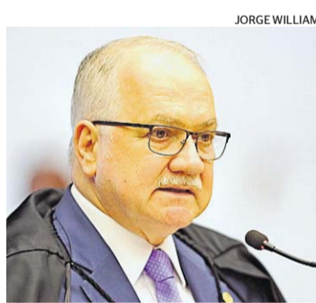
O ministro Edson Fachin

não tratou das servidoras públicas porque elas têm regime próprio de licenças. Entidades, no entanto, podem entrar com pedido de extensão para benefício também das mães servidoras de prematuros. Não há previsão de data para julgamento definitivo do tema no plenário do Supremo. ✕