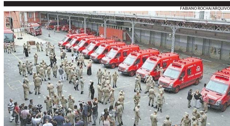
Boletos começaram a ser enviados ontem pelos bombeiros