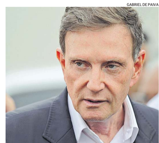
O prefeito do Rio, Marcelo Crivella

A Prefeitura do Rio estourou o limite máximo permitido pela Lei de Responsabilidade Fiscal para a despesa com pessoal em 2019 e chegou a 54,32% da Receita Corrente Líquida (RCL), comunicou o Tribunal de Contas do Município (TCM) em seu relatório de gestão fiscal. O órgão alertou ao prefeito Marcelo Crivella que terá que cortar pelo menos 20% das despesas com cargos e funções de confiança e exonerar servidores não-estáveis. A despesa com pessoal terá que ser reduzida em até dois quadrimestres seguintes. Crivella também está proibido pela legislação de aumentar, reajustar ou adequar salários.