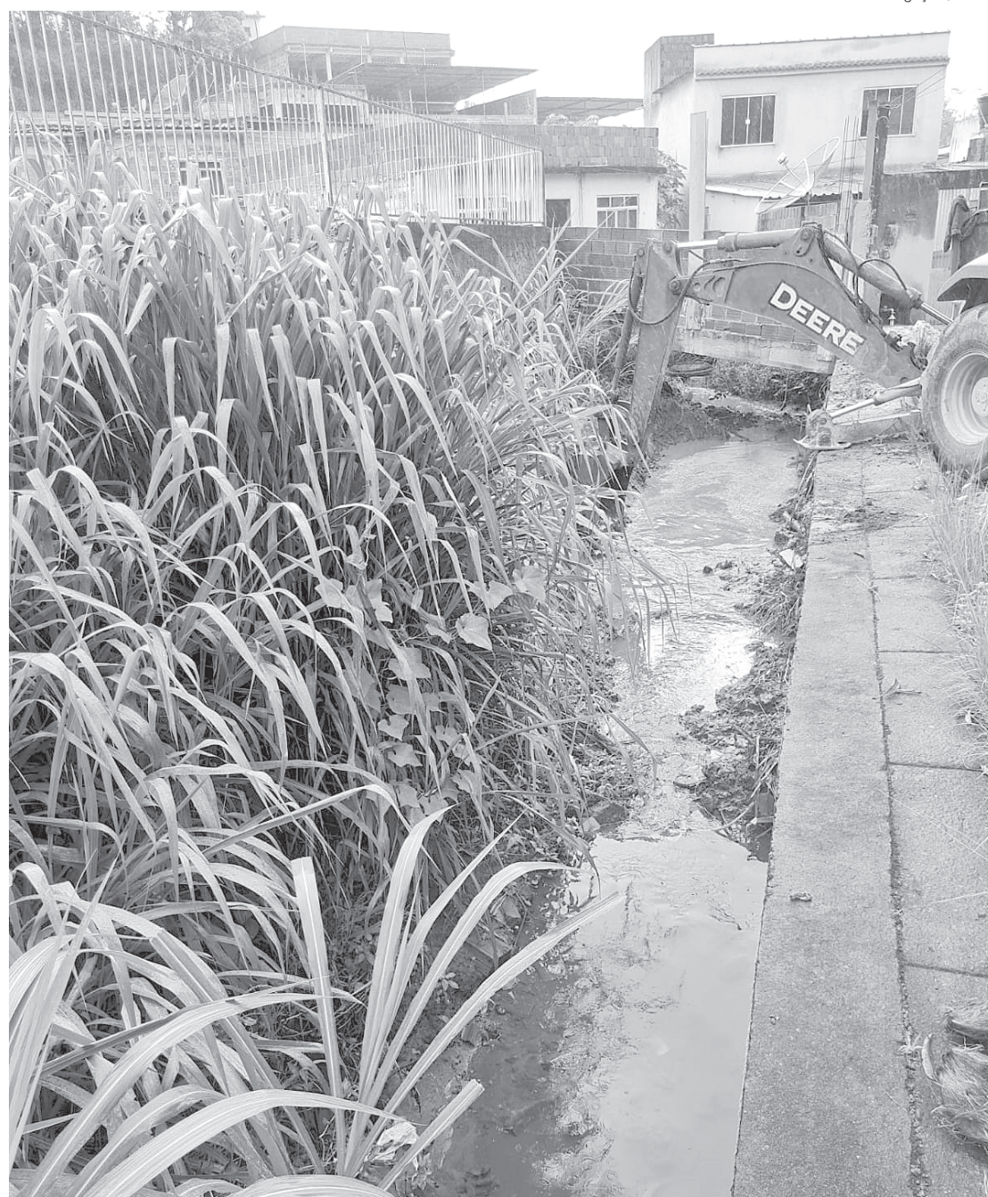
Trabalho também inclui limpeza de vias e calçadas, executada pela Secretaria de Infraestrutura

Com o apoio do caminhão-pipa e de retroescavadeiras, equipes da Secretaria de Infraestrutura executaram serviços de lavagem das vias e passeios públicos em diversos bairros de Volta Redonda. A Vila Santa Cecília, os bairros da região da Vila Brasília, Santa Rita do Zarur e São Luiz já foram beneficiados.