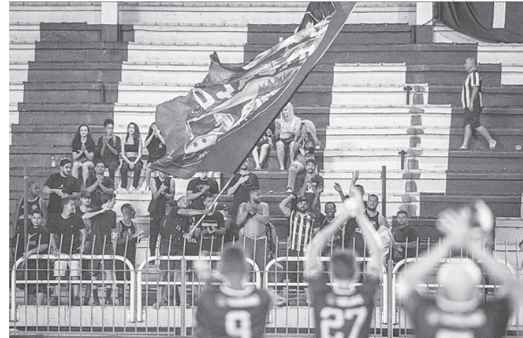
Diretoria disponibilizou 500 ingressos para a torcida em promoção que comemora os 46 anos do Volta Redonda

tas nos seguintes locais: Sede social do Volta Redonda FC, na Rua Ronald Jarbas, número 200, bairro São Lucas; Drogarias Povão nos bairros Amaral Peixo-