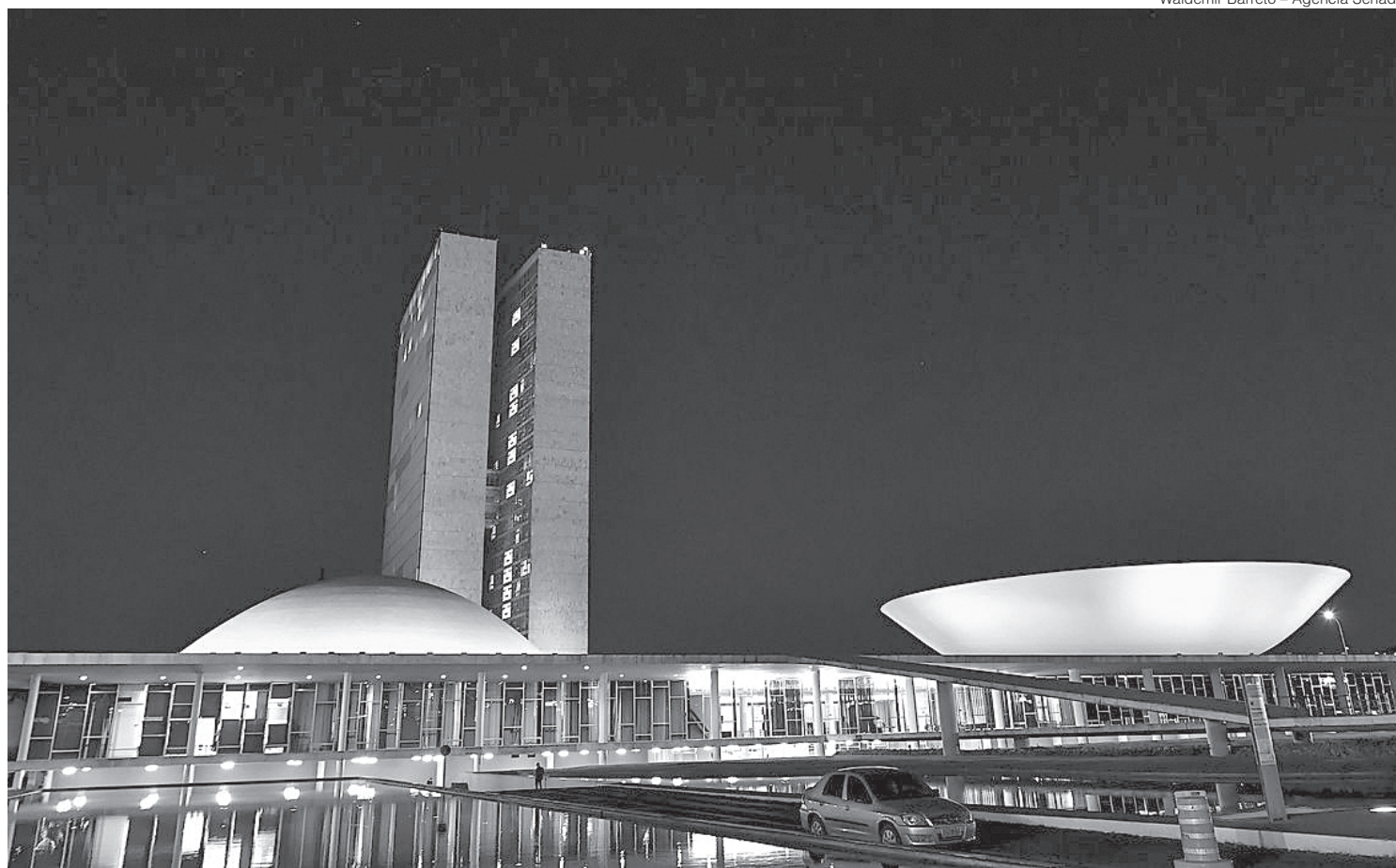
Congresso tem 45 propostas do Executivo que são consideradas prioritárias

pauta o PL 1776/15, que inclui a pedofilia na lista de crimes hediondos; e o PL 3780/20, que estabelece punições mais rigorosas para o abuso sexual cometido por sacerdotes, profissionais de saúde ou educadores ou qualquer pessoa que use da confiança da vítima menor de idade ou incapaz para cometer esse tipo de crime.