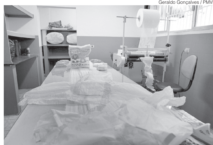
Geraldo Gonçalves / PMVR

Outra fábrica, que será responsável pela produção de absorventes menstruais, além das fraldas geriátricas, será inaugurada no dia 30 de março. A nova unidade ficará sediada em um imóvel próprio, no bairro Voldac, que está sendo totalmente readequado.