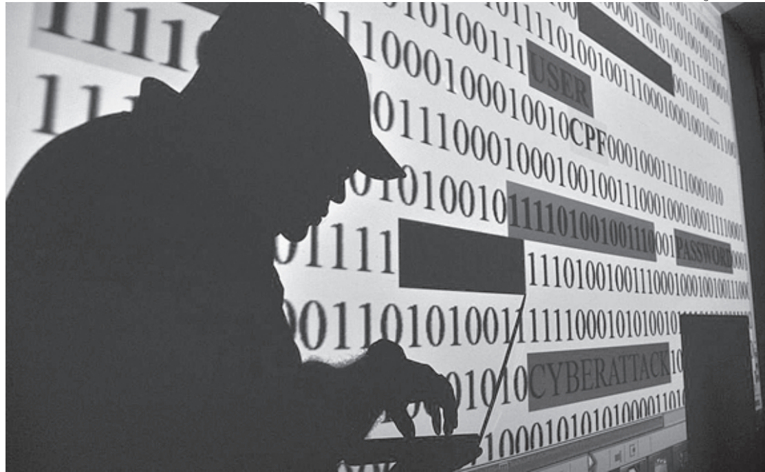
Lei cria critérios para proteger dados dos internautas