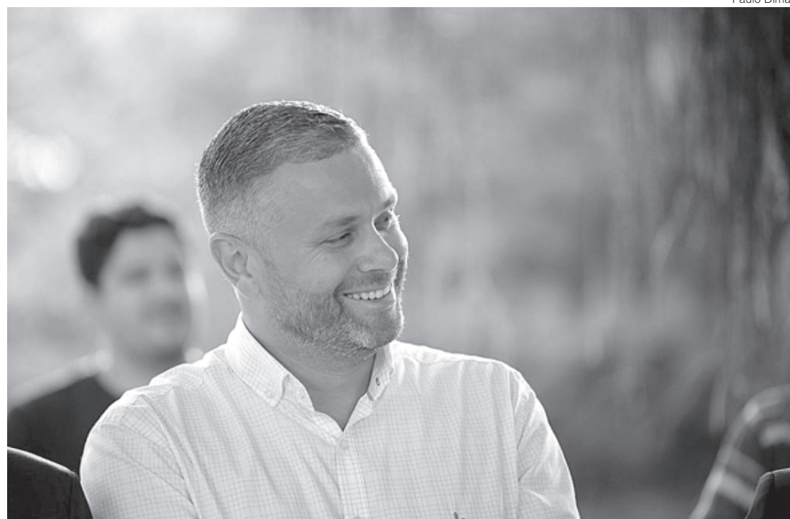
Drable afirma que cidade entrará em 'ciclo virtuoso' com investimentos

Os investimentos foram decididos por uma análise estratégica de negócio. De acordo com as estatísticas do Instituto Aço Brasil, a produção de aço bruto no Brasil alcançou 36 milhões de toneladas, crescendo 14,7% em 2021 na comparação com o ano anterior. Já o consumo aparente de produtos siderúrgicos atingiu 26,4 milhões de toneladas, subindo 23,2% no ano passado em relação a 2020. Deste modo, ainda que os resultados extraordinários de 2021 não sejam mantidos, a empresa acredita no crescimento significativo da demanda por