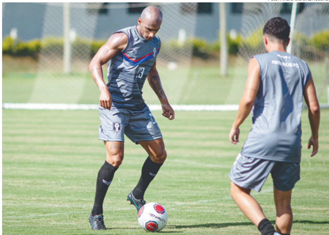
Alvinegro está há dois pontos da zona do rebaixamento e precisa da vitória fora de casa

-Tivemos uma semana forte de treinamentos e vamos para brigar pela vitória que nos afasta um pouco da parte de baixo da tabela, já que podemos ultrapassar o Nova Iguaçu com os três pontos, uma vez que teremos uma vitória a mais. A única coisa que