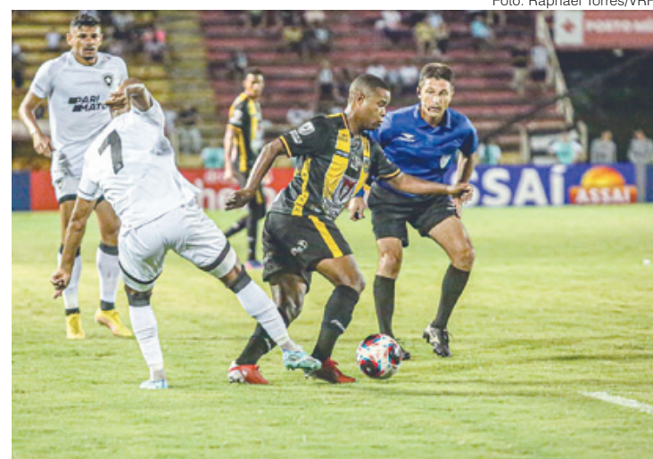
Voltaço faz 'jogo de seis pontos' neste domingo, em Moça Bonita