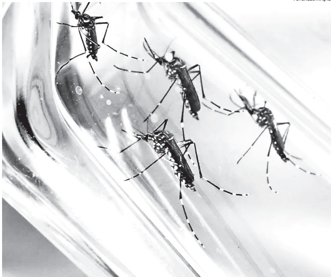
Sintomas: febre alta, exaustão, manchas vermelhas, dores no corpo, nas articulações e atrás dos olhos

O município do Rio corresponde a 48% do número total de casos notificados: são 72,3 mil ocorrências, três mil a mais do que regist-