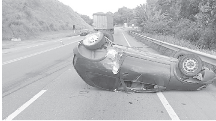
Motorista teria perdido o controle do veículo e batido no guard-rail