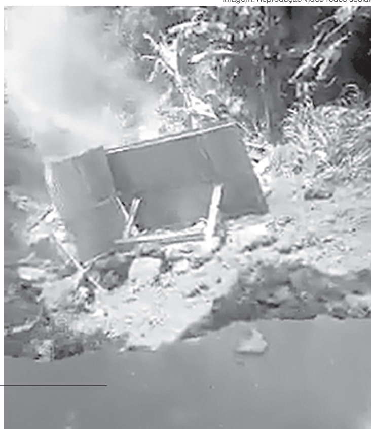
Imagem: Reprodução vídeo redes sociais

Terra deslizou e ponto de ônibus foi levado