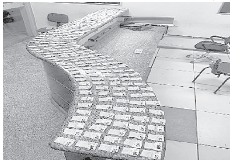
Flagrante ocorreu após denúncia de que duas pessoas estariam em um carro