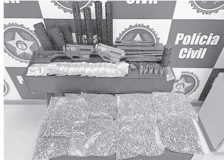
Projéteis e partes desmontadas de armas longas (especialmente de fuzis) eram levados para o Rio de Janeiro

Na ocasião, quatro pessoas foram conduzidas para a Desarme, na Cidade da Polícia, a fim de serem apresentadas à autoridade policial. O proprietário do imóvel foi preso e responderá pelos crimes de tráfico de armas de uso restrito e tráfico de muni-