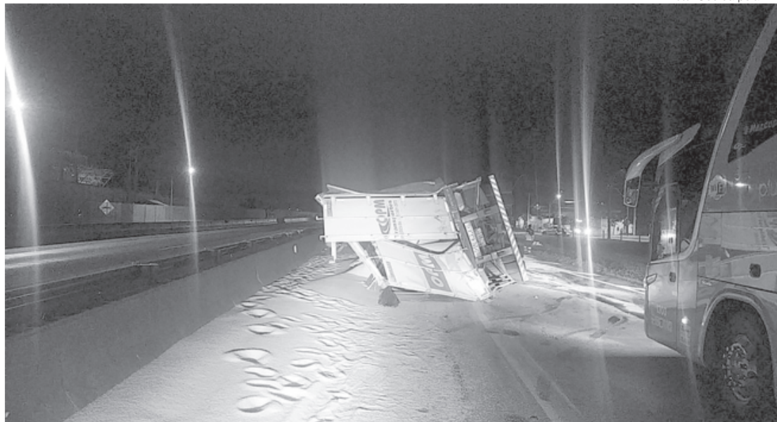
Acidente aconteceu na pista sentido São Paulo, na altura do km 322, próximo à praça de pedágio