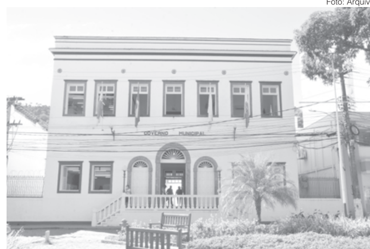
Arrecadação da prefeitura de Angra subiu 31% em relação ao previsto

"Esse crescimento da receita foi resultado de muito trabalho. Soma-se a isso o