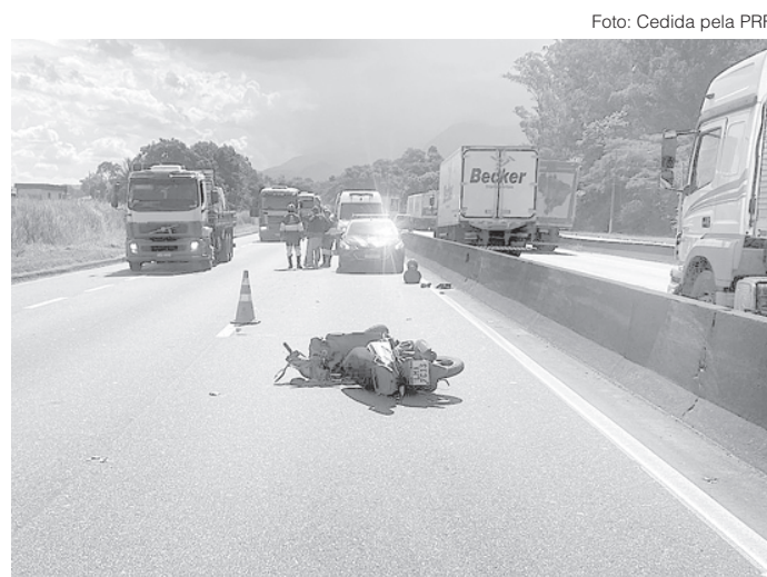
Acidente aconteceu no Km 306, na pista sentido Rio

A vítima foi socorrida pelo Corpo de Bombeiros, mas morreu a caminho do Hospital de Emergência de Resende. O animal atropelado também morreu.