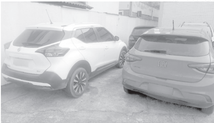
Fiat Argo e um Kicks roubados à mão armada nos bairros de São Cristóvão e Campo Grande, no Rio.