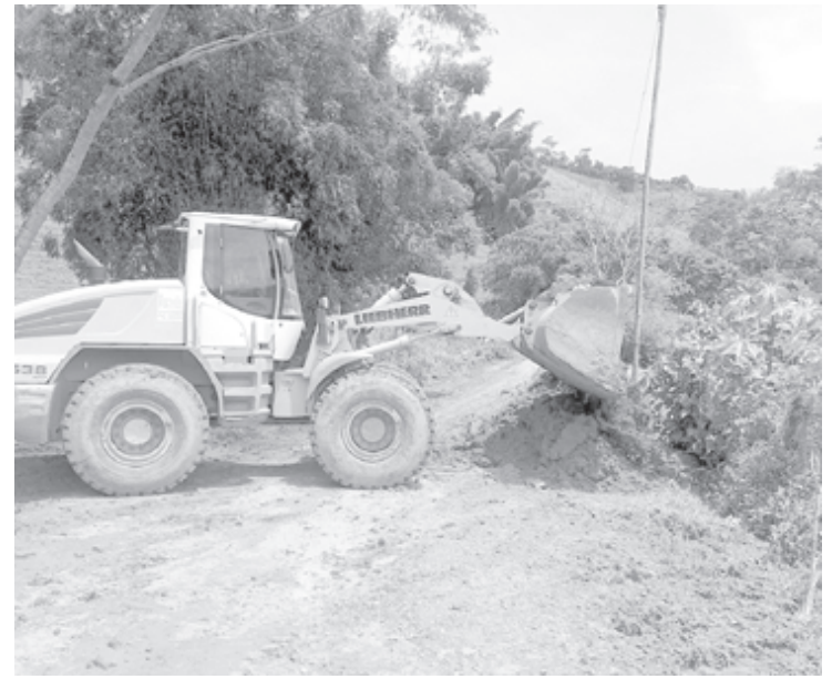
Máquinas trabalham em estradas vicinais para fluxo de veículos e escoamento de produção