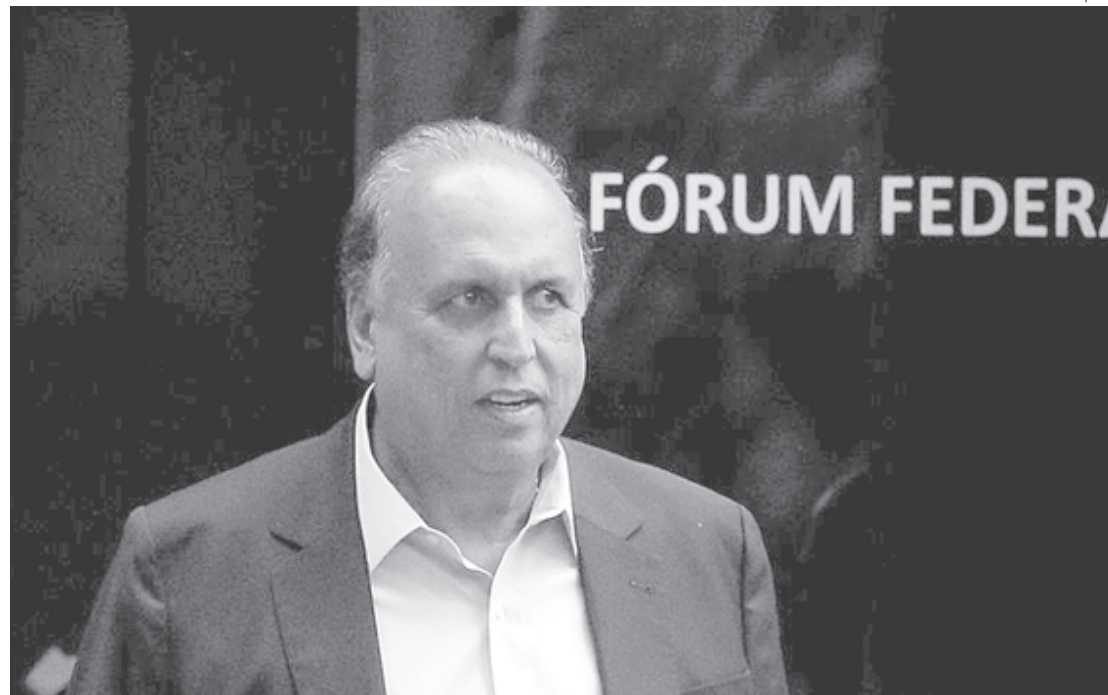
Pezão deixa de ser alvo de investigação porque delação foi rejeitada pelo Supremo

O ministro Felix Fischer, do Superior Tribunal de Justiça, determinou a prisão