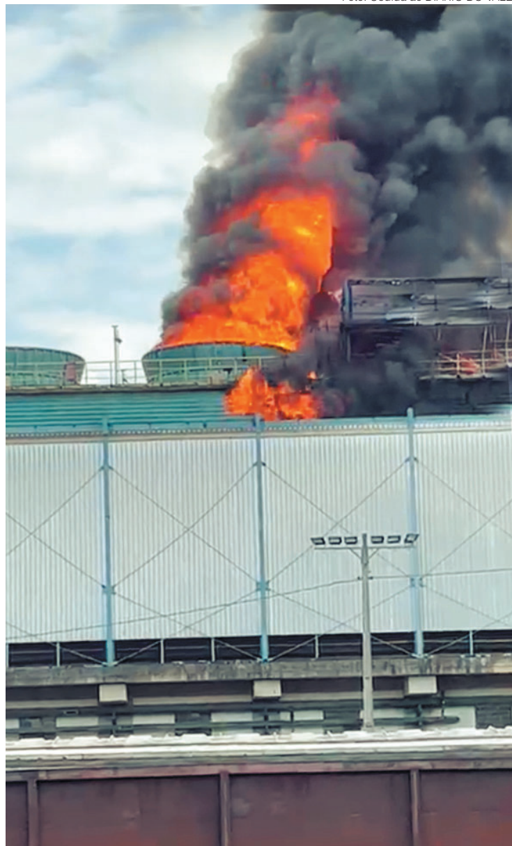
Incêndio atingiu unidade de aços longos da CSN e fumaça preta pôde ser vista de vários pontos da cidade