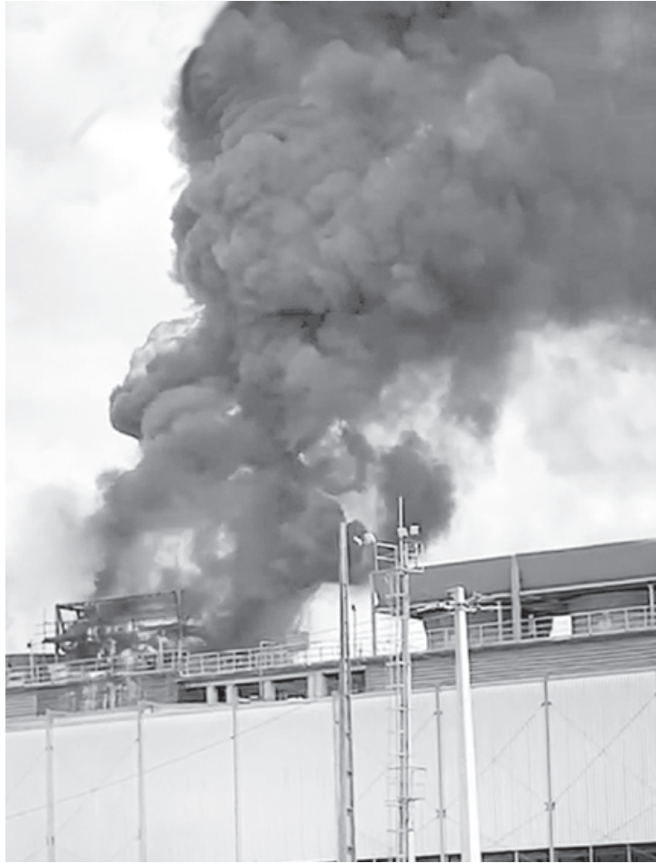
Incêndio atingiu parte do sistema da torre de refrigeração da fábrica de aços longos

Leia a nota na íntegra: “Um incêndio atingiu na manhã desta terça-feira, 28, parte do sistema da torre de refrigeração da fábrica de aços longos, na Usina Presidente Vargas. Embora o incêndio tendo sido de pequeno porte, o produto atingido pelo fogo chegou a gerar uma coluna de fumaça, que foi identificada às 10h20 e controlado às 10h40, após a chegada dos bombeiros. Não houve qualquer pessoa ferida no episódio e as causas do incêndio estão sendo investigadas”, informou.