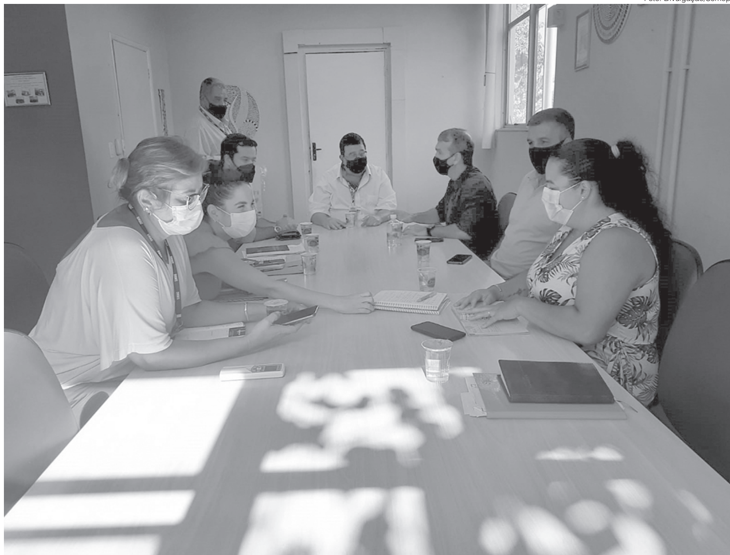
Polícia Civil de Volta Redonda reativará Núcleo do Idoso em parceria com a Prefeitura