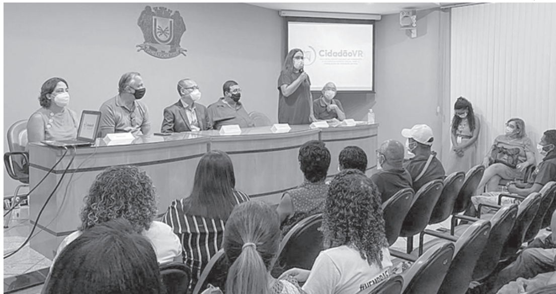
Iniciativa vai auxiliar flanelinhas e pessoas em situação de rua a se qualificarem profissionalmente