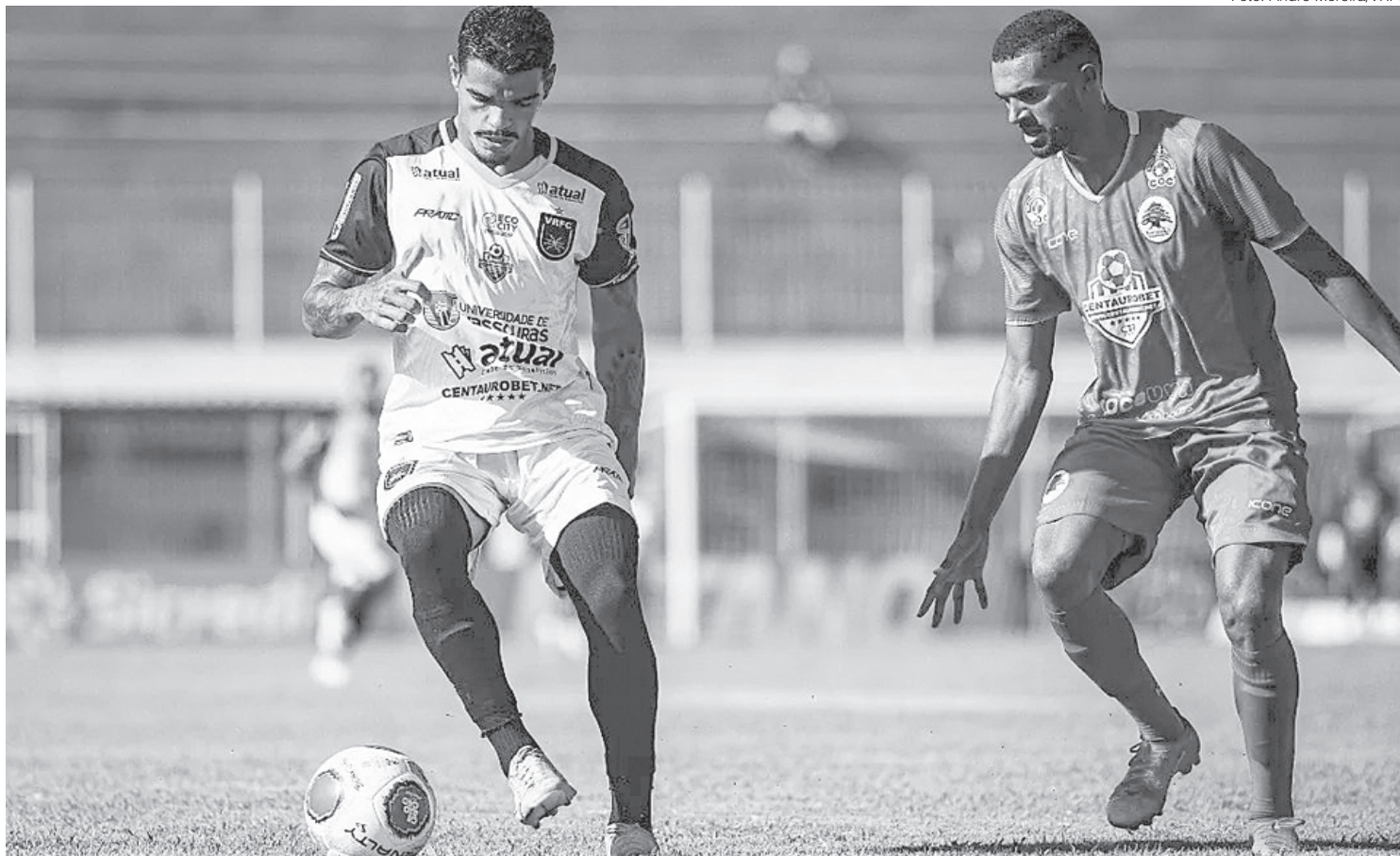
Voltaço com apenas três pontos e uma vitória está matematicamente rebaixado da elite carioca

O Volta Redonda visita a Portuguesa no Estádio Luso-Brasileiro, às 16h, enquanto o Boavista, no mesmo horário, recebe o Fluminense no Elcyr Resende.