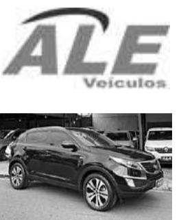
KIA SPORTAGE EX 2.0 AUT.

*Freios ABS. Direção elétrica. Airbags frontais. Ar condicionado. Bancos revestidos em couro. Regulagem do volante. Vidros elétricos. Conexão USB/Bluetooth. Alarme. Trava central. Faróis de neblina. Câmera de estacionamento. Sensor de estacionamento traseiro. Ajuste elétrico dos retrovisores. Computador de bordo. R$ 56.900,00. (24)99811-1412 www.aleveiculos.com.br