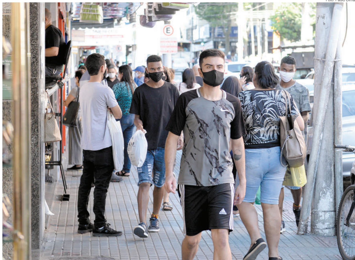
Municípios poderão optar por não utilizá-las em locais abertos e fechados

Obrigatoriedade da proteção facial será apenas em postos de saúde e hospitais