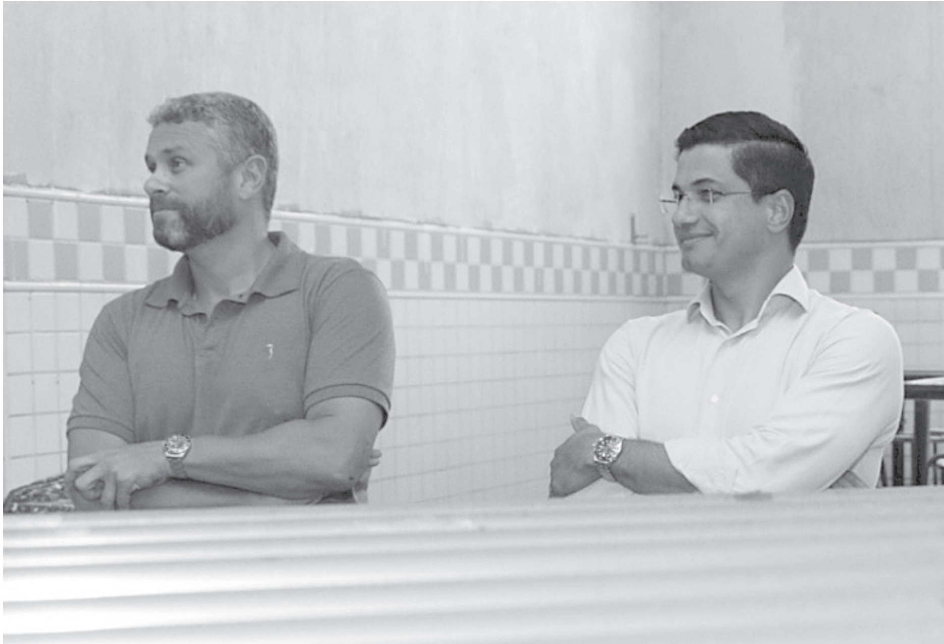
Prefeito Rodrigo Drable e deputado Danniel Librelon foram ao local onde funcionará o Restaurante Popular de Barra Mansa

Em 2016 o restaurante foi fechado devido à crise econômica pela qual o estado se encontrava. “A gente veio brigando muito pela reabertura do espaço, pois entendemos sua importância. E o deputado Danniel Librelon abraçou esta causa. Lembro como se fosse hoje, quando ele disse: ‘não vou te prometer, mas vou dar meu melhor para acontecer’. Sou muito grato. O deputado cumpriu a sua palavra”, pontuou Drable, destacando que a obra é extensa e deve durar seis meses. “Com as portas abertas e as alimentações sendo