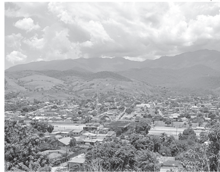
MPRJ vai ficar atento para denúncias sobre eleição em Itatiaia