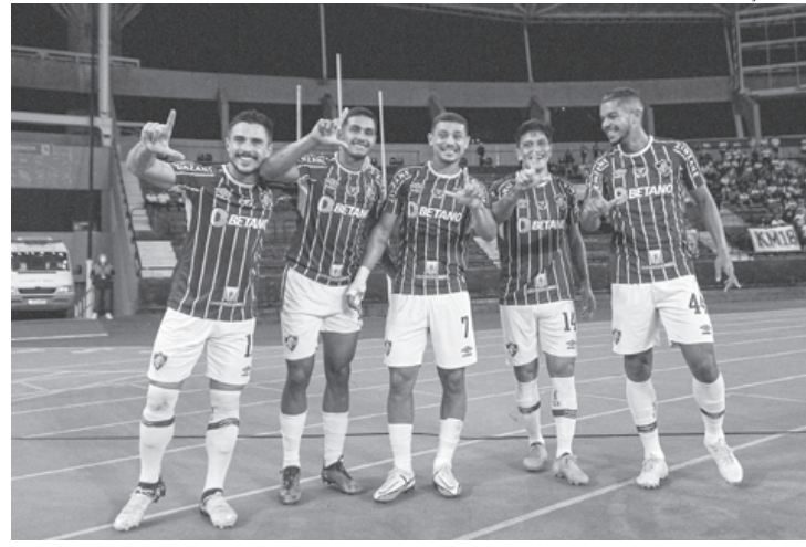
Fluminense alcançou sua 12ª vitória consecutiva ao derrotar o Olimpia-PAR por 3 a 1, na noite de quarta-feira

Em sua história, o Fluminense já conseguiu uma incrível série de 21 vitórias consecutivas, em 1959, com