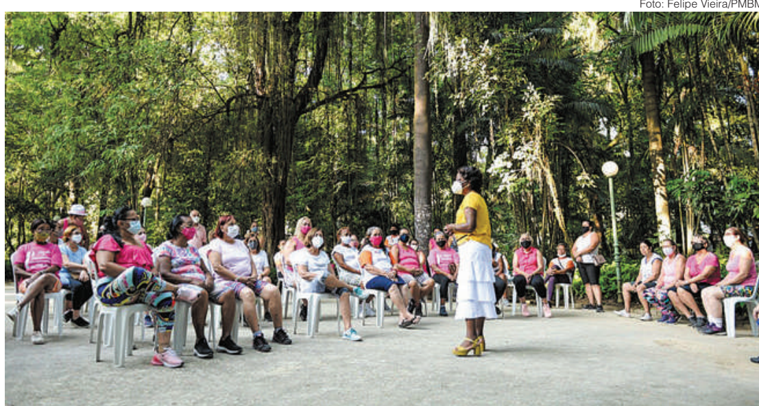
'+Ação, +Saúde, 50+' vai promover qualidade de vida dos idosos e foi lançado ontem com atividade no Parque Centenário