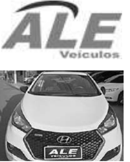
HYUNDAI HB20 R SPEC 1.6

*Freios ABS. Direção elétrica. Airbags frontais. Ar condicionado. Bancos revestidos em couro. Regulagem do volante. Vidros elétricos. Conexão USB/Bluetooth. Alarme. Trava central. Faróis de neblina. Câmera de estacionamento. Sensor de estacionamento traseiro. Ajuste elétrico dos retrovisores. Computador de bordo. R$ 56.900,00. (24)99811-1412 www.aleveiculos.com.br