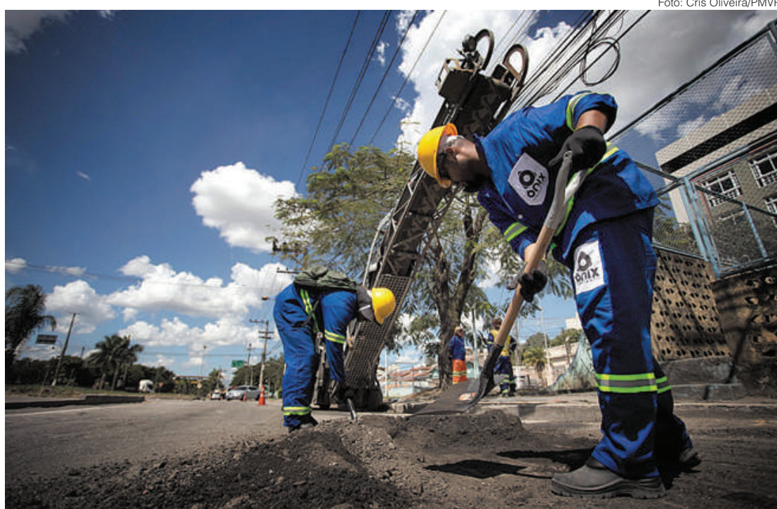
Trabalhos tiveram reinício ontem (10), a partir da Rodovia Sérgio Braga e alcançarão a Avenida Getúlio Vargas, no Centro