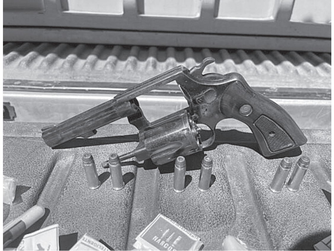
Mulher confessou que escondia arma e drogas no telhado de casa

A ocorrência da PM foi registrada na 108 DP (Três Rios), onde a mulher foi indiciada por tráfico de drogas e porte ilegal de armas.