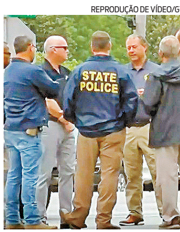
Polícia dos EUA investiga o caso