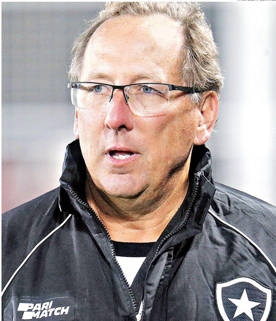
Dono da SAF do Botafogo, John Textor foi suspenso por 45 dias e multado em R$ 100 mil pelo STJD

Textor terá de responder pelas acusações, sem provas, de manipulação de resultados