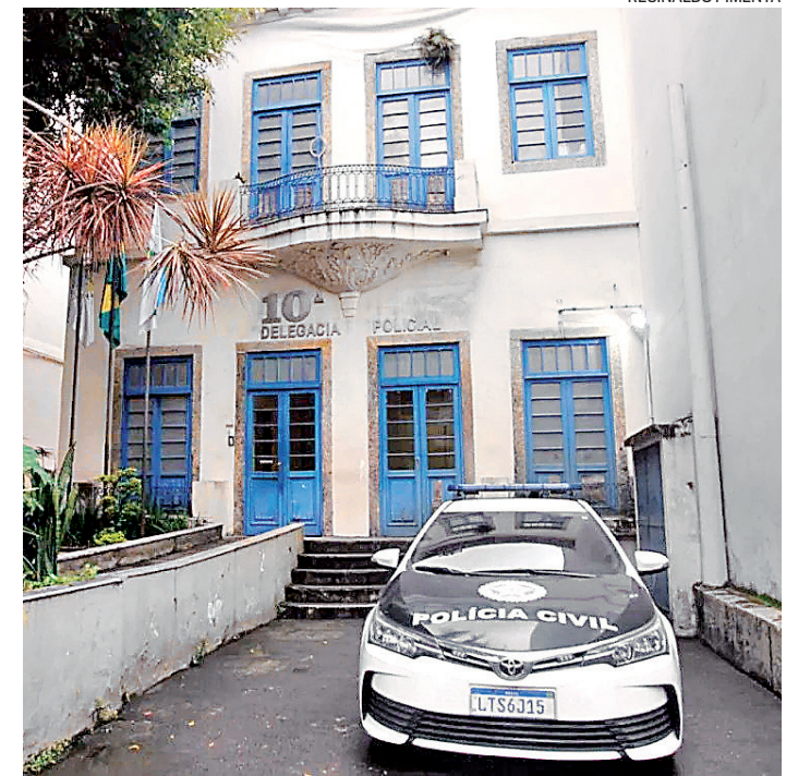
Policiais civis da 10ª DP (Botafogo) investigam o caso