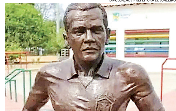
Obra em homenagem a Daniel Alves fica em sua cidade natal

Com passagens pelo Audax do Rio e de Osasco, Bruno Guimarães despontou para o futebol brasileiro em 2018 quando conquistou a Sul-Americana pelo Athletico-PR. No meio do ano seguinte foi negociado para o Lyon, da França. O volante foi contratado pelo Newcastle em 2022 por cerca de 42 milhões de euros (R$ 230 milhões na cotação atual). Bruno Guimarães fez parte do elenco da Seleção Brasileira que disputou a Copa do Mundo de 2022.