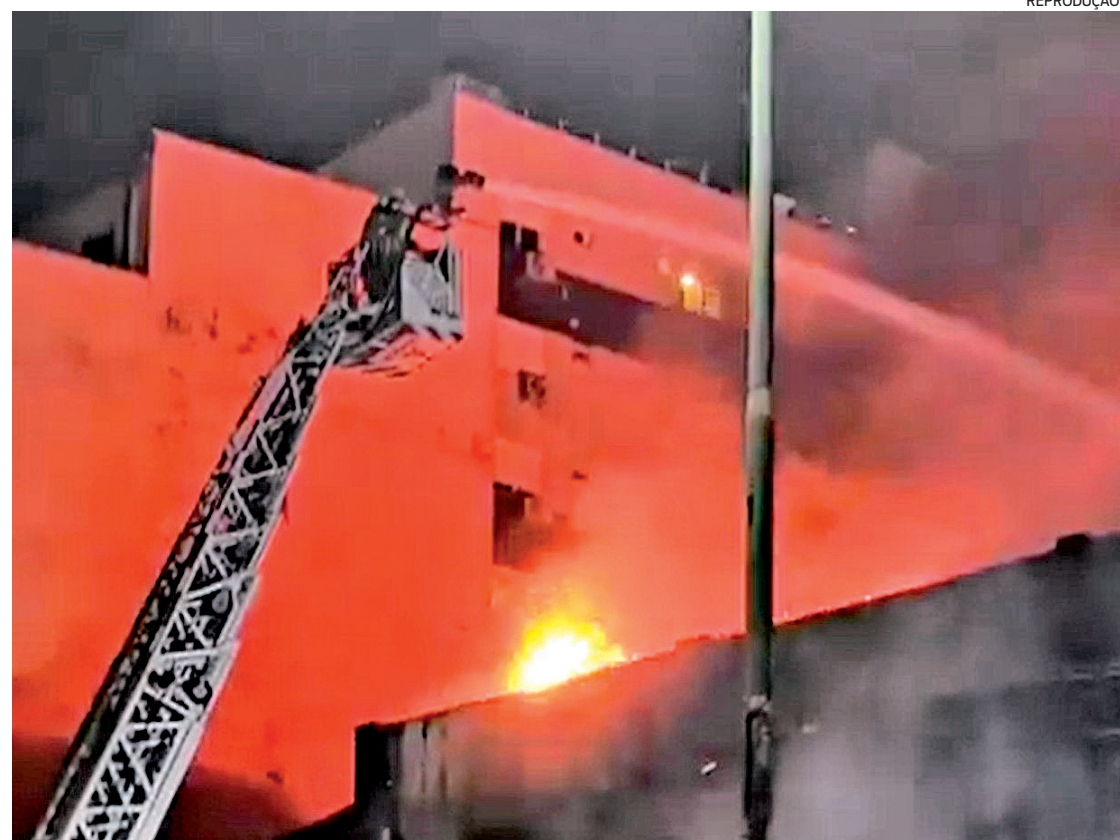
Os bombeiros fizeram alguns resgates internamente e também acolheram alguns feridos na calçada