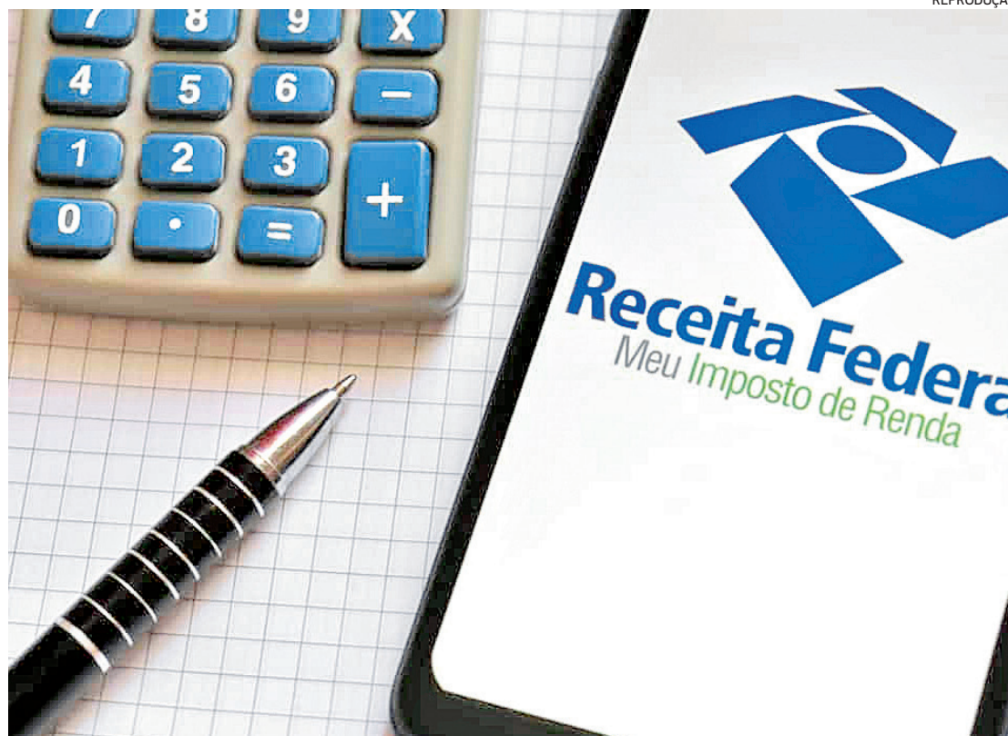
É fundamental saber qual modelo escolher na hora de preencher a declaração do Imposto de Renda

Ainda de acordo com Rodrigues, a declaração completa é recomendada para quem tem muitas despesas passíveis de deduções, pois pode resultar em um valor maior de restituição ou menor de imposto a pagar. No entanto, esse modelo exige um maior controle das despesas apuradas no ano-calandário, que deverão ser comprovadas caso solicita-