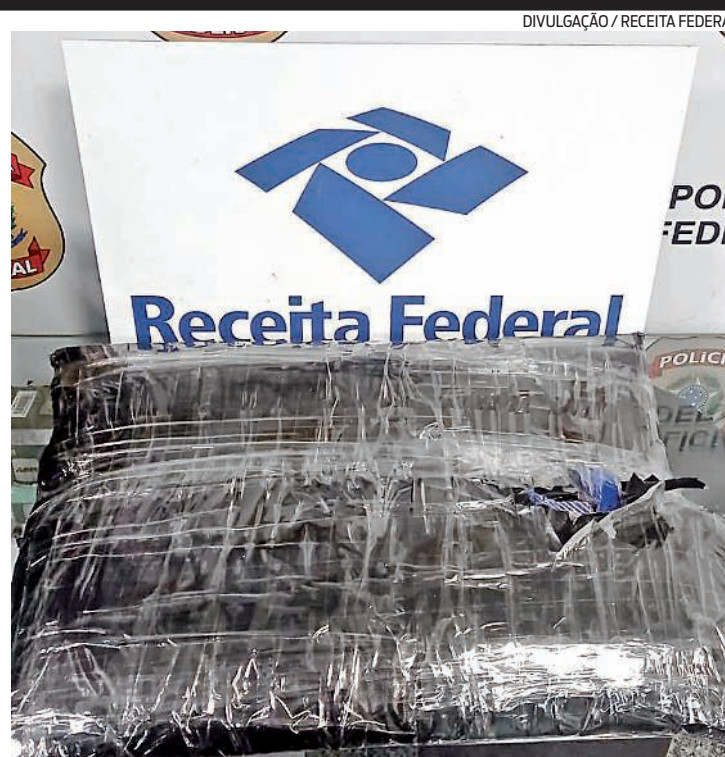
Passageiro desembarcava de voo vindo de Frankfurt, na Alemanha

A mala do homem foi selecionada para inspeção no aparelho de raios-X, que identificou a existência de um conteúdo suspeito. O passageiro, então, abriu a bagagem e os agentes encontraram a substância escondida em um fundo falso. Um teste identificou a presença do entorpecente e o espanhol foi preso em flagrante.