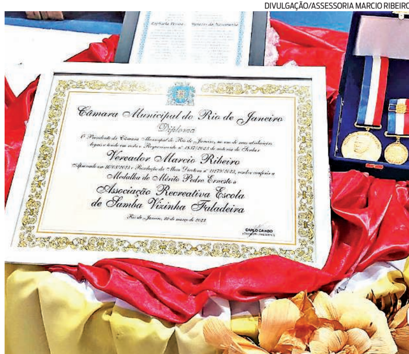
Vizinha Faladeira recebe Conjunto de Medalhas Pedro Ernesto.

Vizinha Faladeira é homenageada com Conjunto de Medalhas Pedro Ernesto. A iniciativa, do vereador Marcio Ribeiro, ressalta importante papel desempenhado pela agremiação. "A Vizinha Faladeira, uma das primeiras escolas de samba do Brasil, é fundamental para a história e a cultura do Carnaval carioca. A escola também é responsável por movimentar a economia local, gerando empregos e oportunidades para a comunidade", disse.