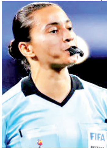
Edina irá apitar no Beira-Rio