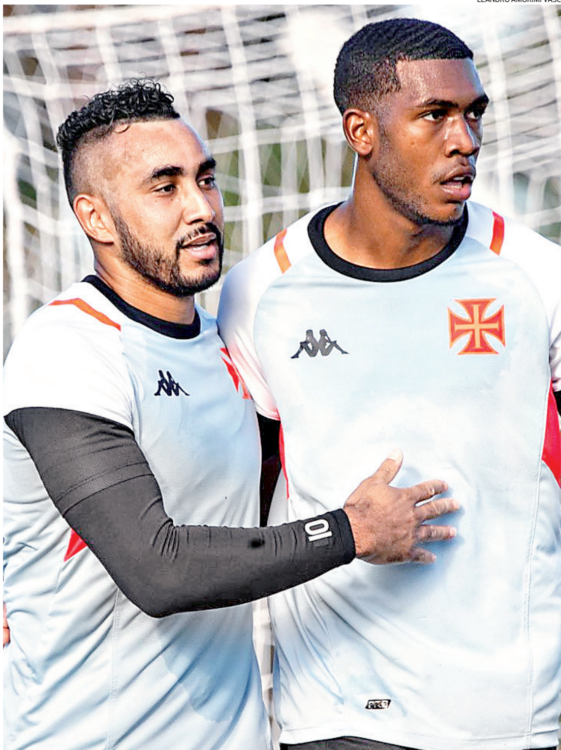
Payet e Rayan devem ser titulares contra o Criciúma: o Vasco precisa voltar a vencer no Brasileiro

Local: São Januário. Árbitro: Caio Augusto Vieira (RN). Horário: 16h