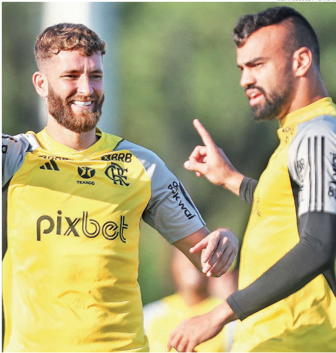
Até a estreia na Libertadores, contra o Millonarios, o Flamengo havia levado apenas um gol no ano

Antes da estreia no Brasileiro, contra o Atlético-GO, o Rubro-Negro tinha 17 jogos e apenas dois gols sofridos. Porém, a partir dessa partida, passou a viver uma oscilação defensiva. Começou batendo o Dragão, mas levou um gol. No jogo seguinte, derrotou o São Paulo, mas voltou a ser vazado. Empatou sem gols com o Palmeiras e perdeu