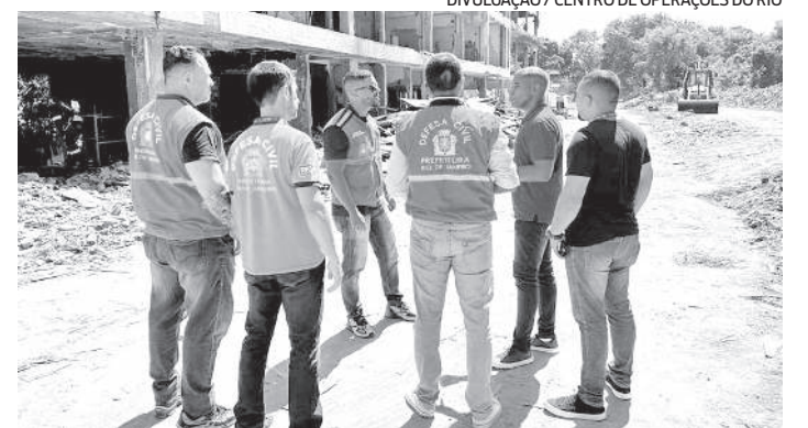
A operação deve envolver mais de 155 agentes de vários órgãos

Reportagem do estagiário João Pedro Bellizzi , sob supervisão de Raphael Perucci