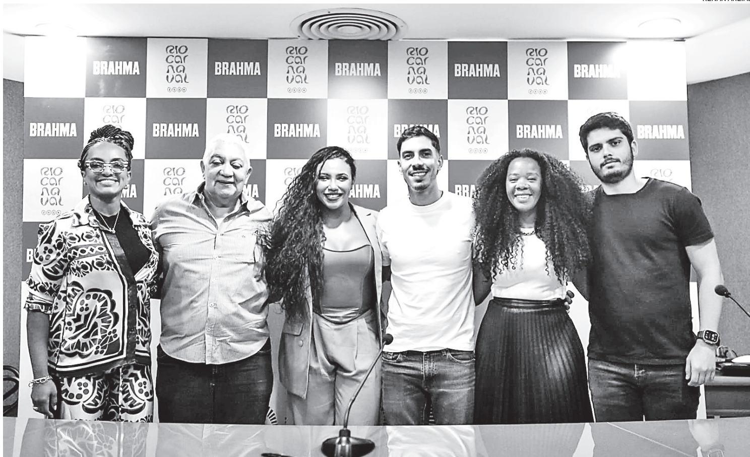
Membros da nova diretoria da Liga Independente das Escolas de Samba do Rio (Liesa) durante apresentação à imprensa