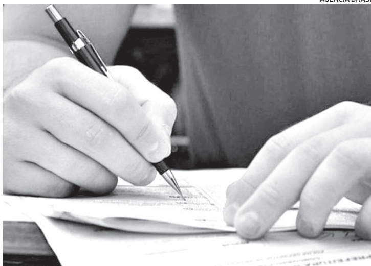
Para manter a lisura da prova, foram definidas normas de segurança

Para manter a segurança e a lisura da prova, foram definidas diretrizes de segurança dentro e fora dos locais de aplicação. Dentro das salas de aula, os fiscais foram orientados a não permitir que os candidatos saiam com o caderno de provas e nem rea-