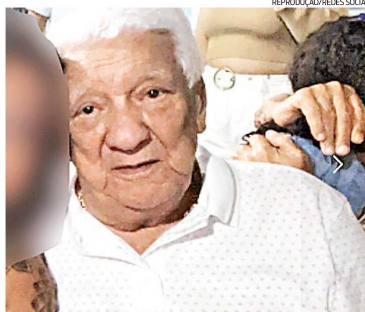
Piruinha participou do julgamento por videoconferência

Piruinha participou do julgamento por videoconferência de uma cama hospitalar e não foi interrogado. A defesa do contraventor alegou que faltou investigação