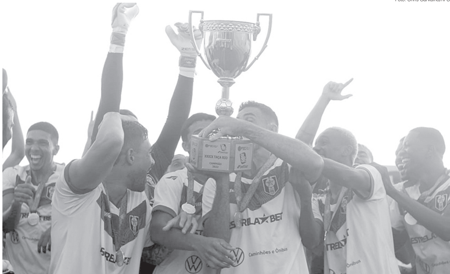
Jogadores do Resende comemoram a conquista da Taça Rio, em Nova Iguaçu