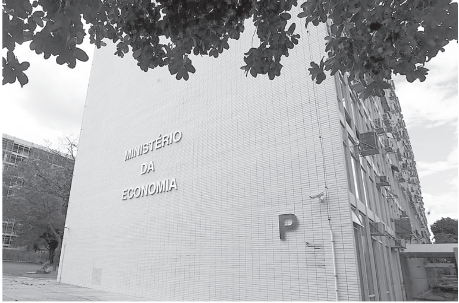
Ministério do Planejamento constata déficit fiscal menor do que o esperado pelo mercado

As receitas com royalties de petróleo cresceram R$ 1,6 bilhão (+38,7%) acima do IPCA em fevereiro na comparação com o mesmo mês do ano passado, por causa da valorização do combustível no mercado internacional. Atualmente, a cotação do barril internacional está no