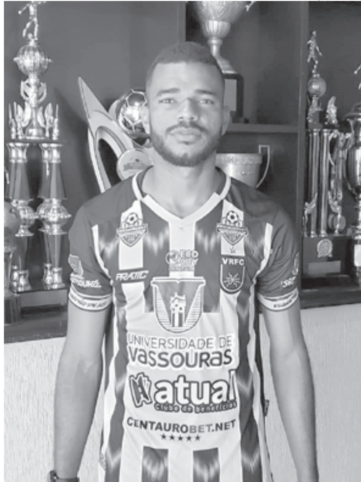
Defensor jogou no Campeonato Carioca deste ano pelo Audax Rio