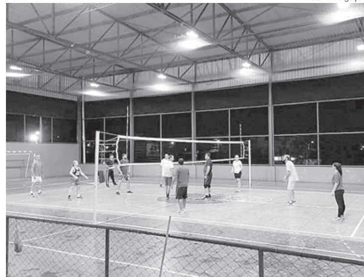
Projeto atende mais de 25 bairros e é destinado a crianças, adultos e idosos

O Projeto Treinamento, na modalidade de voleibol, faz parte de uma iniciativa que visa a retomada dos desportos coletivos da cidade. Além do vôlei, temos também o basquetebol e o handebol. Tem