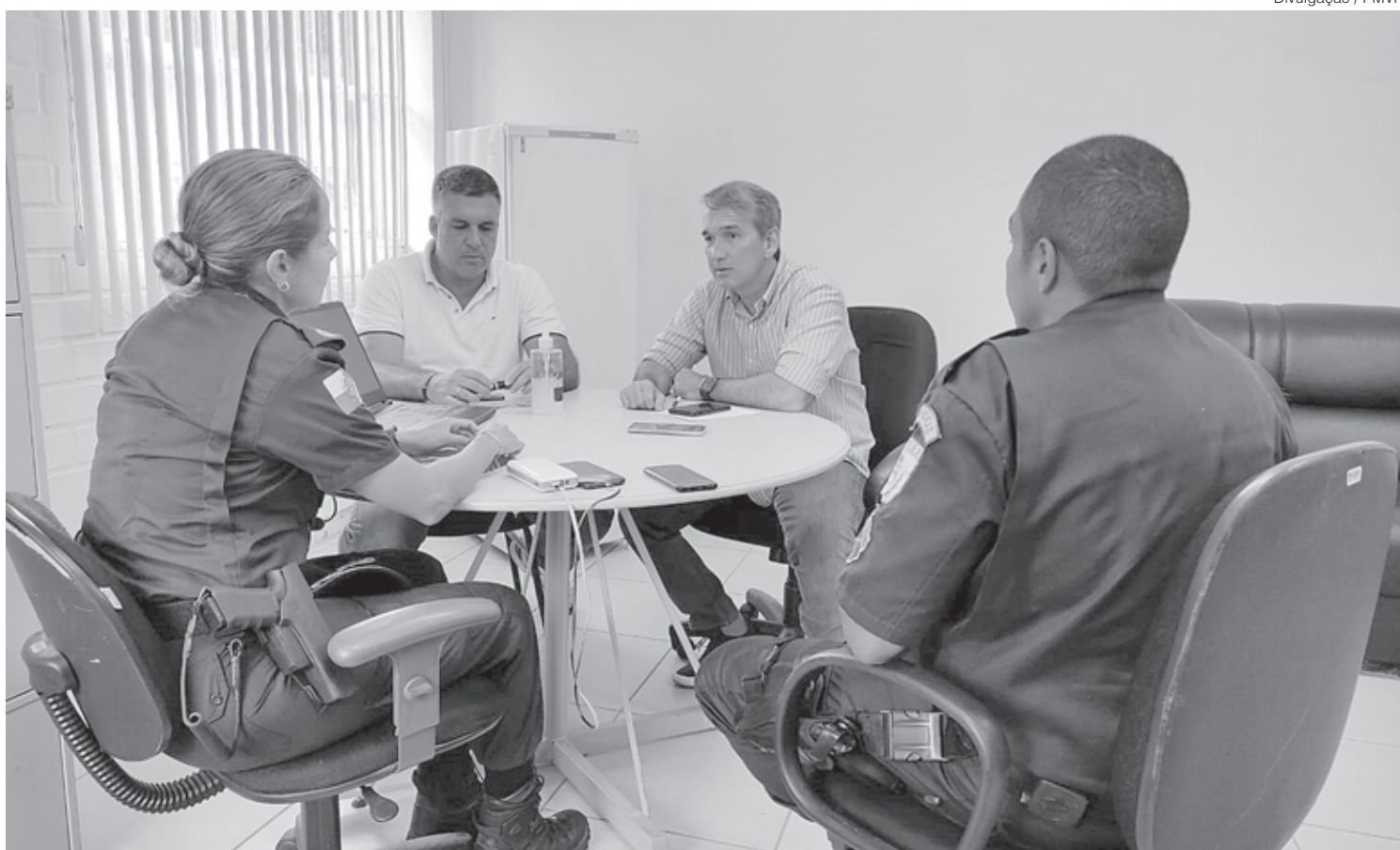
Programa Estadual de Integração na Segurança foi pauta de reunião na Secretaria Municipal de Ordem Pública