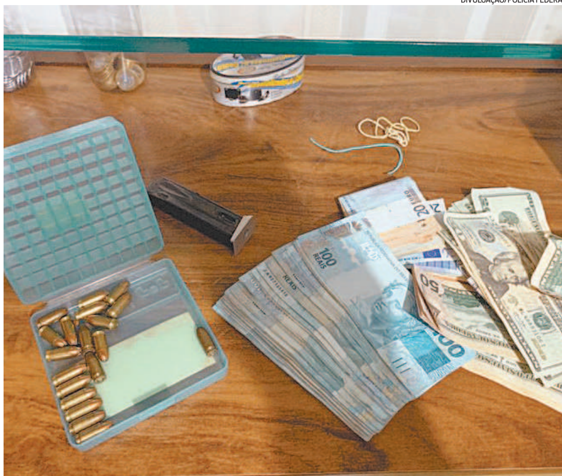
Grupo fez operações financeiras atípicas, segundo membros do Coaf, com valor superior a R$ 700 milhões