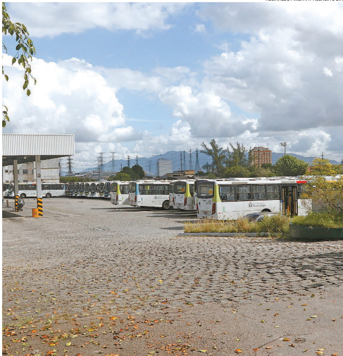
Sindicato dos Rodoviários fará uma assembleia amanhã com motoristas e cobradores da viação Acari

Paes disse ainda que já está estudando a colocação de operadores de forma emergencial. “Se os consórcios não tem condições de operar as linhas é melhor que desistam da concessão, simplificando a ação da prefeitura e o atendimento a população”, finalizou.