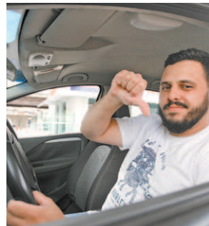
Thiago Silva: gasto maior