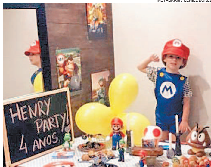
Pai do menino divulgou uma mensagem de carinho ao filho