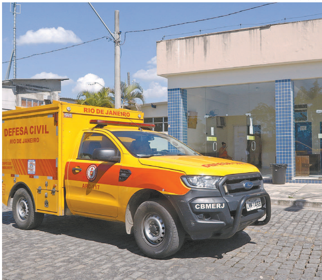
Testemunhas relataram que quatro homens passaram de carro pelo local atirando com pistolas e fuzis

Vítimas estavam em um bar. Quatro pessoas morreram no local e uma mulher de 35 anos faleceu no Hospital Geral de Nova Iguaçu