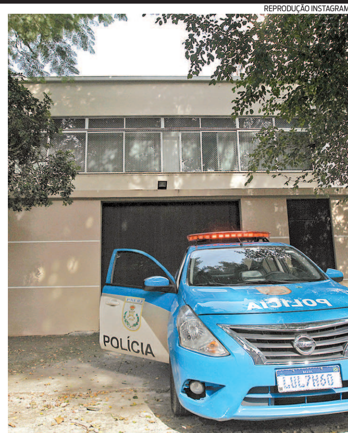
Policamento do 6º BPM acontece em rua no bairro do Grajaú

Ao longo da investigação, de aproximadamente um ano, foram identificados alvos antigos de operações da PF, como a Operação Navalha, Operação Prato Feito e Operação Zelotes. A investigação tramita na 6ª. Vara Criminal Federal de São Paulo, segunda fase da Operação Rei do Crime.